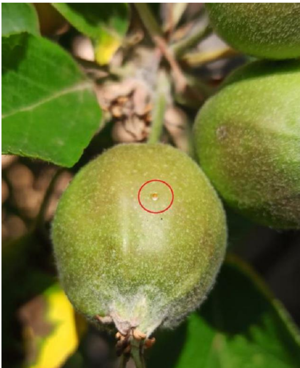
SLIKA 6. JAJE JABUKINOG SMOTAVCA PRED PILJENJE