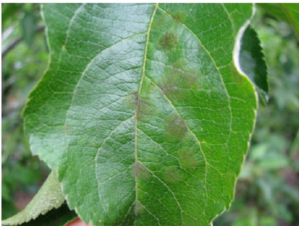
SLIKA 3. SIMPTOM ČAĐAVE PEGAVOSTI NA LISTU JABUKE