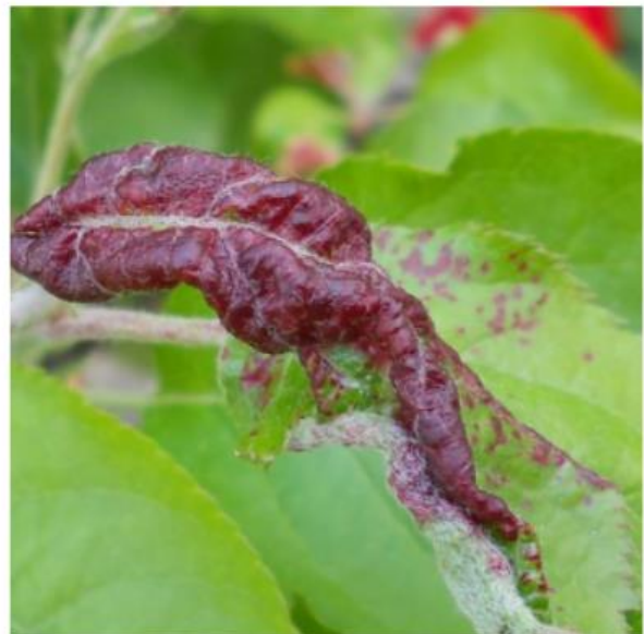
SLIKA 7. VAŠI NA JABUCI

..... POŠTOVANI POLJOPRIVREDNI PROIZVOĐAČI I POŠTOVANI GLEDAOCI, DETALJNIJE INFORMACIJE O POJAVI ŠTETNIH ORGANIZAMA I MERAMA KONTROLE MOŽETE POGLEDATI NA SAJTU PROGNOZNO IZVEŠTAJNE SLUŽBE ZAŠTITE BILJA VOJVODINE WWW.PISVOJVODINA.COM