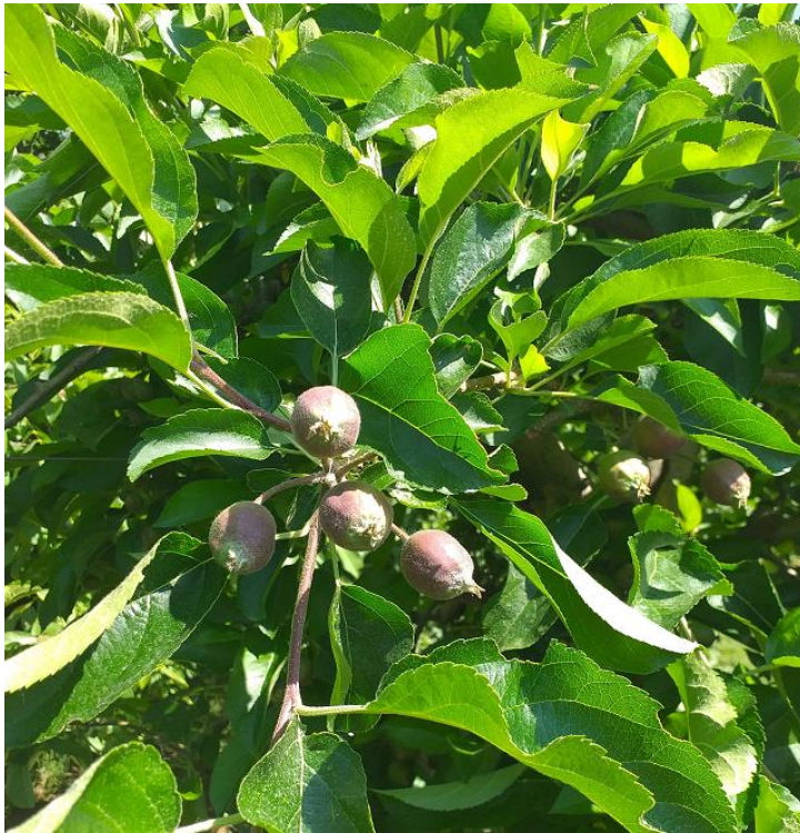
SLIKA 1. FAZA RAVOJA JABUKA

TAKOŽE, PREGLEDOM ZASADA JABUKA REGISTROVANO JE PRISUSTVO VAŠI I TO: ZELENE JABUKINE VAŠI, PEPELJASTE BRAŠNASTE VAŠI I LISNIH VAŠI CRVENIH GALA JABUKE. NAVEDENI INSEKTICIDI ZA SUZBIJANJE SMOTAVCA DELOVAĆE I NA SUZBIJANJE VAŠI.