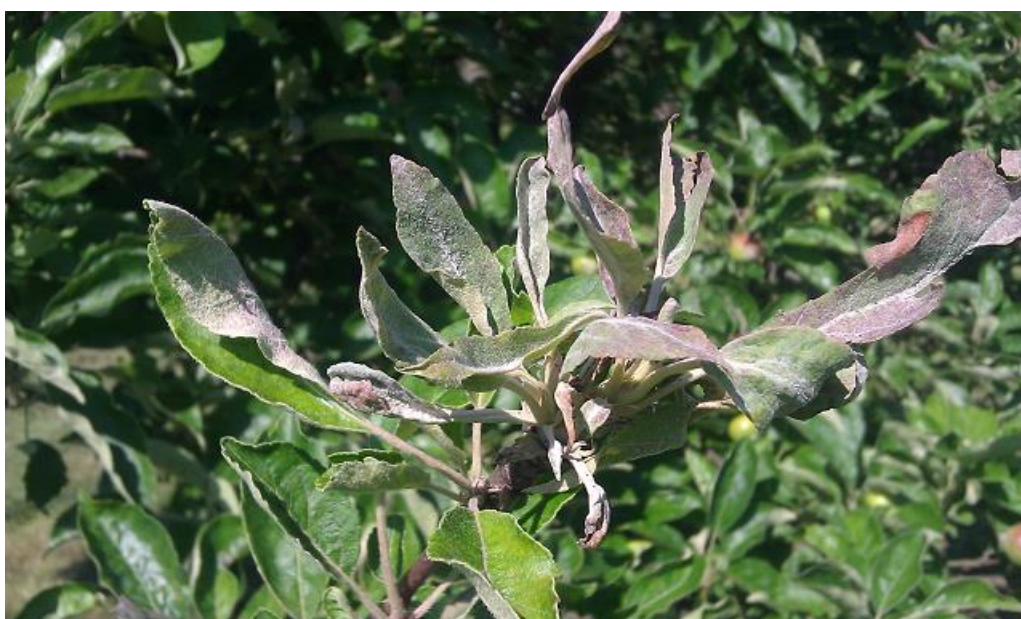
SLIKA 5. SIMPTOM PEPELNICE JABUKE