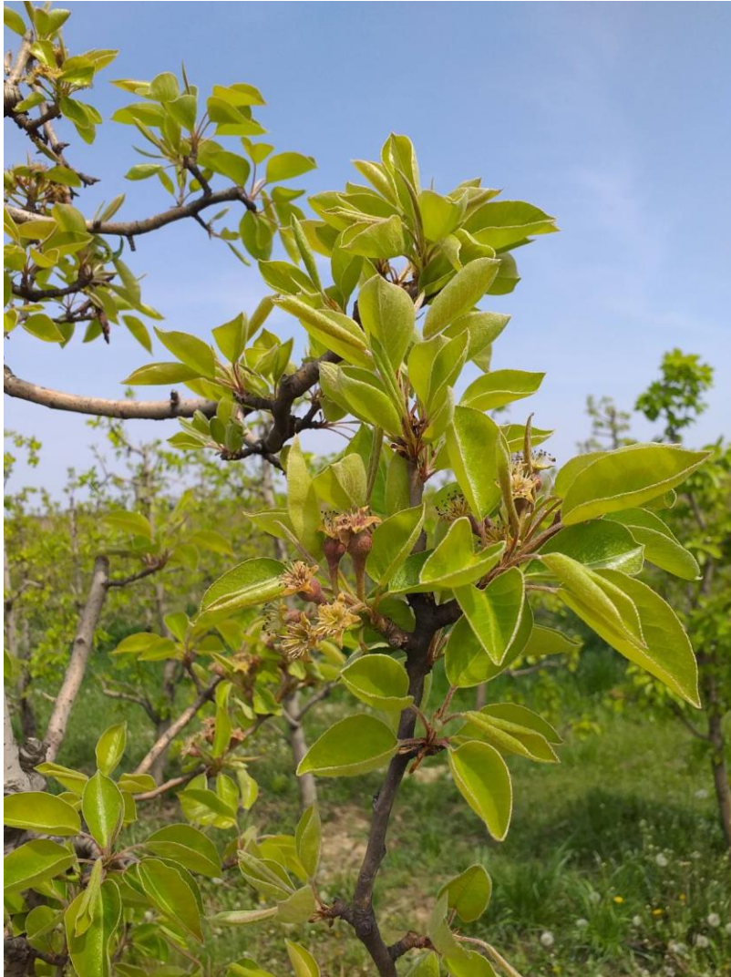
SLIKA 1: FAZA RAZVOJA KRUŠKE

NA PODRUČJU VOJVODINE KRUŠKE SE, U ZAVISNOSTI OD SORTIMENTA I LOKALITETA, NALAZE U FAZI OD PRECVETAVANJA DO FAZE POČETAK RAZVOJA PLODA.