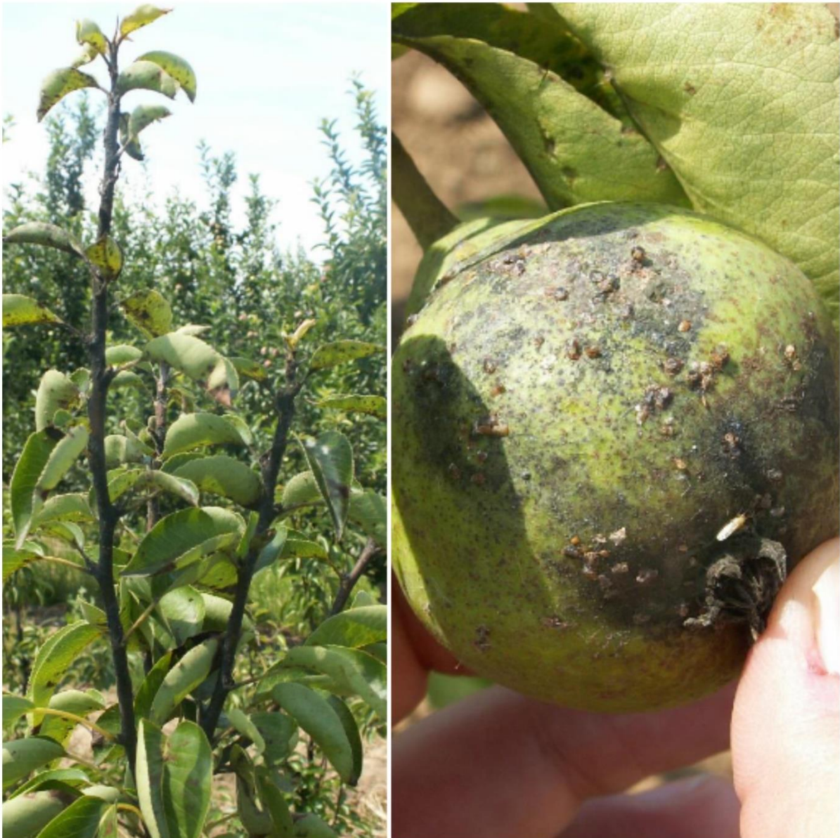
SLIKA 2: ŠTETE OD OBIČNE KRUŠKINE BUVE

ŠTO SE ODRAŽAVA NA SMANJENJE PRINOSA, A ČAĐAVI PLODOVI IMAJU MANJU TRŽIŠNU VREDNOST.