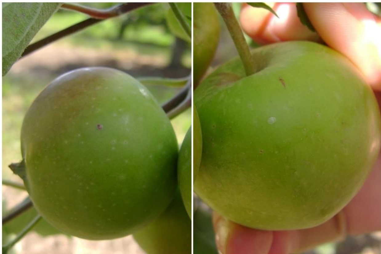
SLIKA 3. POLOŽENO JAJE JABUKINOG SMOTAVCA NA PLODOVIMA JABUKE

NA PODRUČJU VOJVODINE U TOKU JE POLAGANJE JAJA DRUGE GENERACIJE JABUKINOG SMOTAVCA. U REGIONIMA NOVOG SADA I PANČEVA REGISTRUJE SE I POČETAK PILJENJA LARVI, DOK SE NA OSTALIM REGIONIMA POČETAK PILJENJA LARVI PROGNOZIRA ZA POČETAK NAREDNE NEDELJE.