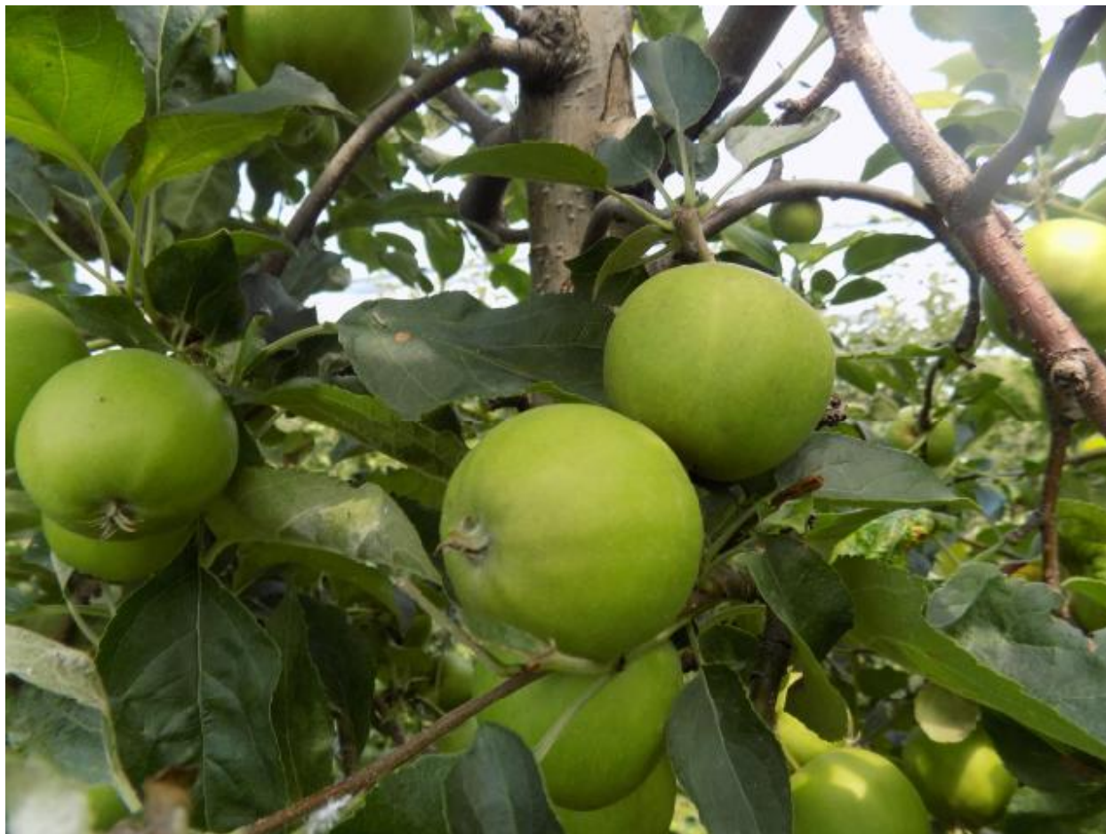
SLIKA 1. FAZA RAZVOJA JABUKE

NA PODRUČJU VOJVODINE JABUKE SE NALAZE U FAZI PORASTA PLODOVA KOJI SU DOSTIGLI OD 50 DO 80% KRAJNJE VELIČINE.