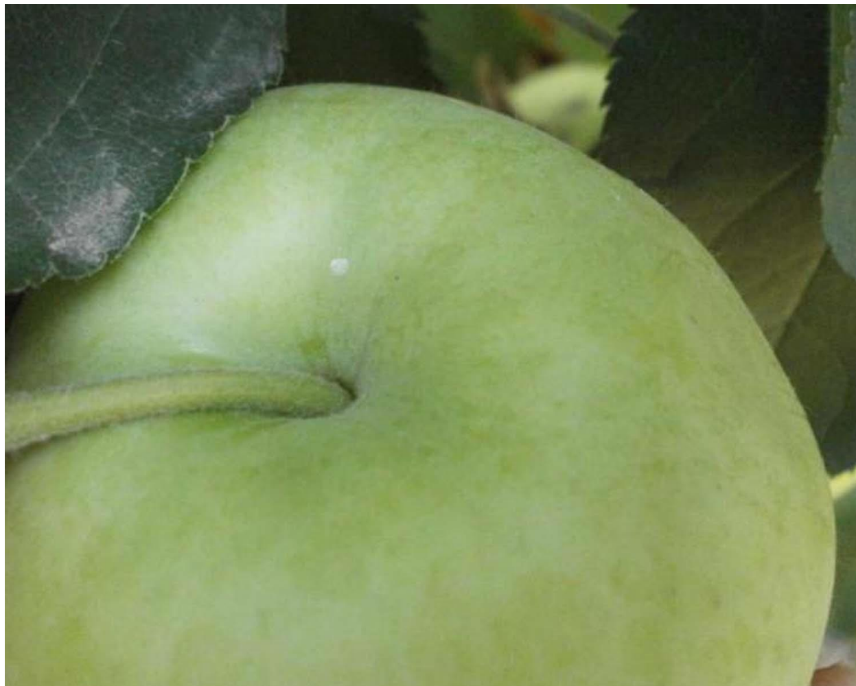
SLIKA 2. POLOŽENO JAJE JABUKINOG SMOTAVCA NA PLODU JABUKE

U VIZUELNIM PREGLEDIMA PLODOVA JABUKA, REGISTRUJU SE POLOŽENA JAJA JABUKINOG SMOTAVCA U RAZLIČITIM FAZAMA EMBRIONALNOG RAZVOJA.