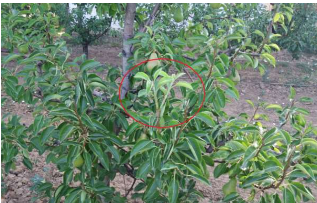
SLIKA 4. LETORAST SA NOVIM PRIRASTOM KOJI TREBA MEHANIČKI UKLONITI (ZELENA REZIDBA)