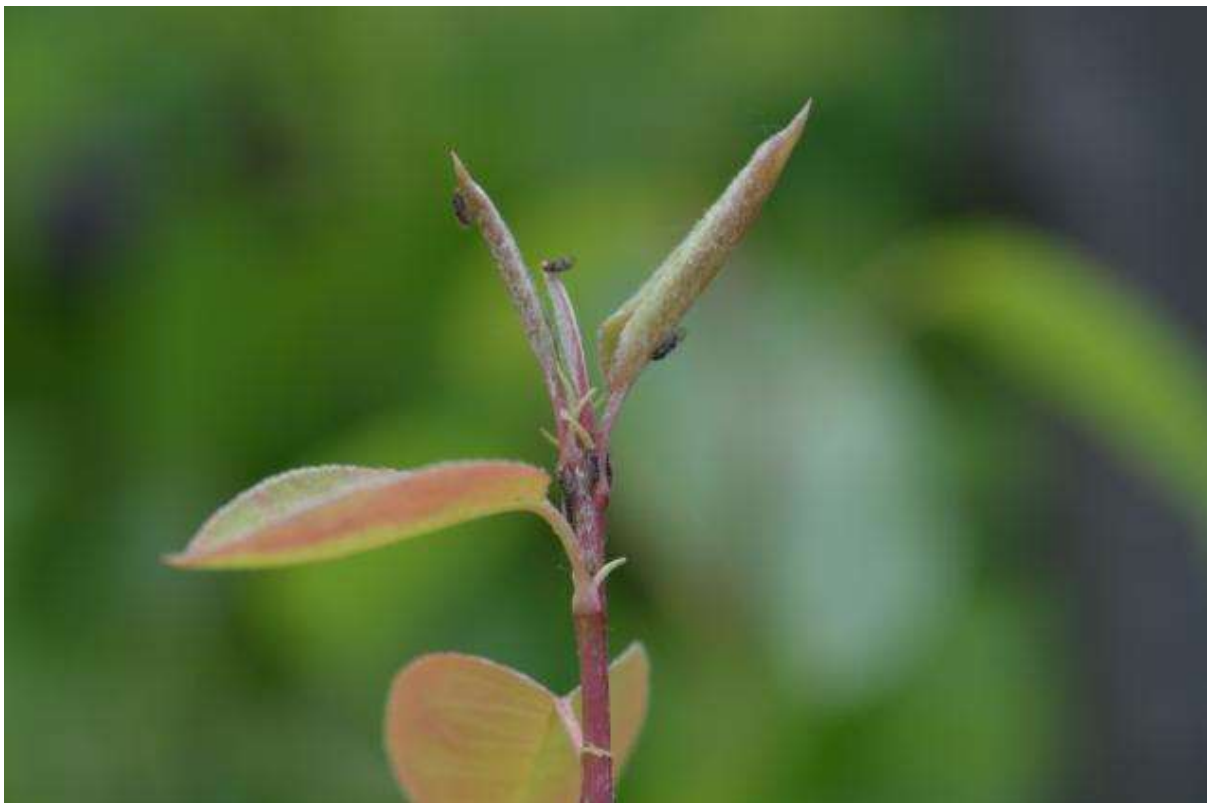
SLIKA 3. IMAGO KRUŠKINE BUVE NA VRŠNOM PORASTU