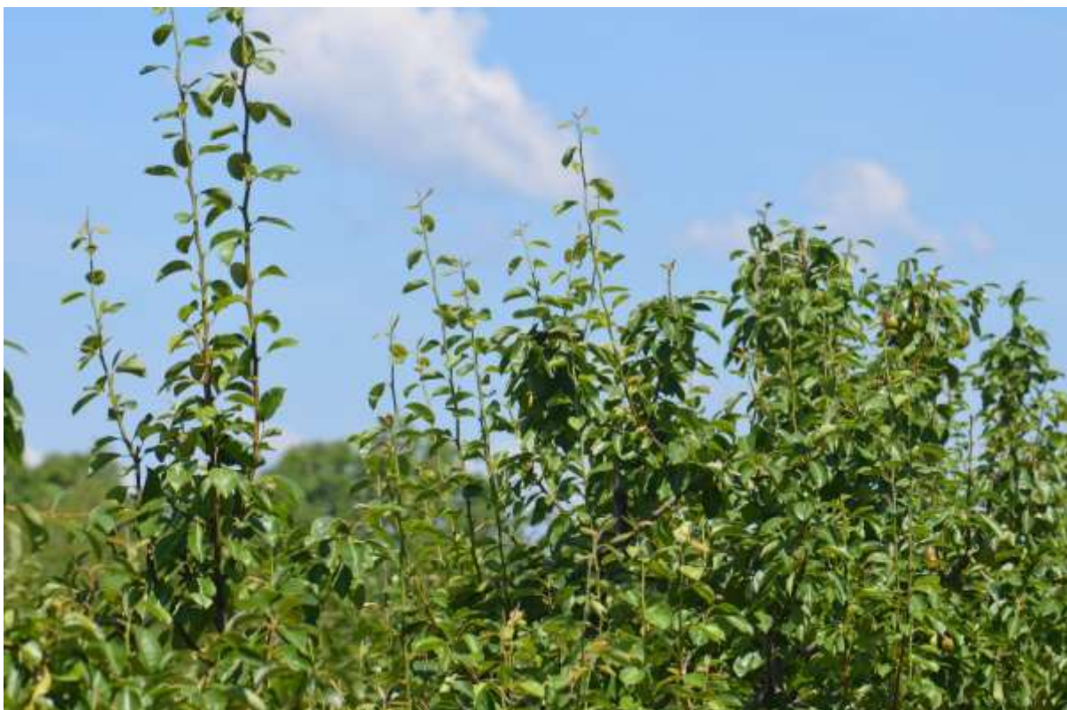
SLIKA 5. VODOPIJE NA KRUŠKAMA KOJE TREBA MEHANIČKI UKLONITI (ZELENA REZIDBA)