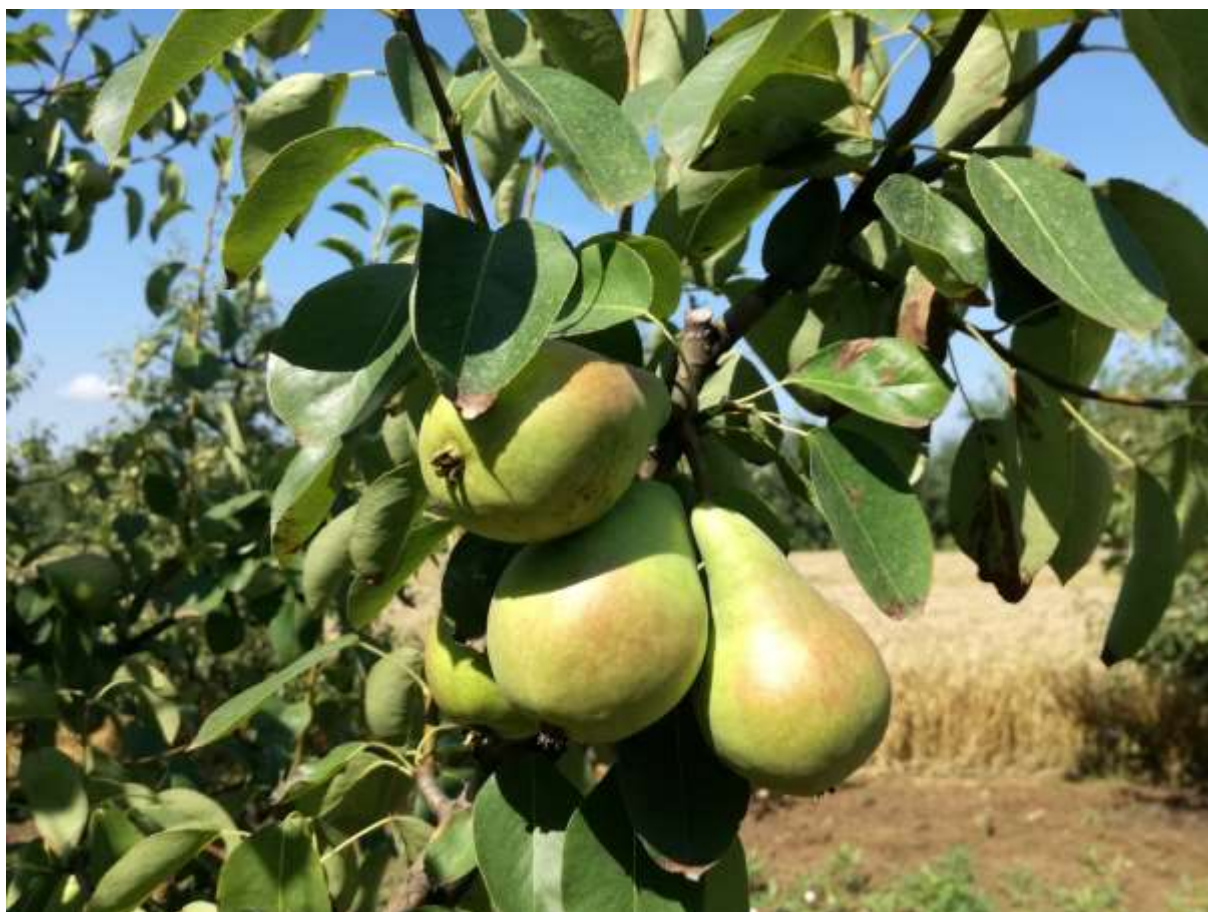
SLIKA 1. FAZA RAZVOJA KRUŠKE

NA PODRUČJU VOJVODINE SREDNJE I KASNE SORTE KRUŠAKA SE NALAZE U FAZI OD PLODOVI OKO 70% KRAJNJE VELIČINE DO POČETKA OBOJAVANJA PLODA. BERBA RANIH SORATA JE PRI KRAJU.