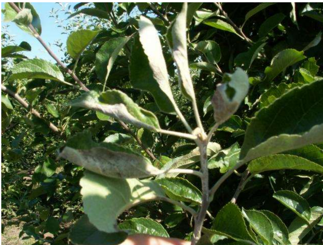
SLIKA 3. SIMPTOM PEPELNICE JABUKE