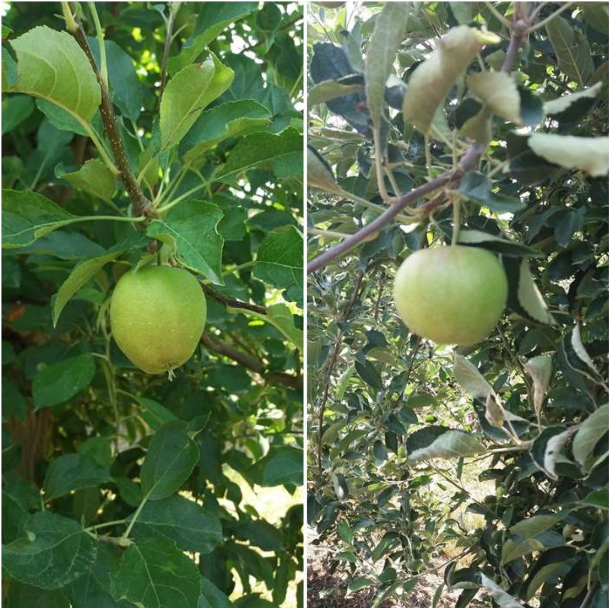
SLIKA 1. FAZE RAZVOJA JABUKE

NA PODRUČJU VOJVODINE JABUKE SE NALAZE U FAZI PORASTA PLODOVA KOJI SU DOSTIGLI OD 50 DO 70% KRAJNJE VELIČINE.