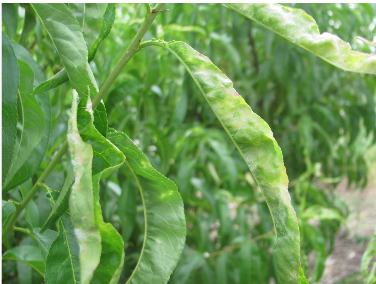
SLIKA 5. SIMPTOMI PEPELNICE NA LIŠČU BRESKVE