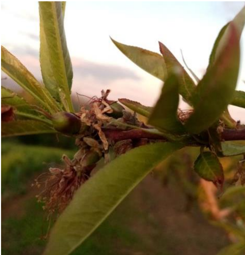
SLIKA 2. FAZA RAZVOJA NEKTARINE