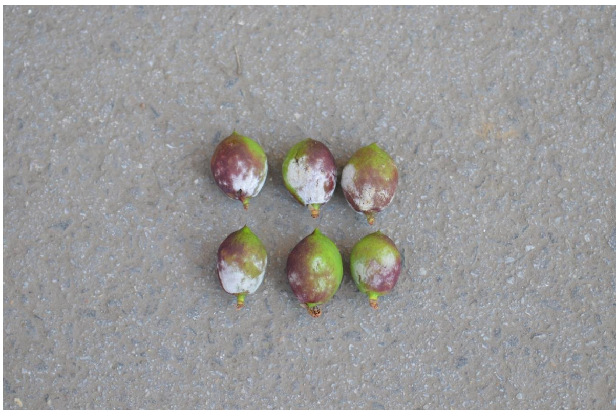
SLIKA 3. SIMPTOM PEPELNICE NA PLODOVIMA NEKTARINE