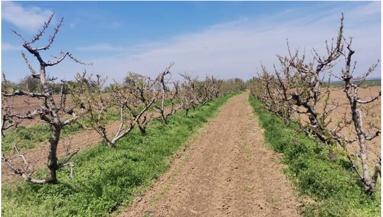
SLIKA 1. ZASAD BRESKVE