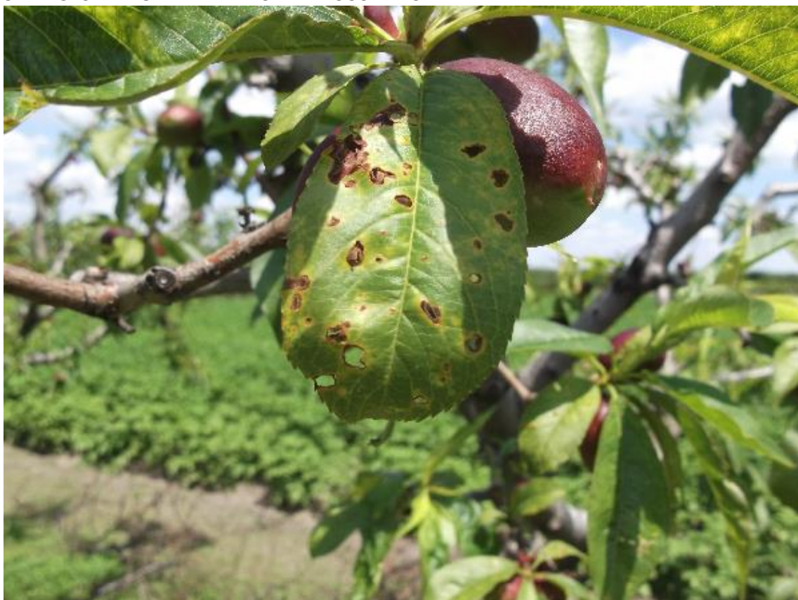
SLIKA 6. SIMPTOM ŠUPLJIKAVOSTI NA LISTU