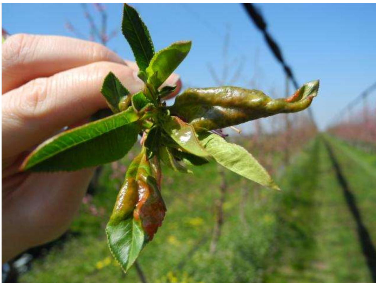
SLIKA 6. SIMPTOMI KOVRDŽAVOSTI U VEGETACIJI