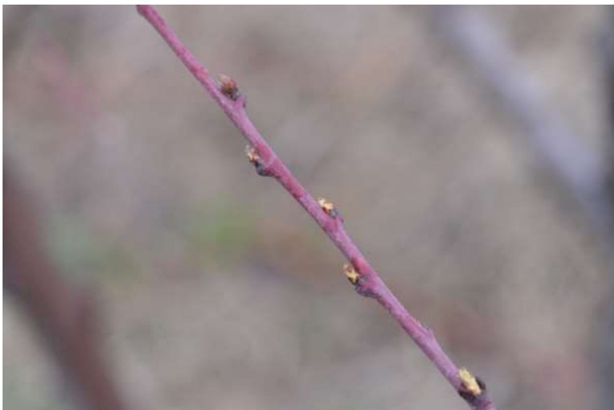
SLIKA 4. FAZA RAZVOJA BRESKVE (SREDNJESTASNI SORTIMENT)

NAJAVLJEN PORAST TEMPERATURA SA PADAVINAMA ZA OVU NEDELJU, MOŽE STVORITI POVOLJNE USLOVE ZA OSTVARENJE INFEKCIJA OD PROUZROKOVAČA DVA VEOMA ZNAČAJNA OBOLJENJA U PROIZVODNJI BRESAKA I NEKTARINA.