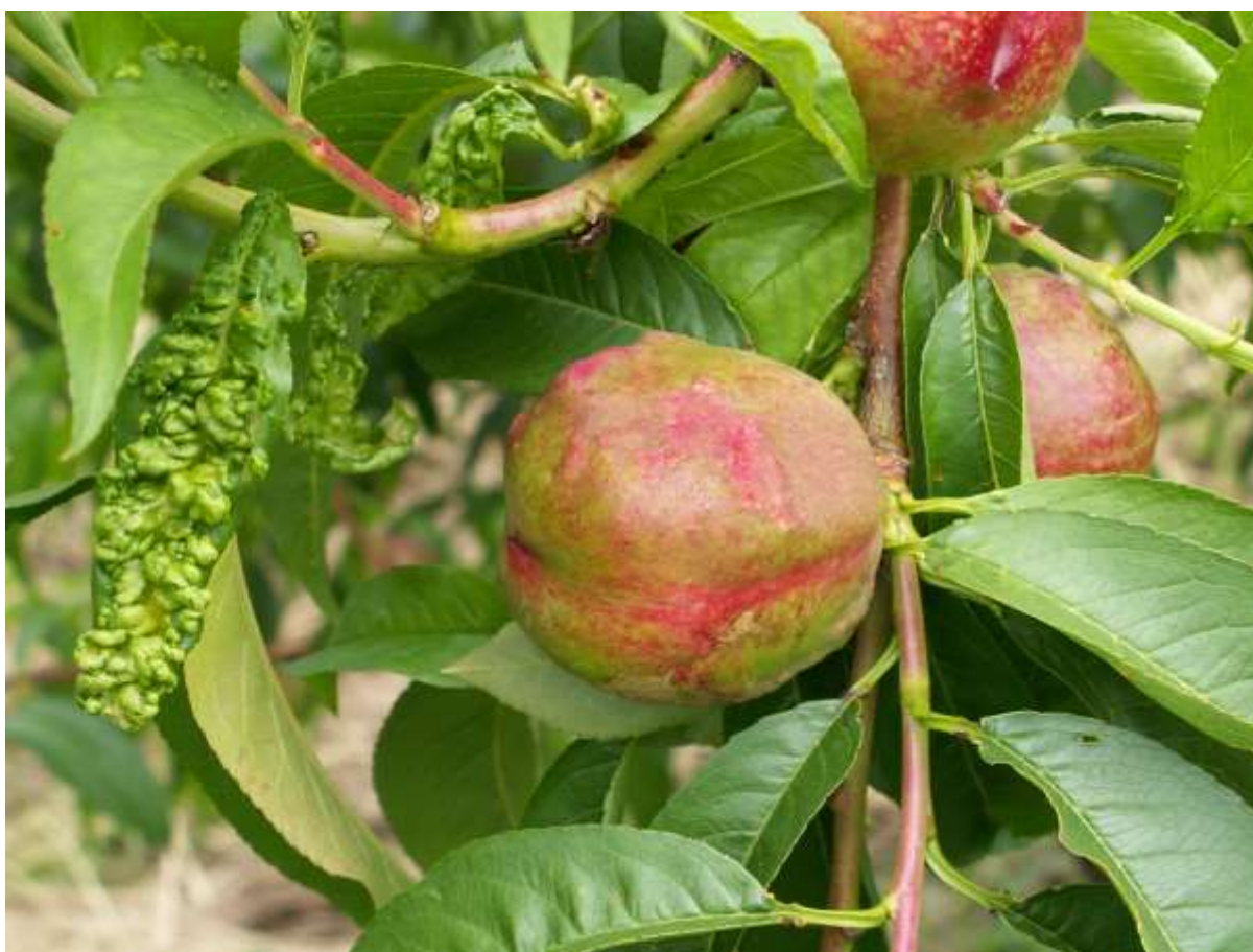
SLIKA 5. SIMPTOMI KOVRDŽAVOSTI U VEGETACIJI