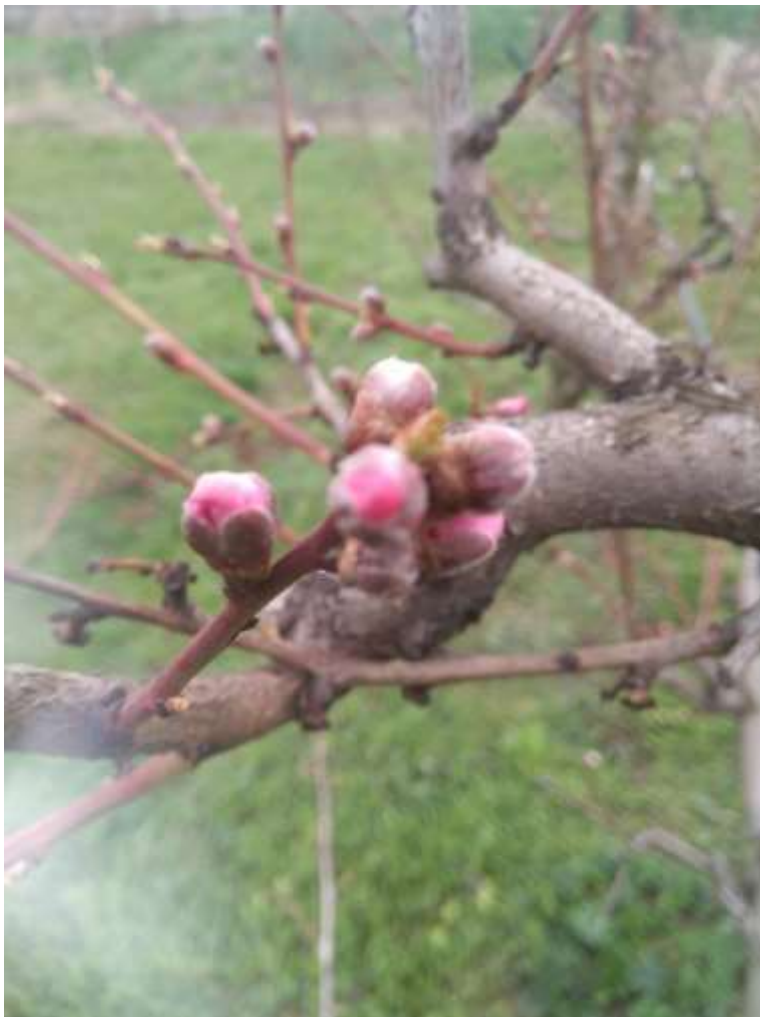
SLIKA 1. FAZA RAZVOJA BRESKVE (RANOSTASNI SORTIMENT)

SORTE KASNIH GRUPA ZRENJA NALAZE SE U FAZI OD BUBRENJA LISNIH PUPOLJAKA DO ZELEN I USKI LISTIĆI VIDLJIVI.