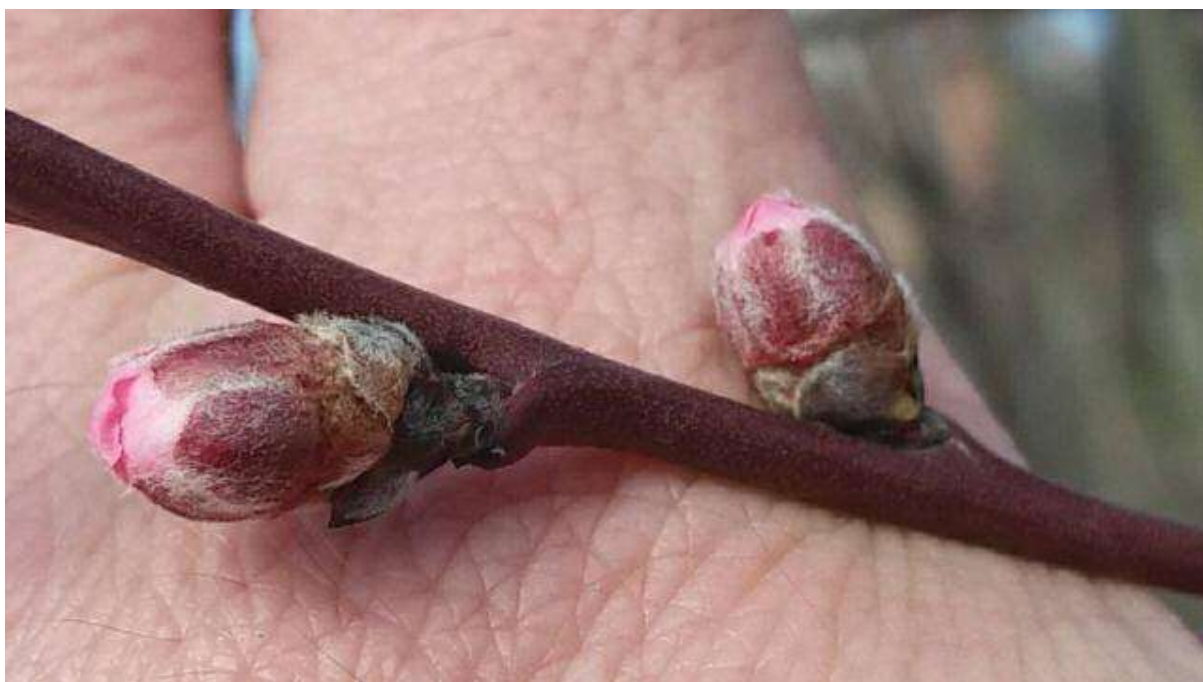
SLIKA 2. FAZA RAZVOJA BRESKVE (RANOSTASNI SORTIMENT)