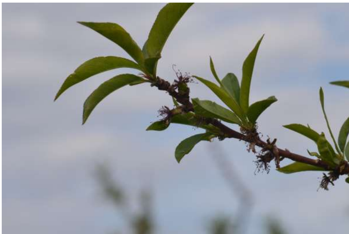
SLIKA 1. FAZA RAZVOJA NEKTARINE

NA PODRUČJU VOJVODINE ZASADI BRESAKA I NEKTARINA SE NALAZE U FAZI POČETKA RAZVOJA PLODA.