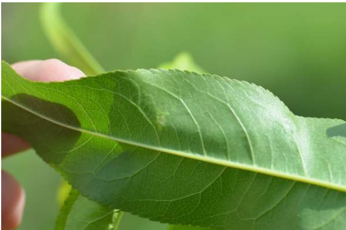
SLIKA 2. SIMPTOM PEPELNICE NA NALIČJU LISTOVA BRESKVE (SLIKA IZ PREDHODNE VEGETACIJE)