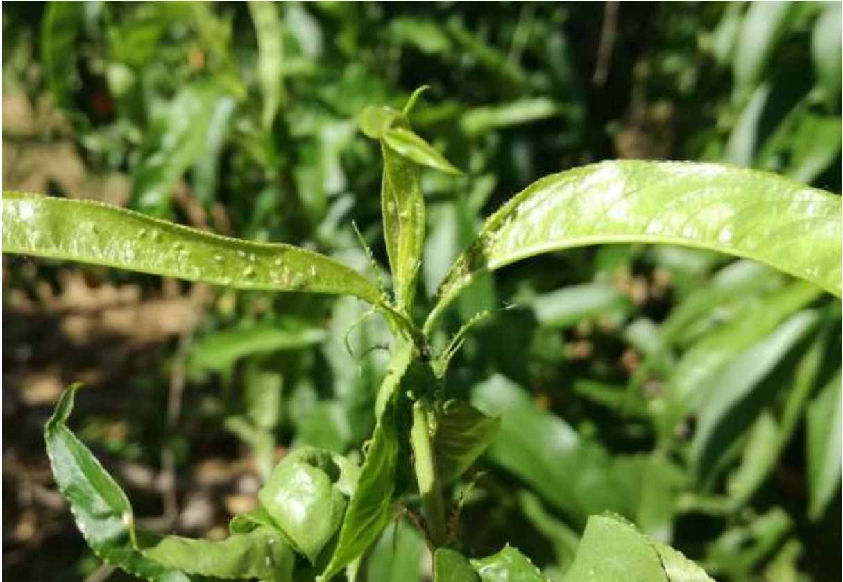
SLIKA 6. ZELENA BRESKVINA VAŠ