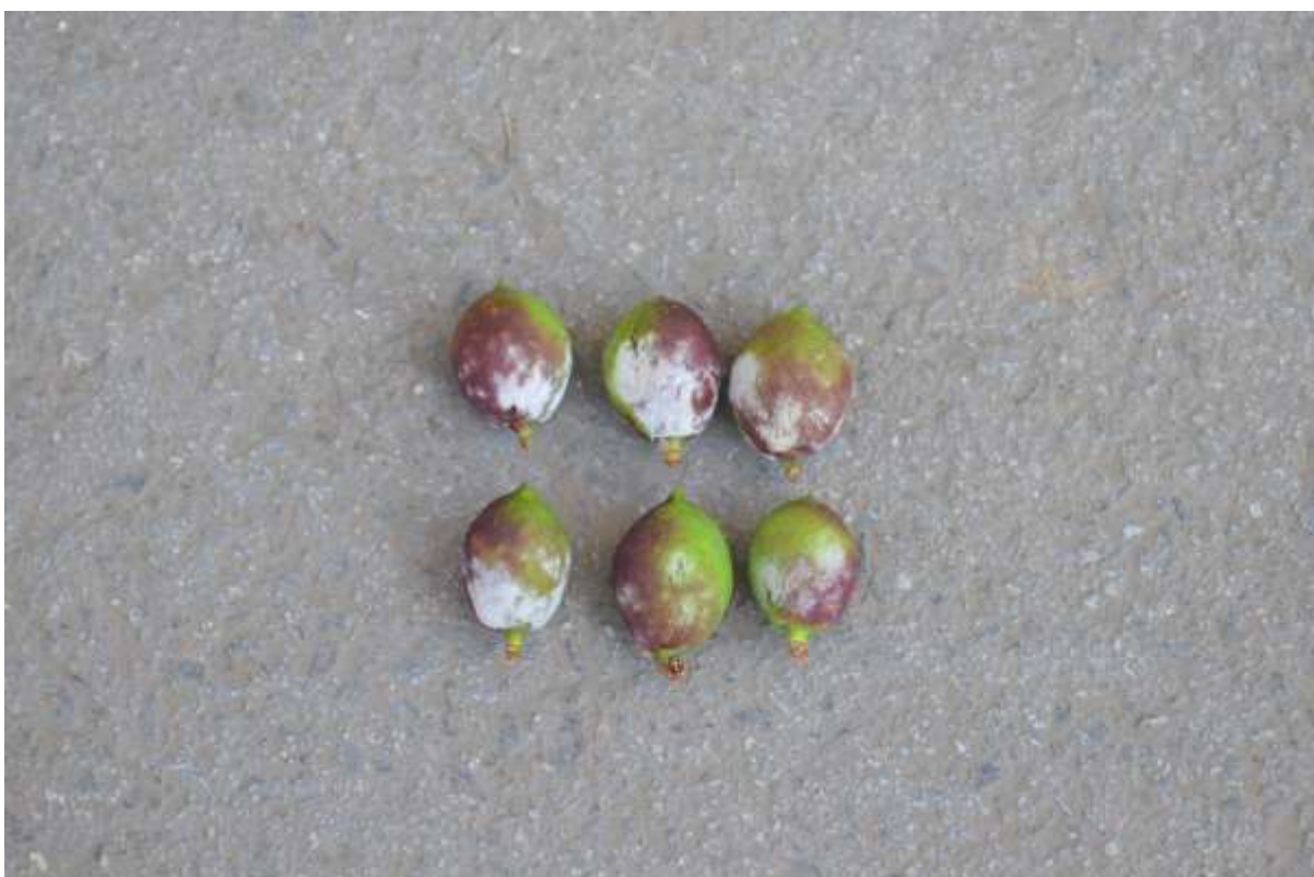
SLIKA 3. SIMPTOMI PEPELNICE NA PLODOVIMA NEKTARINE (SLIKA IZ PREDHODNE VEGETACIJE)