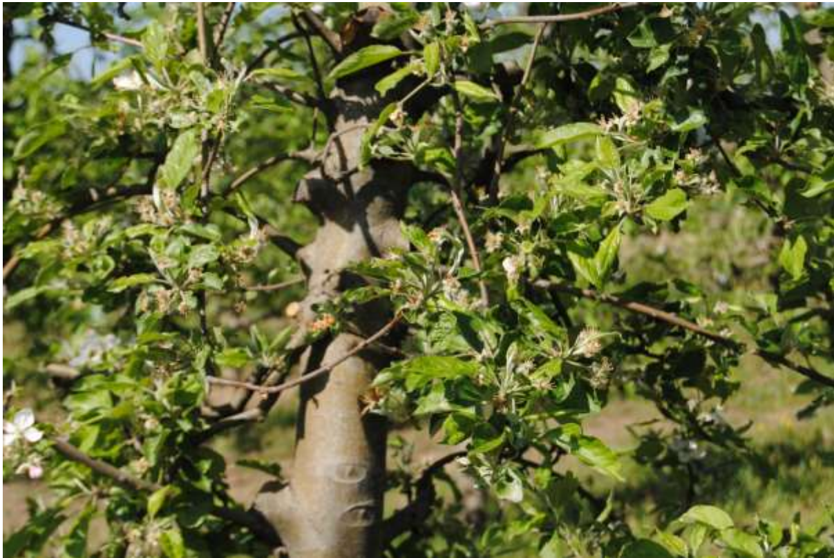
SLIKA 1. - FAZA RAZVOJA JABUKA

NA PODRUČJU VOJVODINE ZASADI JABUKA SE NALAZE U FAZI OD PRECVETAVANJA DO FAZE POČETKA RAZVOJA PLODOVA.