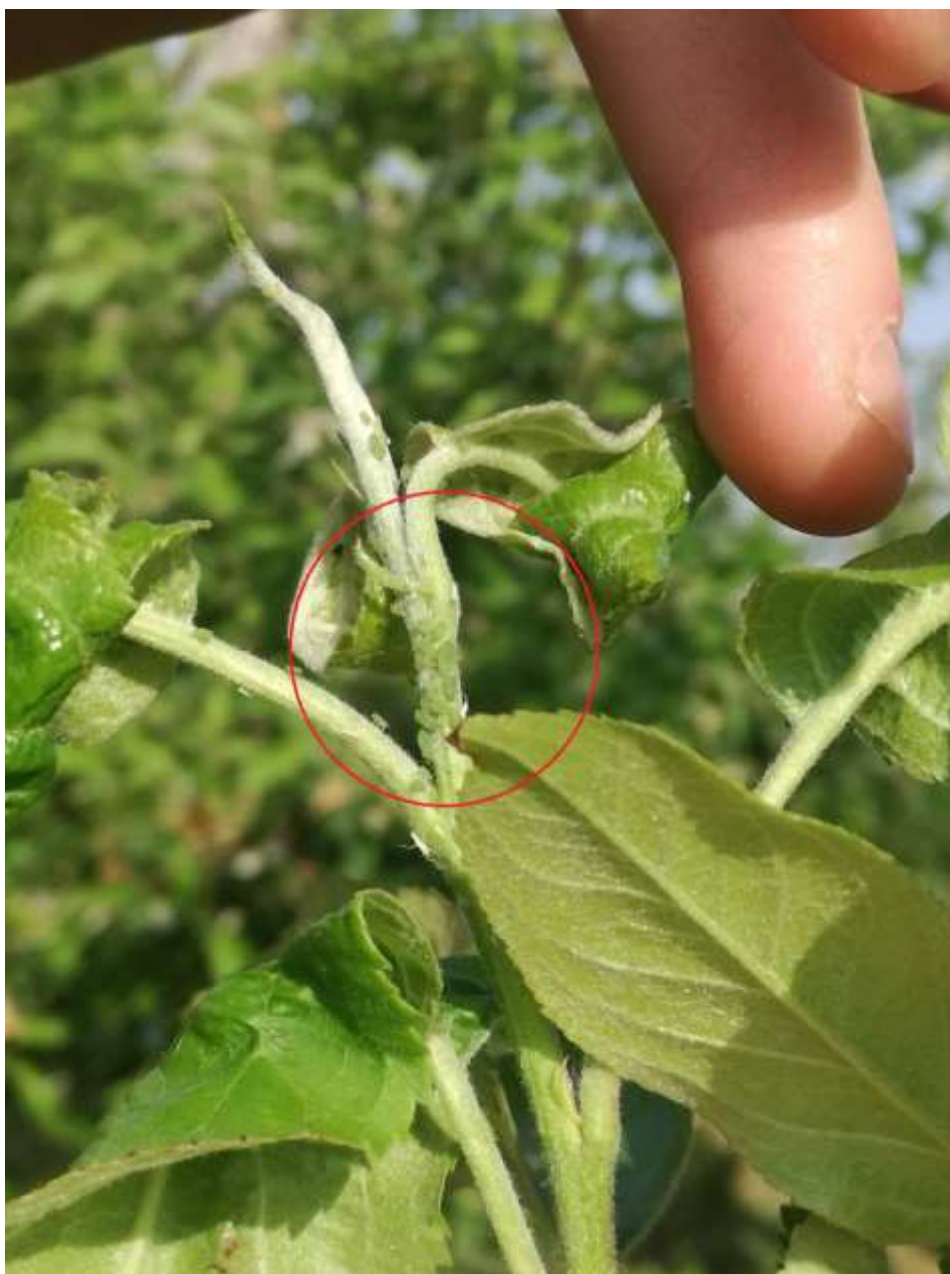
SLIKA 4. JABUKINA ZELENA LISNA VAŠ