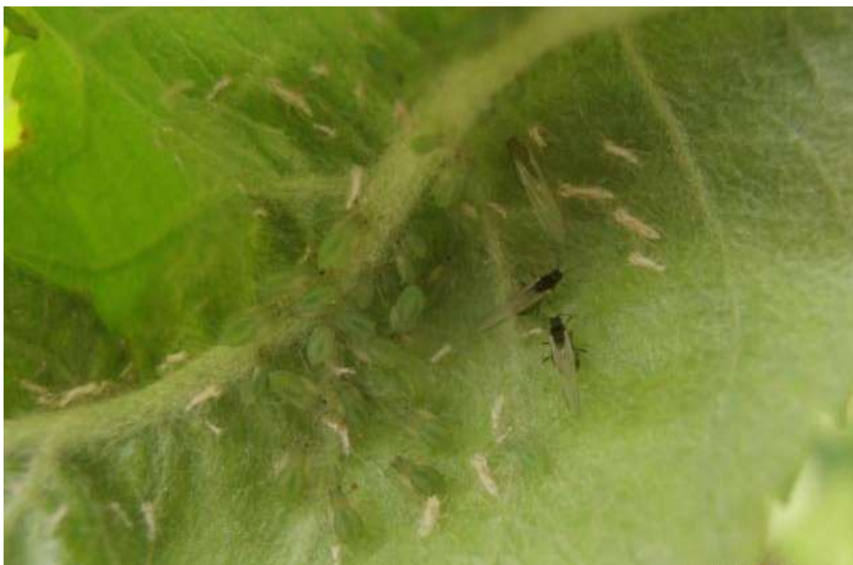
SLIKA 5. JABUKINA ZELENA LISNA VAŠ