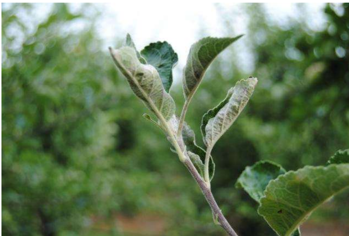
SLIKA 3. SIMPTOM PEPELNICE JABUKE