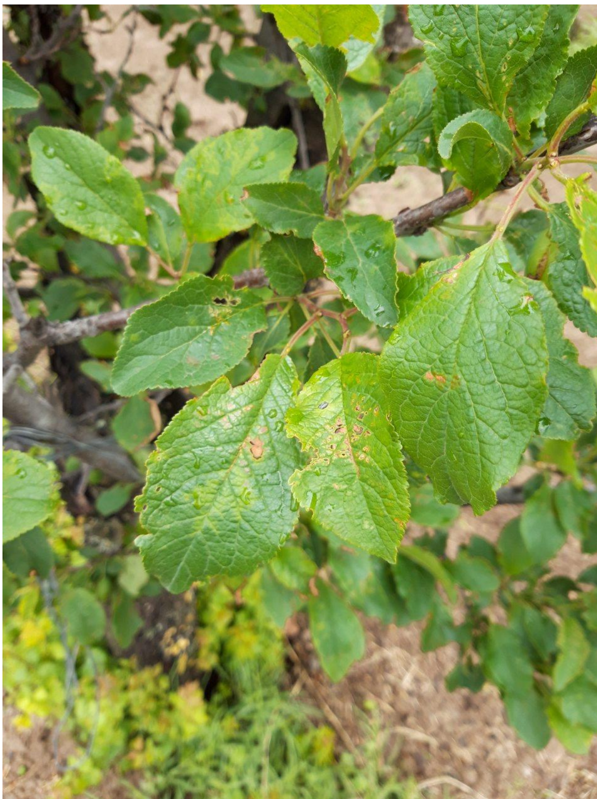
SLIKA 5. SIMPTOM ŠUPLJIKAVOSTI LIŠĆA KOŠTIČAVOG VOĆA NA LISTU ŠLJIVE

VREMENSKI USLOVI KOJI SE TRENUTNO REGISTRUJU, ČESTE PADAVINE I VISOKA VLAŽNOST VAZDUHA, VEOMA SU POVOLJNI ZA RAZVOJ PROUZROKOVAČA ŠUPLJIKAVOSTI LIŠĆA KOŠTIČAVOG VOĆA.