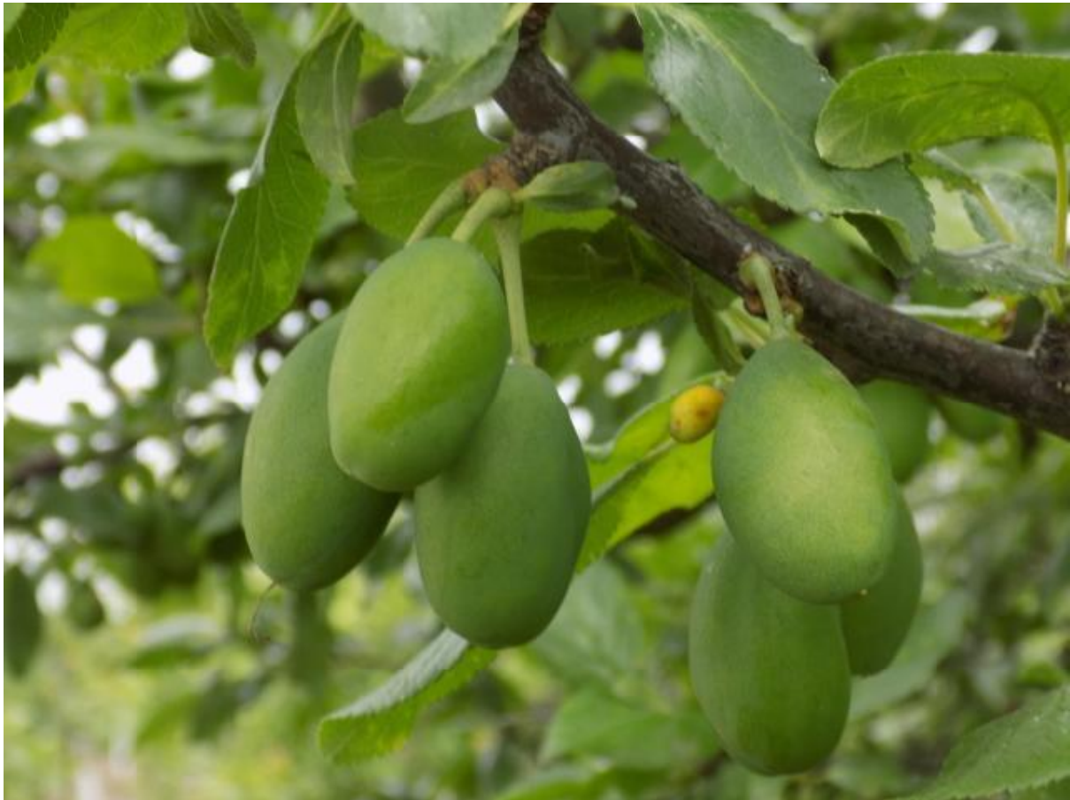
SLIKA 1. FAZA RAZVOJA ŠLJIVE

NA PODRUČJU VOJVODINE ŠLJIVE SE U ZAVISNOSTI OD SORTIMENTA NALAZE U FAZI OD PLODOVI DOSTIGLI OD 50 DO 70% KRAJNJE VELIČINE.