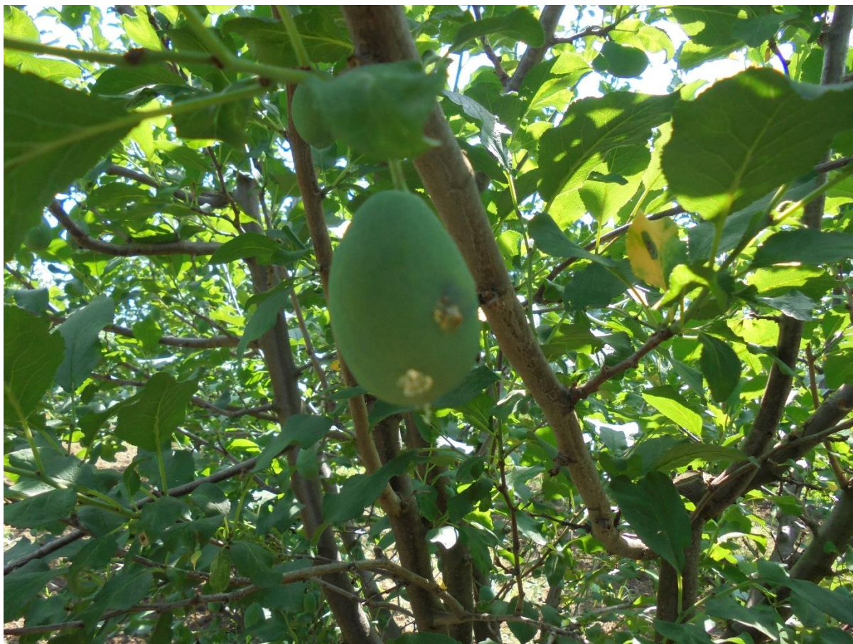
SLIKA 4. ŠTETE OD LARVE ŠLJIVINOG SMOTAVCA NA PLODU