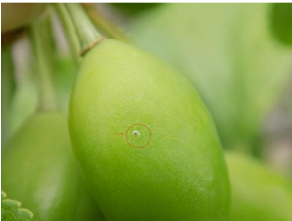
SLIKA 3. JAJE ŠLJIVINOG SMOTAVCA PRED PILJENJE