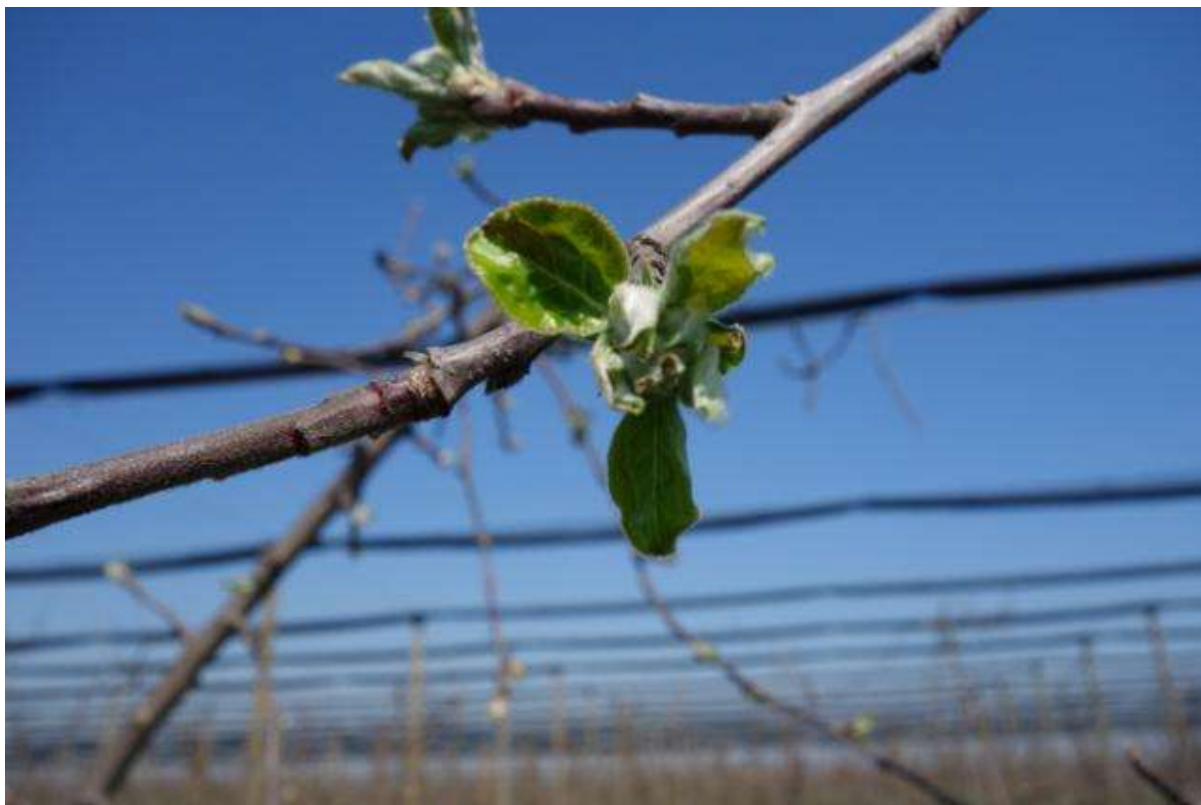
SLIKA 1. FAZA RAZVOJA JABUKE, REGION SENTA

NA PODRUČJU VOJVODINE, U ZAVISNOSTI OD LOKALITETA I SORTIMENTA, JABUKE SE NALAZE U FAZI OD MIŠJIH UŠIJU DO RAZVOJA PRVIH LISTOVA.