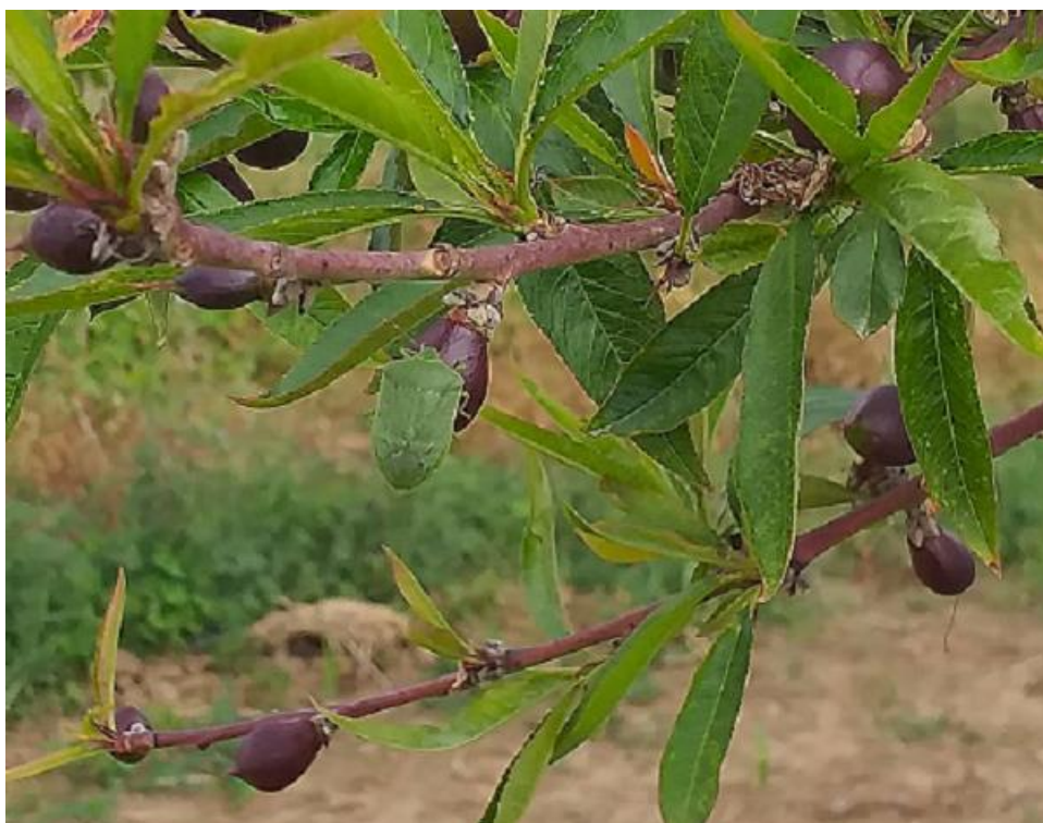
SLIKA 3. ZELENA STENICA NA NEKTARINI