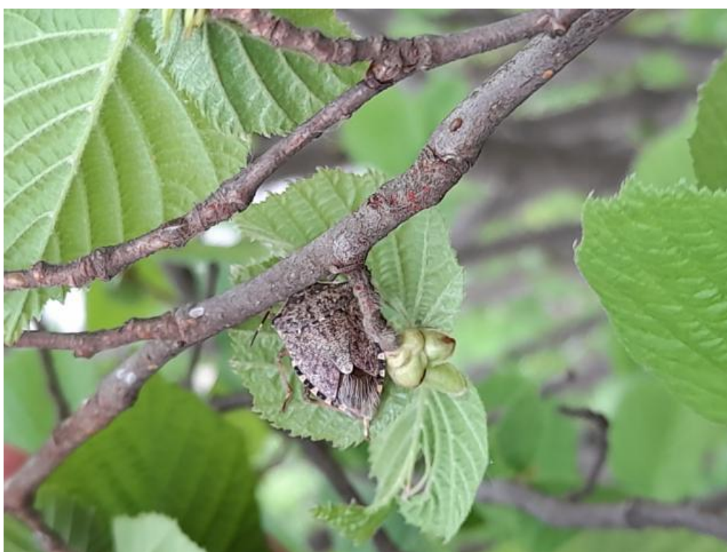
SLIKA 4. BRAON MRAMORASTA STENICA NA LESKI