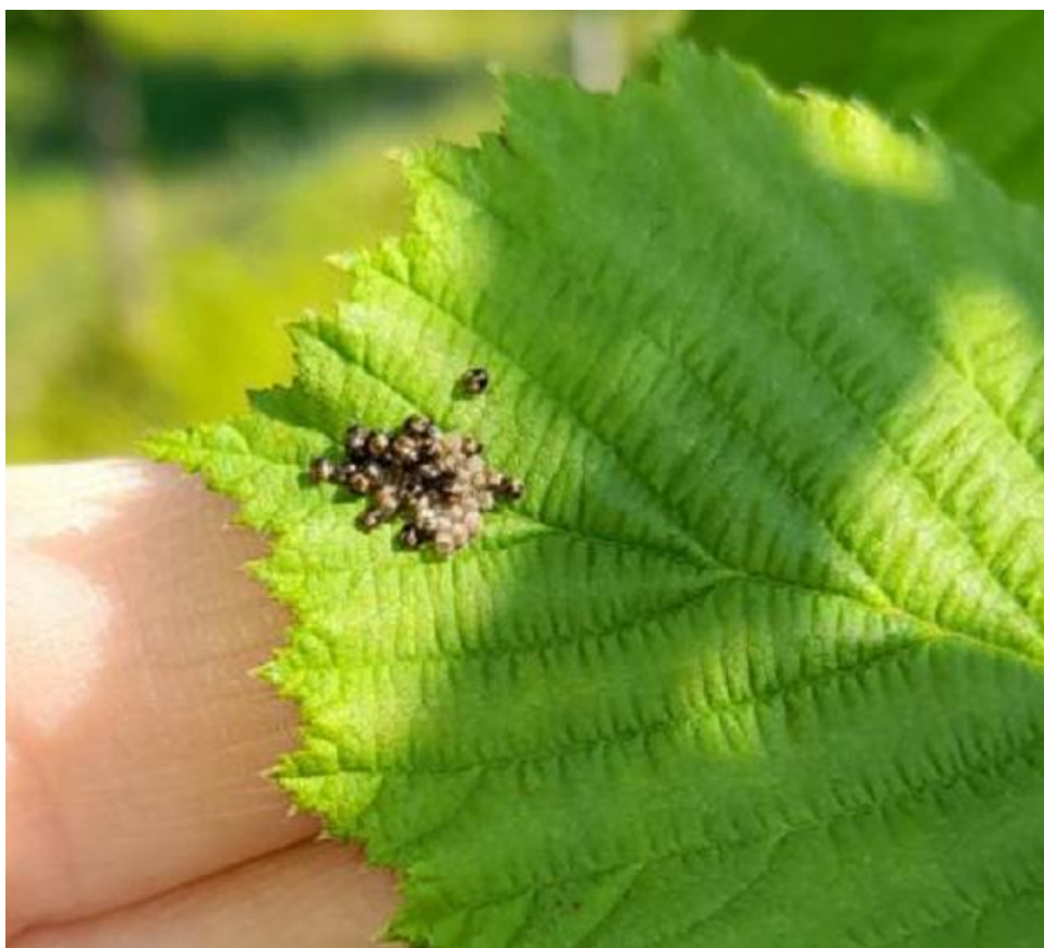
SLIKA 5. JAJNO LEGLO BRAON MRAMORASTE STENICE NA LESKI