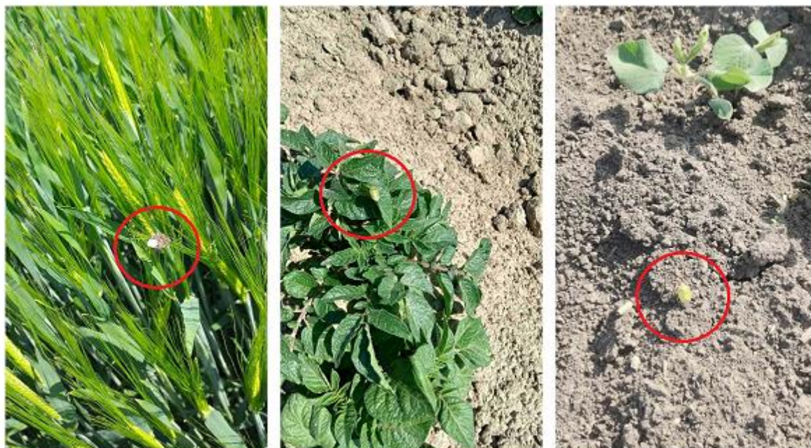
SLIKA 6. STENICE NA PŠENICI, KROMPIRU I SOJI

..... POŠTOVANI POLJOPRIVREDNI PROIZVOĐAČI I DRAGI GLEDAOCI, DETALJNIJE INFORMACIJE O POJAVI ŠTETNIH ORGANIZAMA I MERAMA KONTROLE MOŽETE POGLEDATI NA SAJTU PROGNOZNO IZVEŠTAJNE SLUŽBE ZAŠTITE BILJA VOJVODINE WWW.PISVOJVODINA.COM