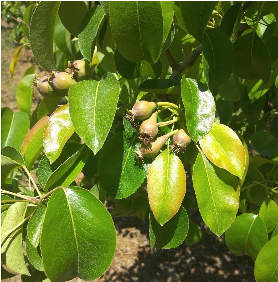
SLIKA 1: FAZA RAZVOJA KRUŠKE

NA PODRUČJU VOJVODINE KRUŠKE SE U ZAVISNOSTI OD SORTIMENTA I LOKALITETA NALAZE U RAZLIČITIM FAZAMA RAZVOJA PLODA: PLODOVI DOSTIGLI DIMENZIJE OD 10 MM DO 20 MM.