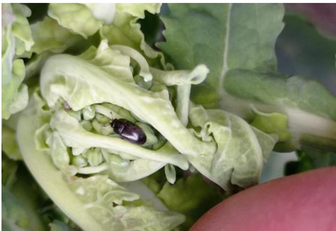
SLIKA 2. ODRASLA JEDINKA REPIČINOG SJAJNIKA NA PUPOLJCIMA