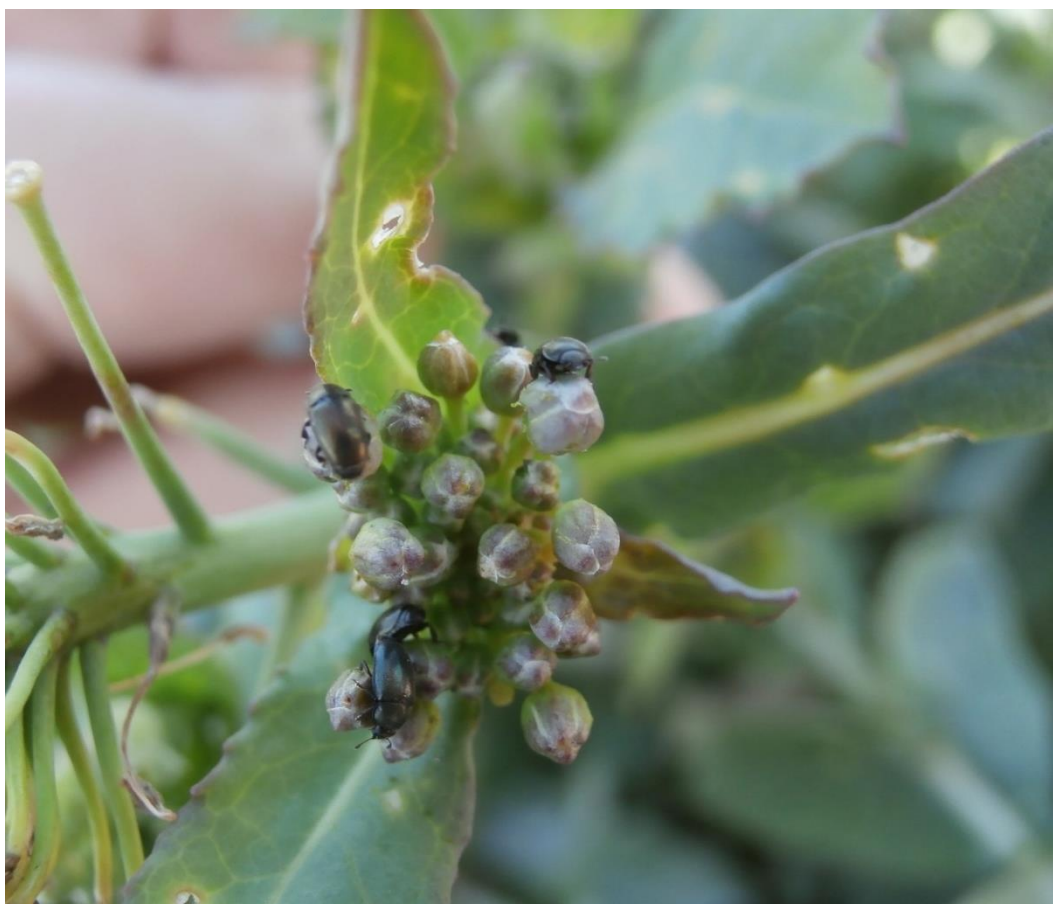
SLIKA 5. REPIČIN SJAJNIK NA PUPOLJCIMA