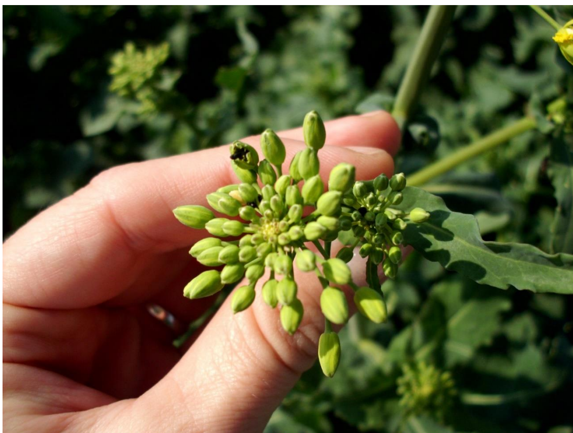
SLIKA 4. REPIČIN SJAJNIK SE HRANI NA PUPOLJCIMA