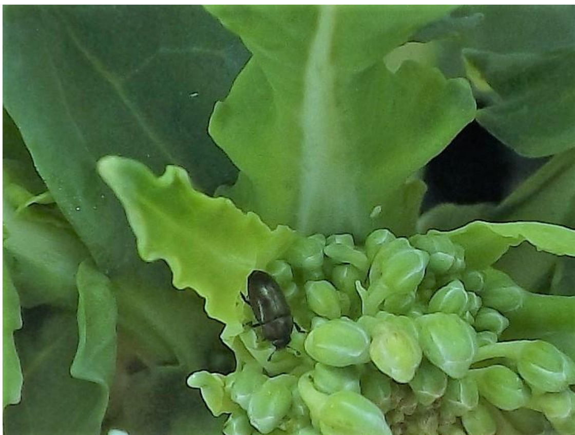
SLIKA 3. ODRASLE JEDINKA REPIČINOG SJAJNIKA NA PUPOLJCIMA