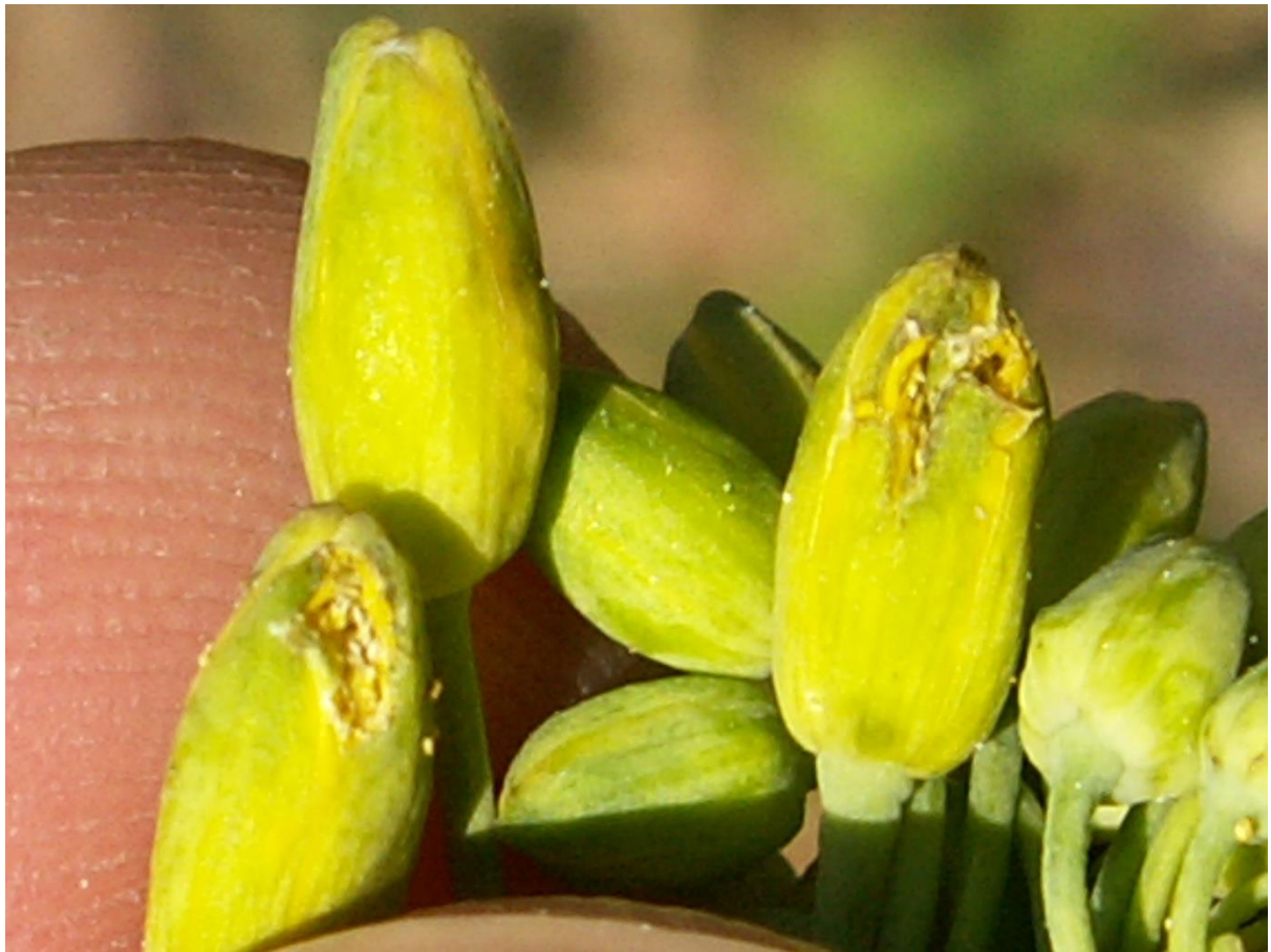
SLIKA 7. ŠTETE OD ISHRANE REPIČINOG SJAJNIKA