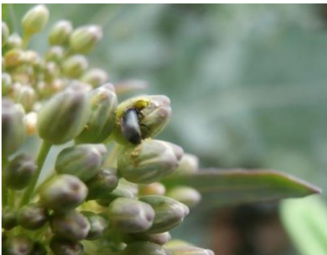
SLIKA 6. REPIČIN SJAJNIK SE HRANI U PUPOLJKU