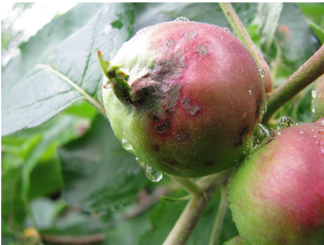
SLIKA 3. SIMPTOM ČAĐAVE PEGAVOSTI LISTA I KRSTAVOST PLODOVA JABUKE NA PLODU