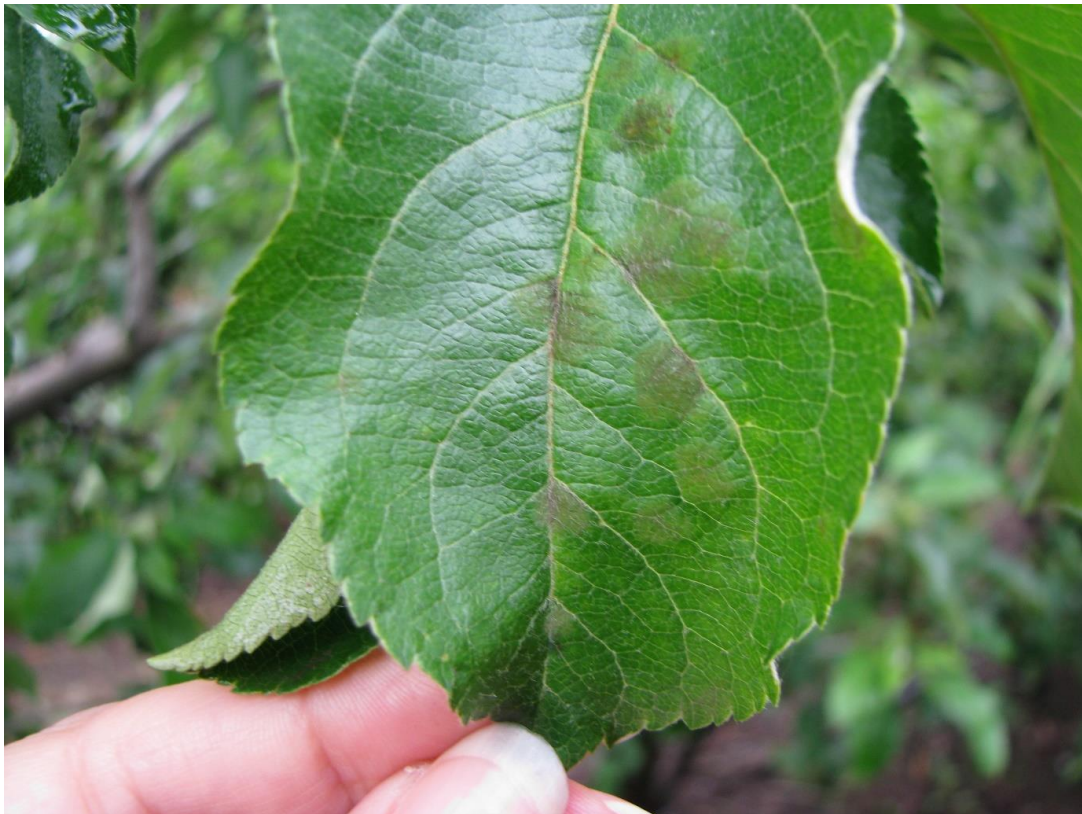
SLIKA 2. SIMPTOM ČAĐAVE PEGAVOSTI LISTA I KRSTAVOST PLODOVA JABUKE NA LISTU