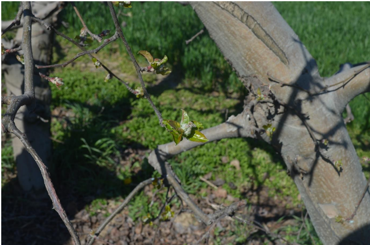
SLIKA 1. FAZA RAZVOJA JABUKE

NA PODRUČJU VOJVODINE JABUKE SE, U ZAVISNOSTI OD LOKALITETA I SORTIMENTA, NALAZE U FAZI OD „MIŠJE UŠI“ DO FAZE VIDLJIVI CVETNI PUPOLJCI JOŠ UVEK ZATVORENI.