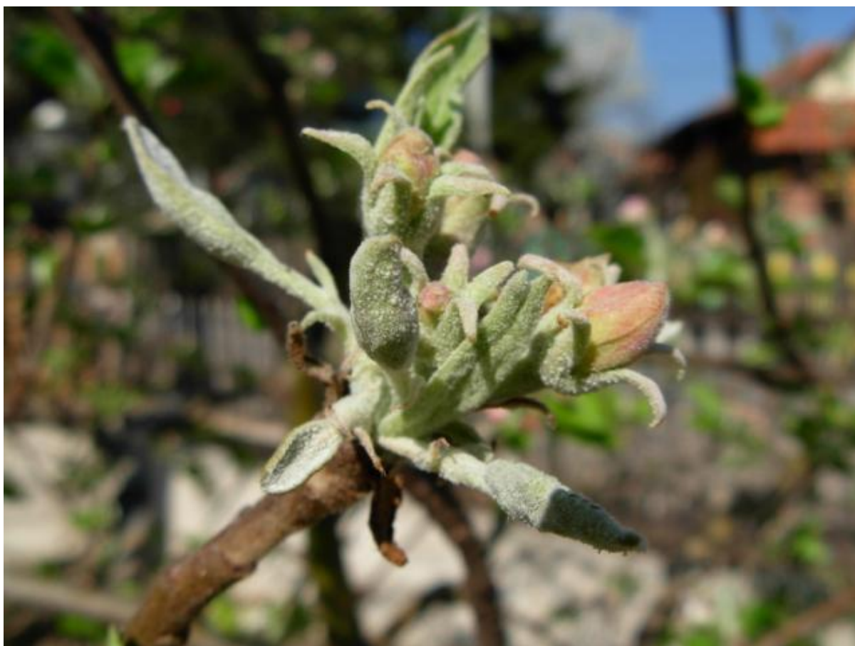
SLIKA 5. PEPELNICA JABUKE