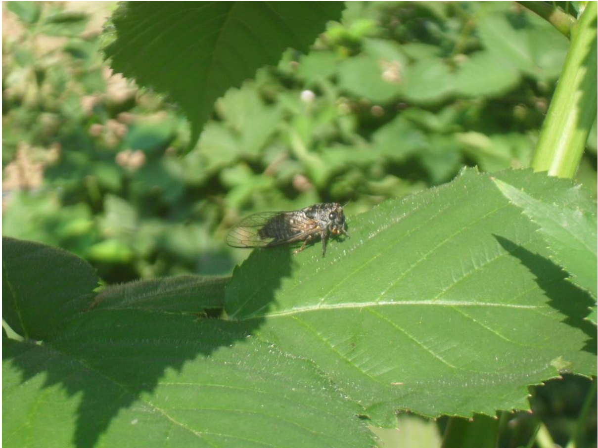
SLIKA 3 - ODRASLA JEDINKA CIKADE

CIKADE IZ OVE GRUPE IMAJU VIŠEGODIŠNJE RAZVIĆE. ODRASLI PRIMERC I ŽIVE OD 2 DO 6 NEDELJA. NAKON POJAVE VEĆ ZA NEKOLIKO DANA POČINJE PARENJE I POLAGANJE JAJA U BILJNO TKIVO GRANČICA MALINE I KUPINE. U ZAREZIMA KOJE ODRASLA CIKADA PRAVI POLAŽU SE JAJA IZDUŽENOG OBLIKA, NASLAGANA JEDNO NA DRUGO.