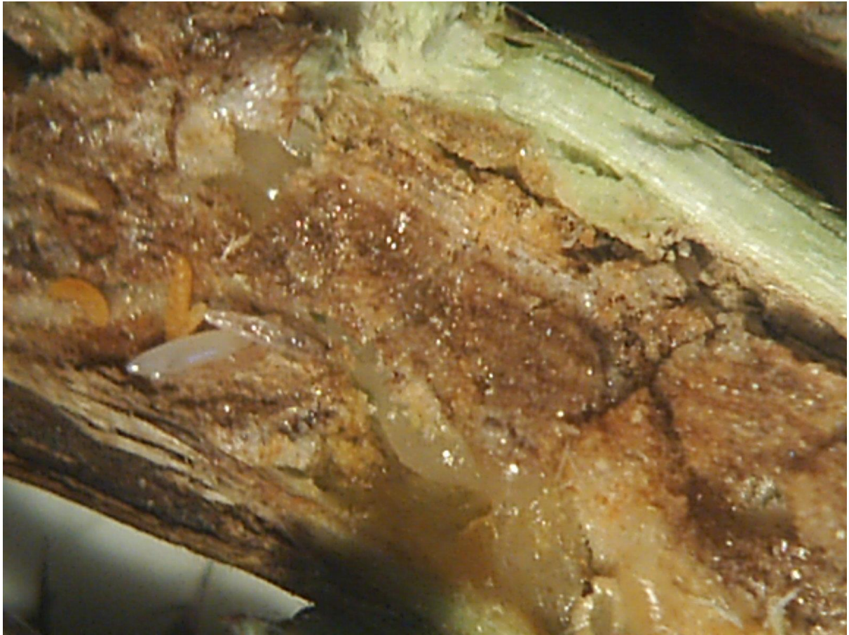
SLIKA 6 - TEK ISPILJENE LARVE CIKADA