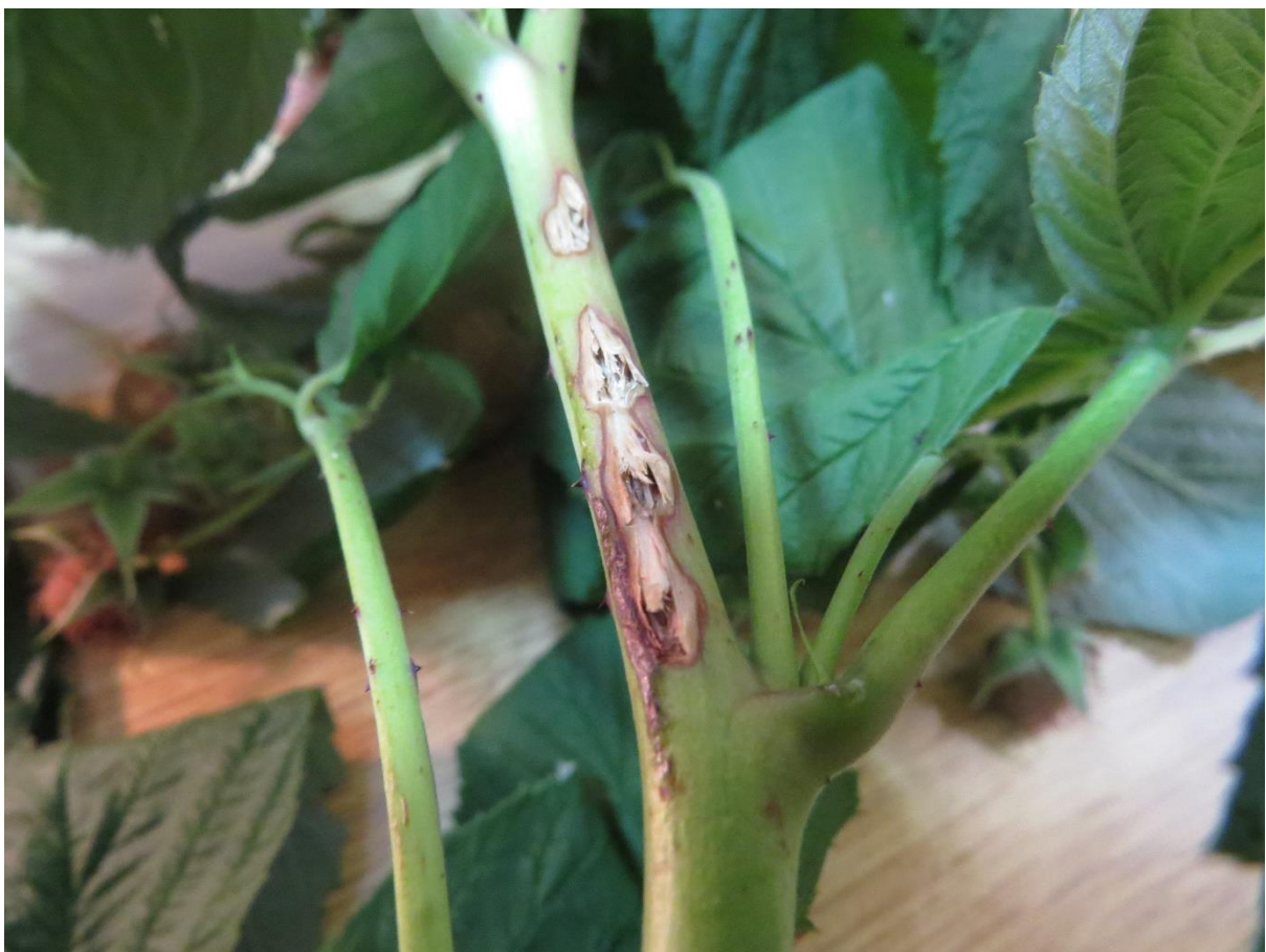
SLIKA 1 - OŠTEĆENJA NA GRANI

NA PODRUČJU ZAPADNE SRBIJE U ZASADIMA KUPINE I MALINE, KAO I NA PODRUČJU VOJVODINE U ZASADIMA MALINA REGISTRUJU SE SPECIFIČNA OŠTEĆENJA NA GRANČICAMA BILJAKA. OŠTEĆENJA SU U VIDU POKIDANE POVRŠINE ODNOSNO KORE GRANČICA, U VIDU ZAREZA. NA JEDNOJ GRANČICI MOŽE SE REGISTROVATI I VIŠE ZAREZA. NA ZAREZIMA KOJI SU VIDLJIVI NA GRANČICAMA DOLAZI DO NJIHOVOG LOMLJENJA I SUŠENJA GRANE.