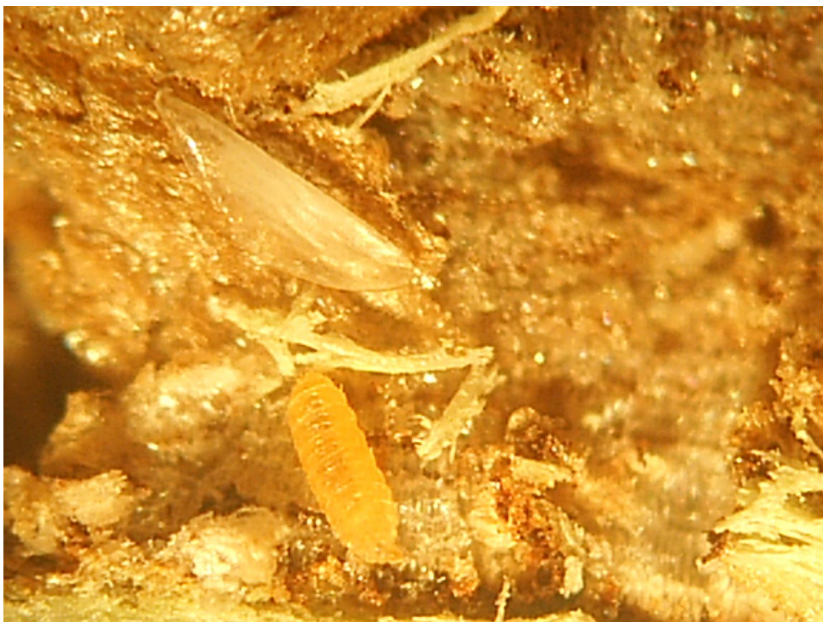
SLIKA 7 - LARVA CIKADE