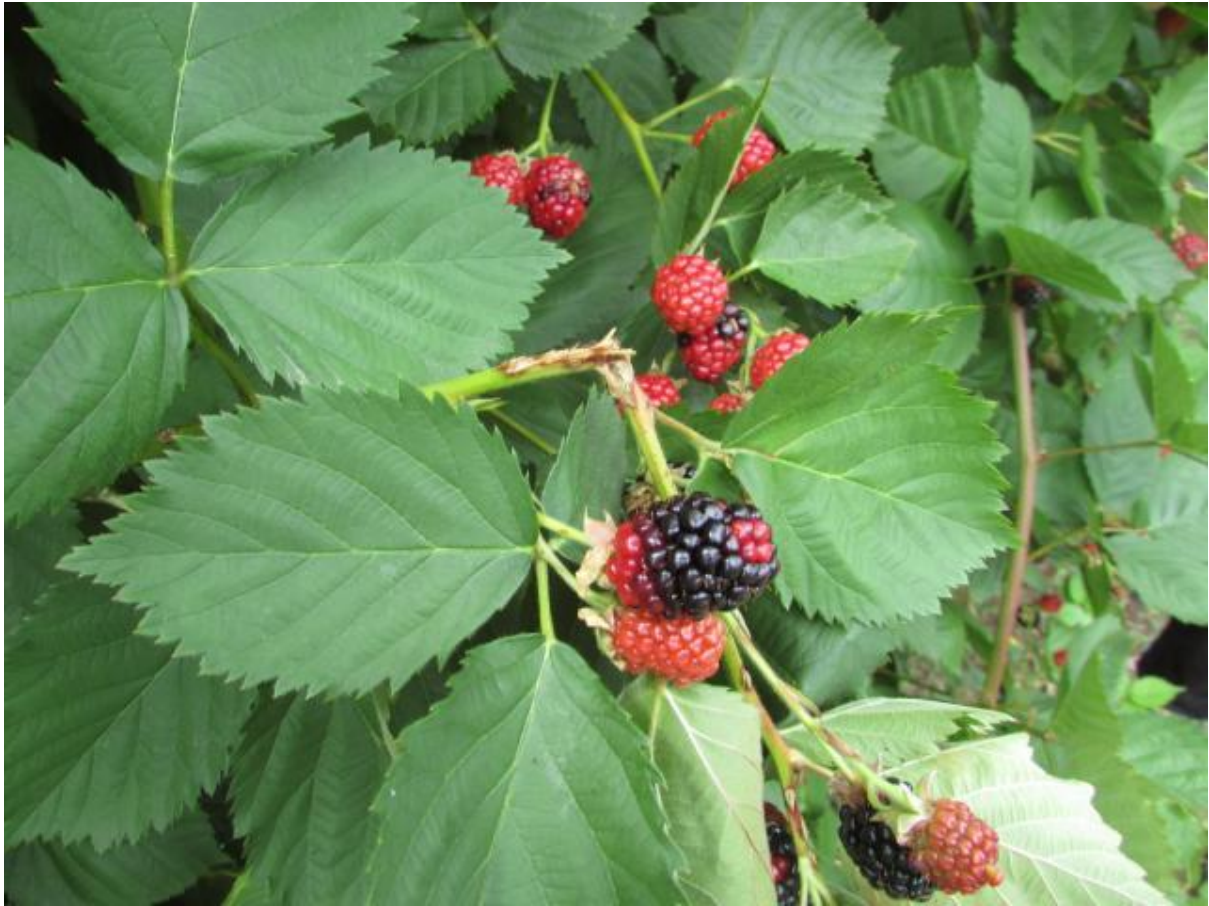
SLIKA 2 - OŠTEĆENJA NA GRANI I PUCANJE GRANE

MONITORINGOM ZASADA DETEKTOVANO JE PRISUSTVO CIKADE ( CICADETTA MONTANA ). U OKVIRU OVE GRUPE DETEKTOVANO JE VIŠE RAZLIČITIH CIKADA, ALI SVE PRIPADAJU GRUPI CICADETTA MONTANA ( CICADETTA MONTANA COMPLEX ).