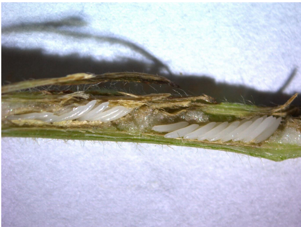
SLIKA 4 - SVEŽE POLOŽENA JAJA

RAZVOJ POLOŽENIH JAJA TRAJE VEOMA DUGO, ČAK I DO NEKOLIKO MESECI.