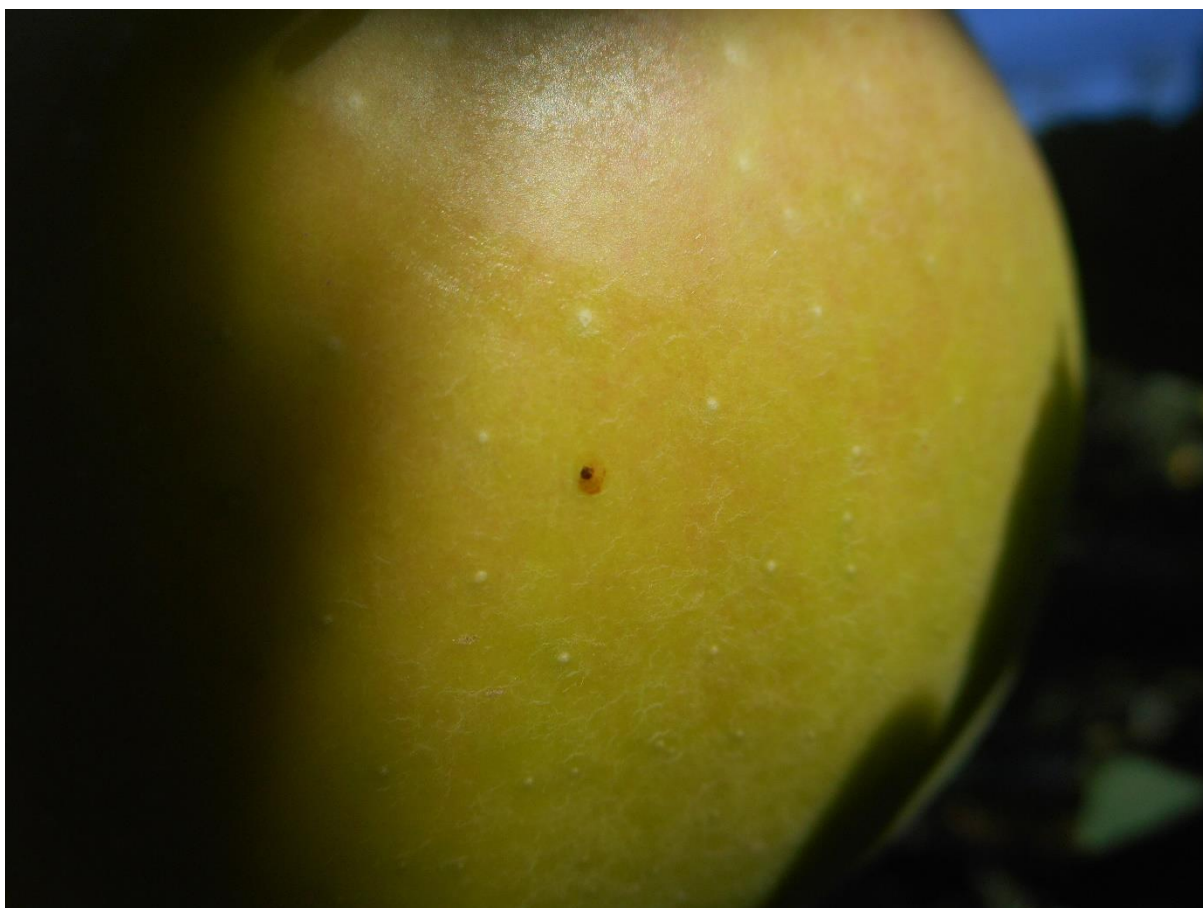
SLIKA2-JAJE JABUKINOG SMOTAVCA PRED PILJENJE