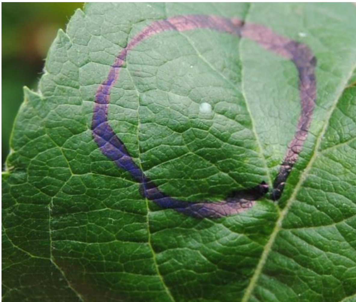
SLIKA1-SVEŽE POLOŽENO JAJE JABUKINOG SMOTAVCA

U ZASADIMA JABUKA U TOKU JE LET LEPTIRA TREĆE GENERACIJE JABUKINOG SMOTAVCA. TRENUTNO SE U JABUČNJACIMA MOGU REGISTROVATI JAJA RAZLIČITIH STADIJUMA RAZVOJA KAO I TEK ISPILJENE LARVE TREĆE GENERACIJE. U ZAVISNOSTI OD REGIONA, PROCENAT ISPILJENIH LARVI TREĆE GENERACIJE KREĆE SE OD 5 DO 50%.