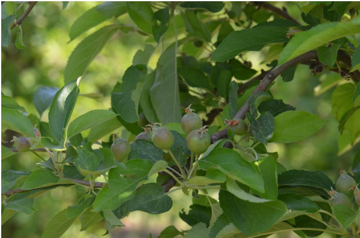
SLIKA 1. FAZA RAZVOJA JABUKA

NA PODRUČJU VOJVODINE ZASADI JABUKA SE NALAZE U FAZI RAZVOJA PLODOVA, PLODOVI DOSTIGLI DIMENZIJE OD 20 DO 30 MM (BBCH 72-73).