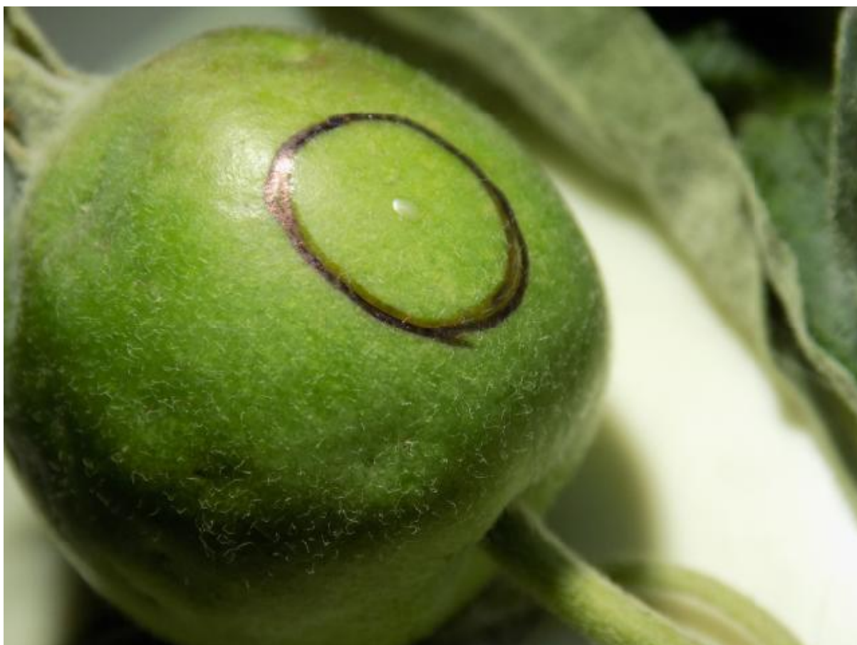
SLIKA 3. SVEŽE BELO JAJE JABUKINOG SMOTAVCA NA PLODU JABUKE

NA PODRUČJU VOJVODINE, TRENUTNO JE U TOKU PILJENJE LARVI PRVE GENERACIJE JABUKINOG SMOTAVACA.