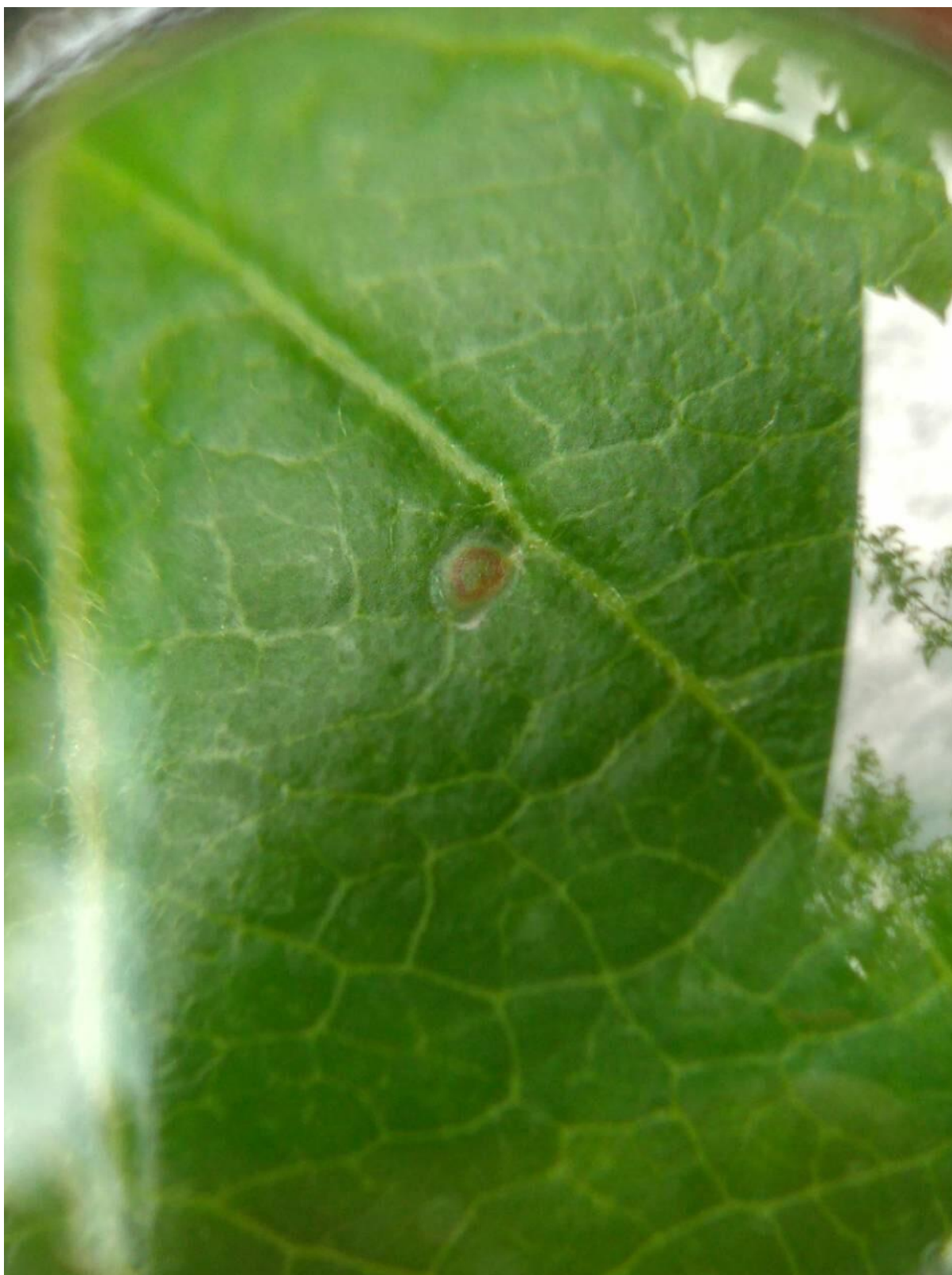
SLIKA 4. JAJE JABUKINOG SMOTAVCA SA CRVENIM OREOLOM NA LISTU JABUKE U CILJU SPREČAVANJA UBUŠIVANJA LARVI U PLODOVE, PREPORUČUJE SE PRIMENA NEKOG OD INSEKTICIDA OVICIDNO-LARVICIDNOG DELOVANJA: