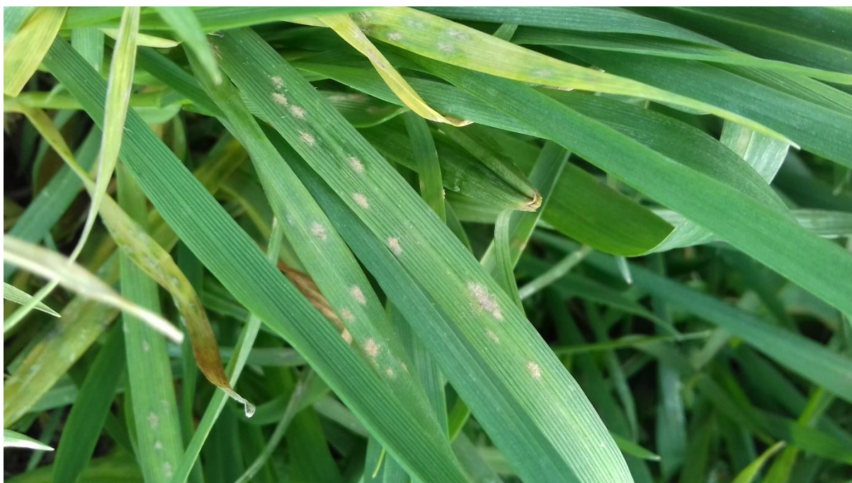
SLIKA 2. SIMPTOM PEPELNICE ŽITA