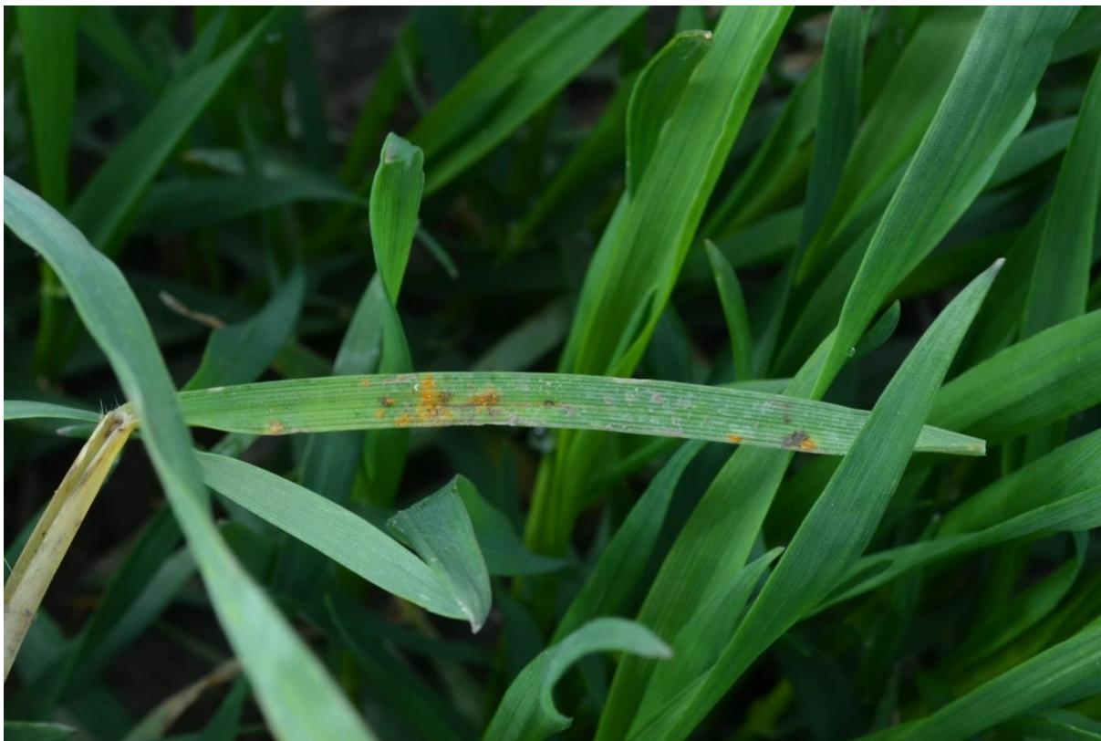
SLIKA 1. SIMPTOM LISNE RĐE