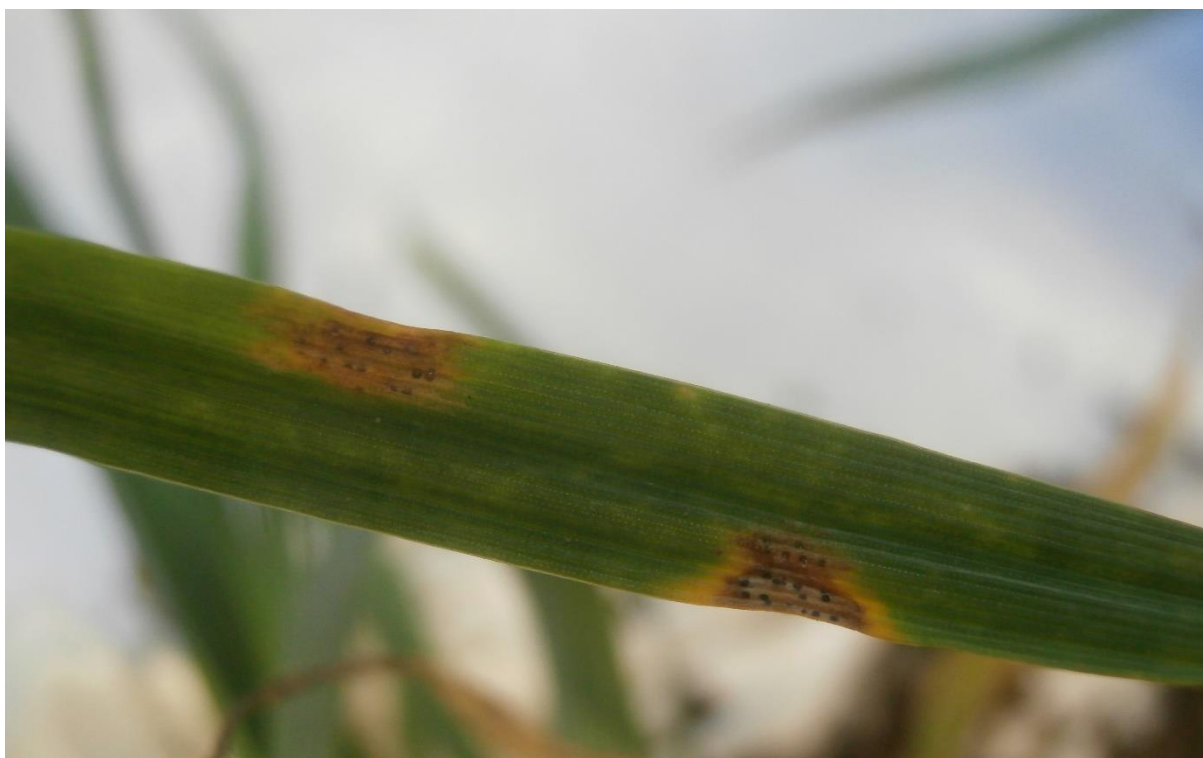
SLIKA 3. SIMPTOM SIVE PEGAVOSTI LISTA PŠENICE