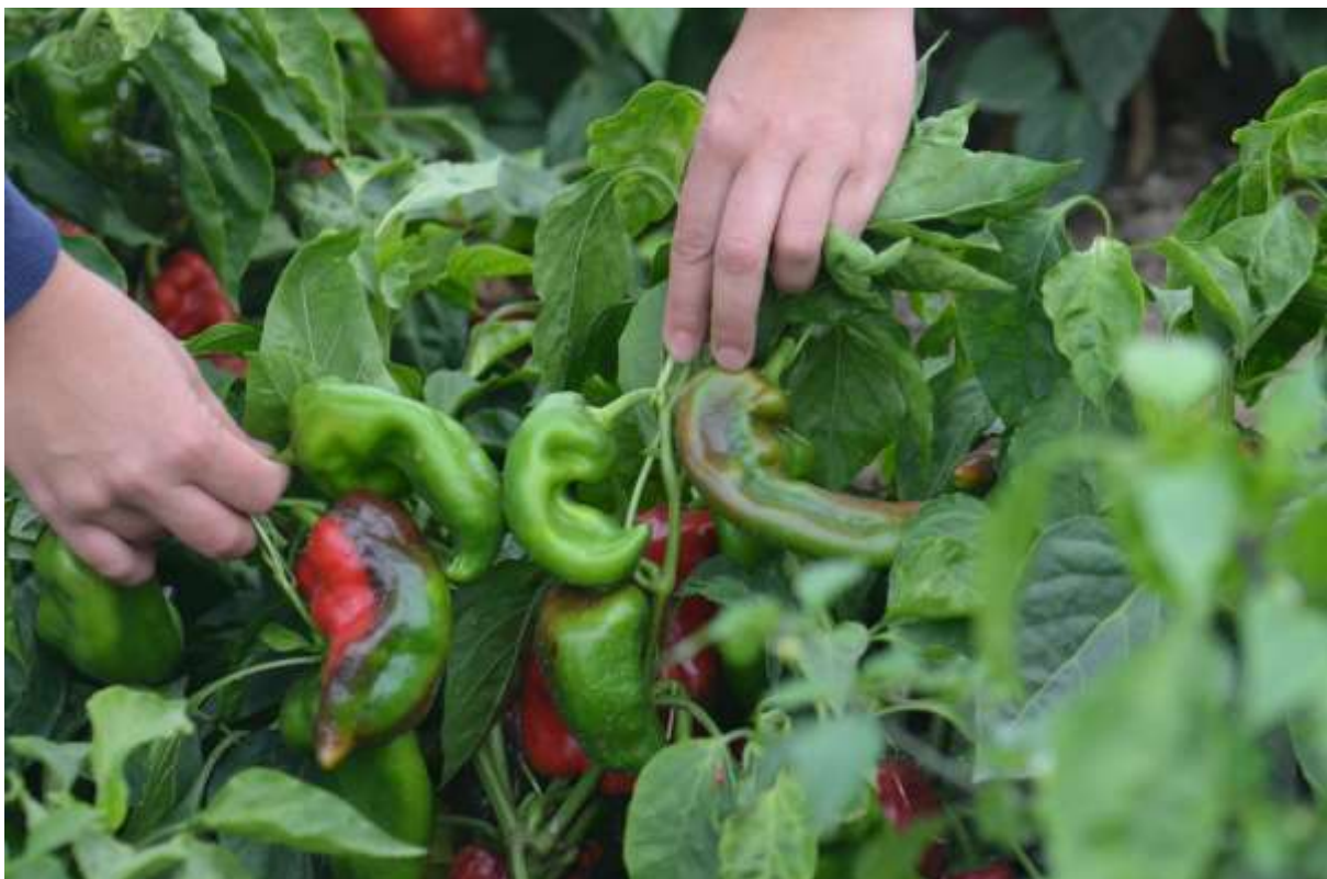
SLIKA 6. DEFORMISANI PLODOVI PAPRIKE