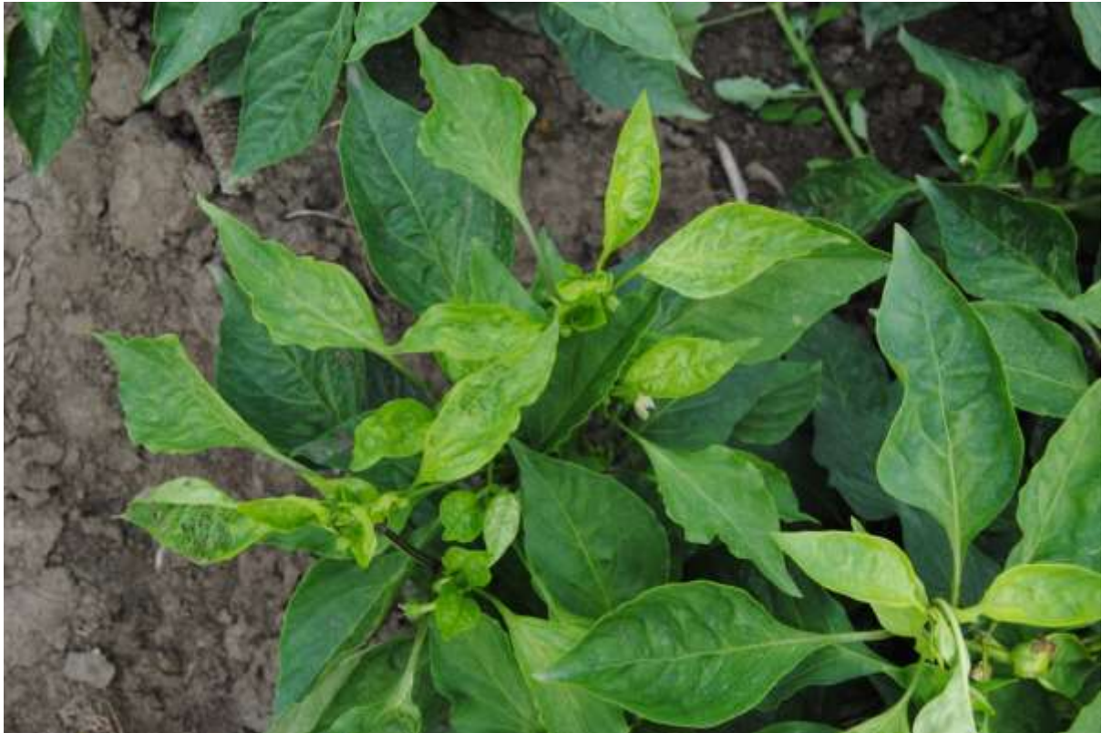
SLIKA 3. SUŽENJE LISKI