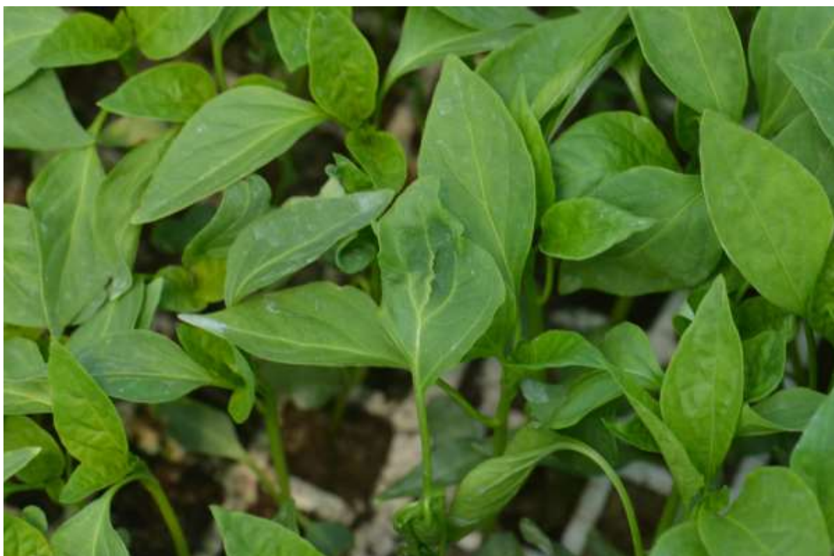
SLIKA 8. SIMPTOMI VIRUSA MOZAIKA KRASTAVCA NA BILJKAMA