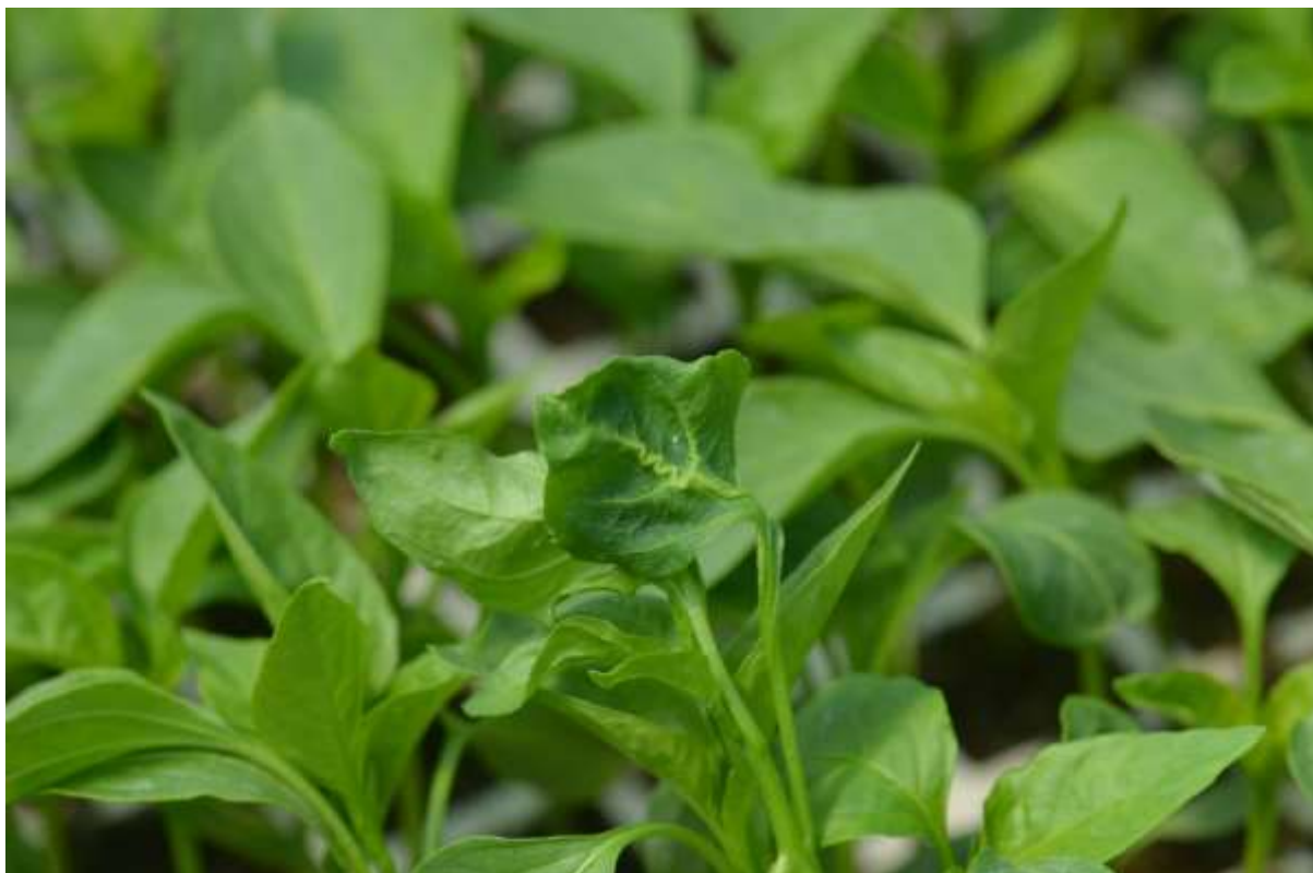
SLIKA 7. SIMPTOMI VIRUSA MOZAIKA KRSTAVCA NA BILJKAMA PAPRIKE

NA BILJKAMA PAPRIKE U PROIZVODNJI RASADA REGISTRUJE SE PRISUSTVO SIMPTOMA VIRUSA MOZAIKA KRSTAVCA. NA PRVIM PRAVIM LISTOVIMA GLAVNI NERV JE NACIGOVAN I TAKVI LISTOVI SU ZGUŽVANI.