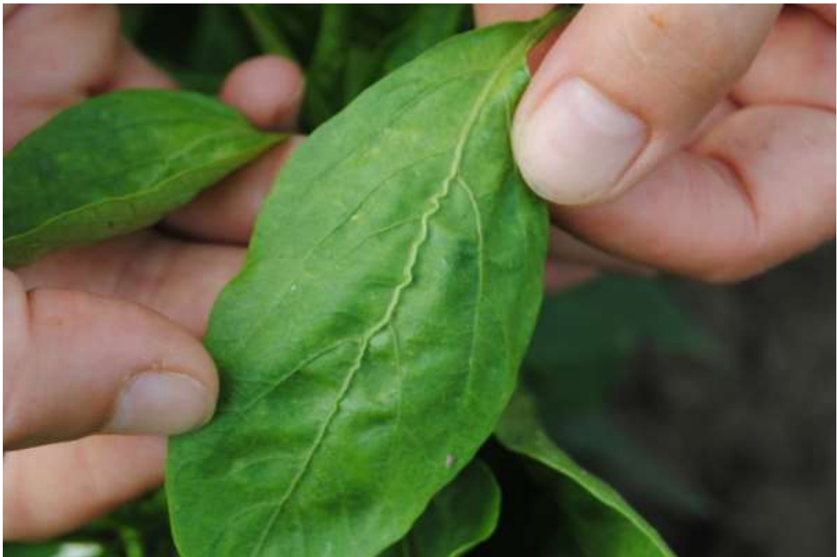
SLIKA 4. NACIGOVAN CENTRALNI NERV

USLED DELOVANJA VIRUSA DOLAZI I DO PROMENA NA CVETU. NA NEKIM BILJKAMA DOLAZI DO STERILNOSTI ILI DELIMIČNE STERILNOSTI, DOK SE NA NEKIM BILJKAMA OBRAZUJU PLODOVI DEFORMISANOG IZGLEDA, ZAKRŽLJALI I SA NEKROZAMA POVRŠINSKOG TKIVA.