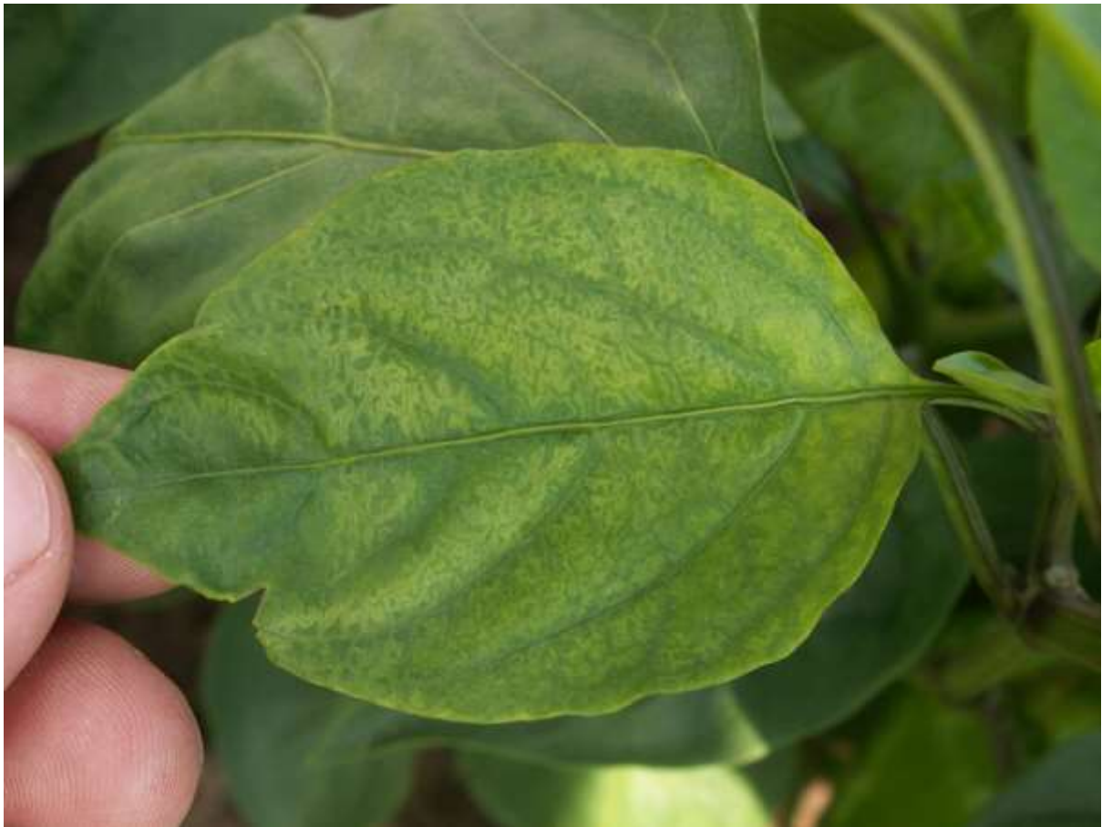
SLIKA 2. HLOROTIČNI MOZAIK NA LISKI PAPRIKE

NA LISTOVIMA BILJAKA MOGLI SU SE UOČITI SIMPTOMI HLOROTIČNOG MOZAIKA I ŽUTO ZELENIH PEGA NEPRAVILNOG OBLIKA, ZATIM SUŽENE I SITNE LISKE I CIGOVANJE GLAVNOG NERVA.