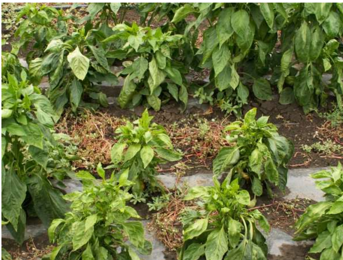
SLIKA 1. ŽBUNAST IZGLED BILJAKA ZARAŽENIH VIRUSOM

NA RANO ZARAŽENIM BILJKAMA PAPRIKE REGISTROVANE SU TEŠKE PATOLOŠKE PROMENE KADA DOLAZI DO SKRAĆIVANJA GRANČICA I CELA BILJKA DOBIJA ŽBUNAST IZGLED.