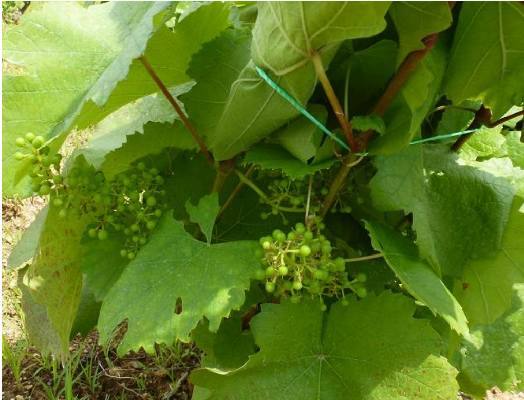
SLIKA 1. FAZA RAZVOJA VINOVE LOZE