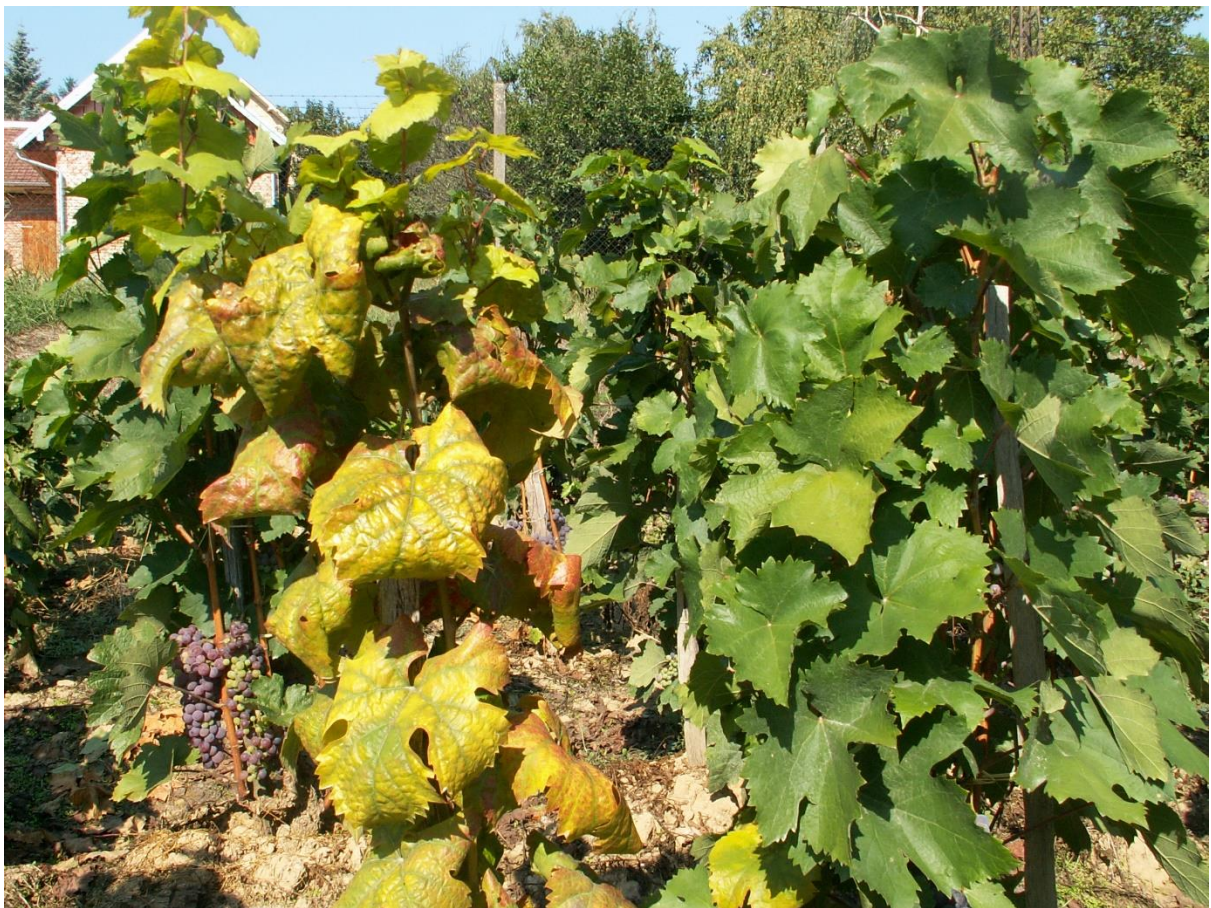
SLIKA 4. SIMPTOM ZLATASTOG ŽUTILA VINOVE LOZE