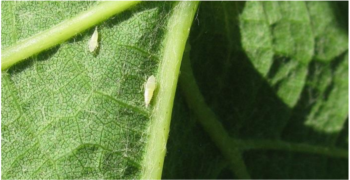
SLIKA 3. LARVE CIKADE Scaphoideus titanus DRUGOG I TREĆEG RAZVOJNOG SUPNJA NA NALIČJU LISTA VINOVE LOZE