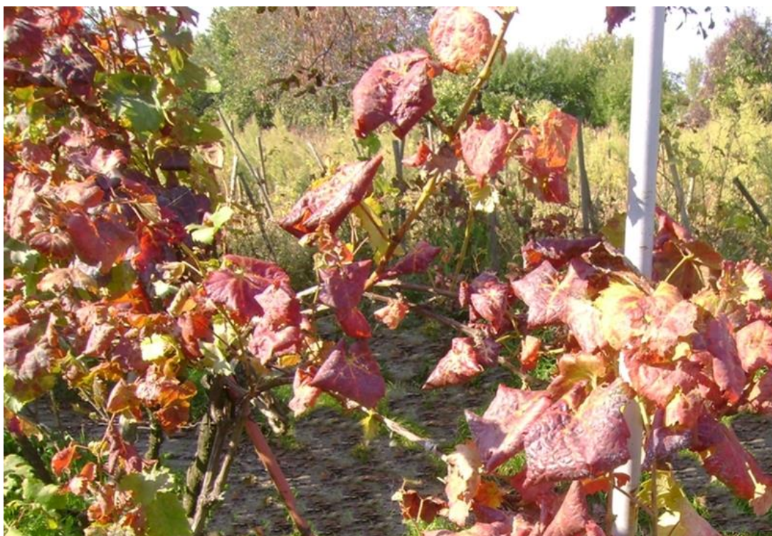
SLIKA 5. SIMPTOM ZLATASTOG ŽUTILA VONOVE LOZE

..... POŠTOVANI POLJOPRIVREDNI PROIZVOĐAČI I DRAGI GLEDAOCI, DETALJNIJE INFORMACIJE O POJAVI ŠTETNIH ORGANIZAMA I MERAMA KONTROLE MOŽETE POGLEDATI NA SAJTU PROGNOZNO IZVEŠTAJNE SLUŽBE ZAŠTITE BILJA VOJVODINE WWW.PISVOJVODINA.COM