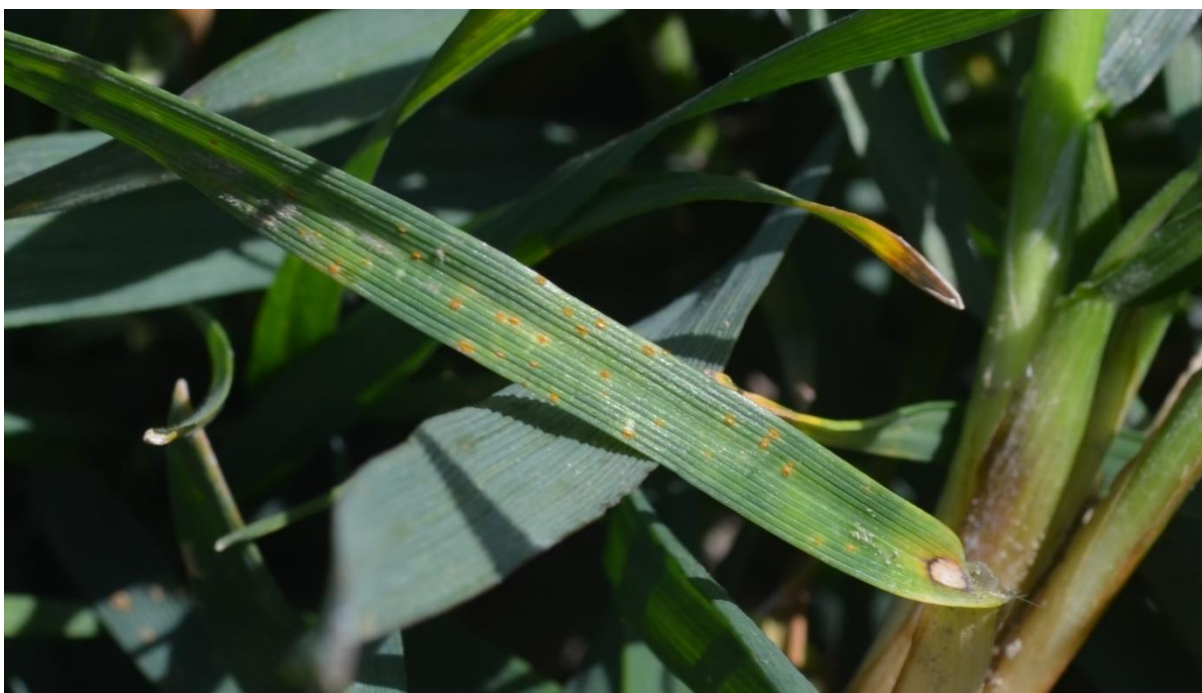
SLIKA 5. SIMPTOM LISNE RDE