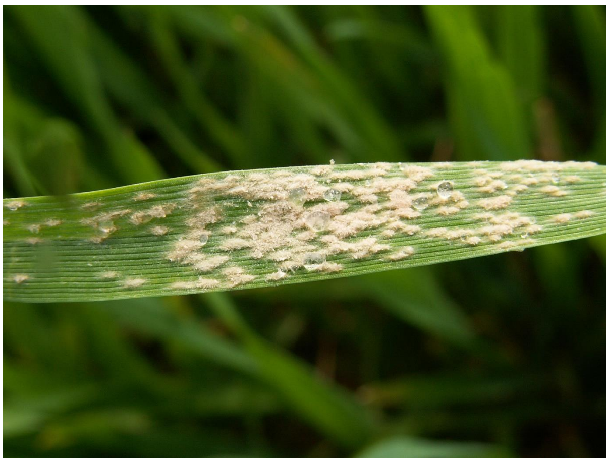
SLIKA 6. SIMPTOM PEPELNICE ŽITA

VIZUELNIM PREGLEDOM BILJAKA PRE OVOG ZAHLAĐENJA PRAĆENOG KIŠOM, REGISTROVANO JE PRISUSTVO SIMPTOMA BOLESTI NA GOTOVO SVIM USEVIMA PŠENICE, A INTENZITET PRISUSTVA SIMPTOMA ZAVISI OD REGIONA, SORTIMENTA, FAZE RAZVOJA PŠENICE, GUSTINE USEVA I DRUGIH FAKTORA. PRISUTNA VISOKA VLAŽNOST I POVEĆANJE TEMPERATURA KOJE SE NAJAVLJUJE ZA NAREDNI PERIOD POVOLJNO ĆE UTICATI NA RAZVOJ I ŠIRENJE BOLESTI PŠENICE.