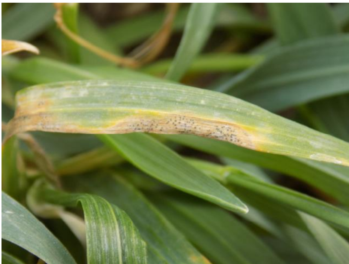
SLIKA 2. SIMPTOM SIVE PEGAVOSTI LISTA PŠENICE