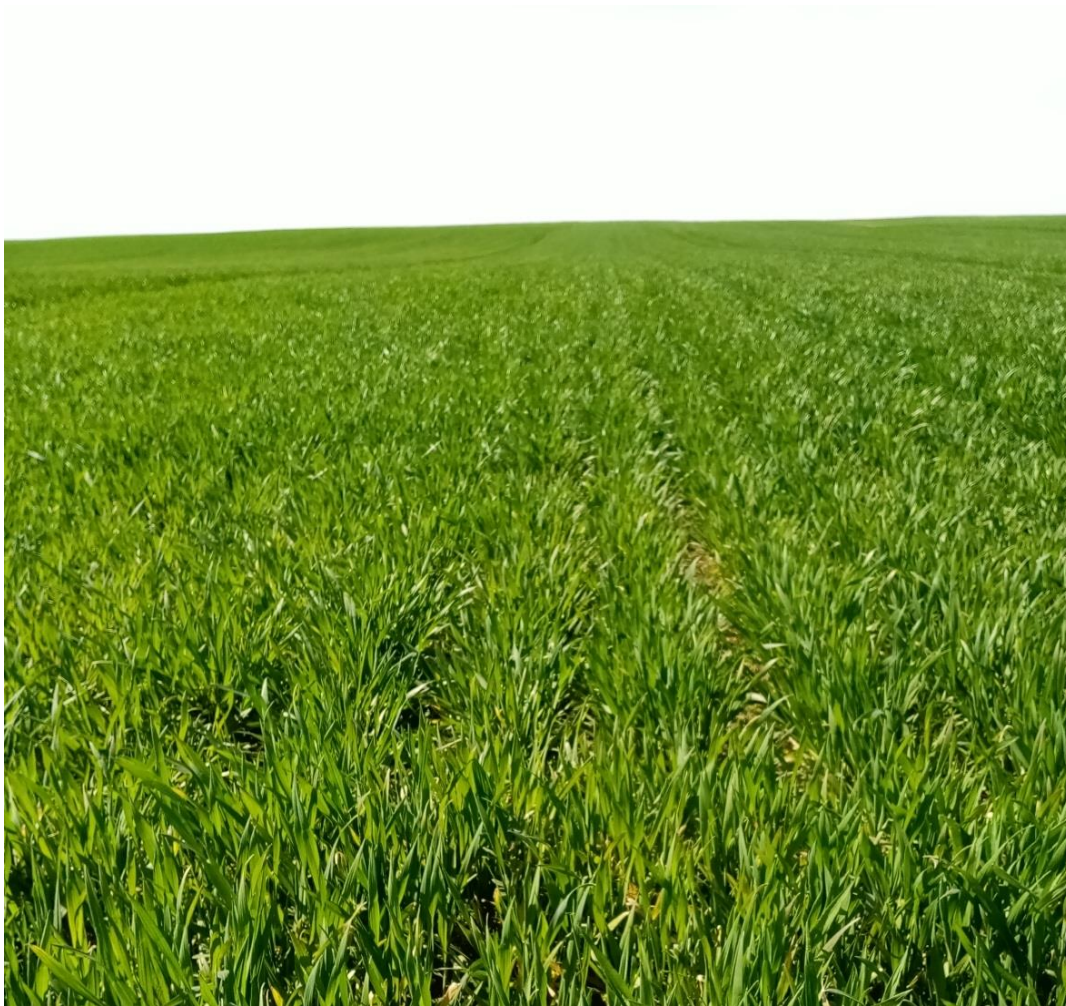
SLIKA 1. USEV PŠENICE

NA PODRUČJU VOJVODINE, NAJVEĆI BROJ PARCELA POD PŠENICOM NALAZI SE U FAZI VLATANJA, FORMIRANO DRUGO KOLENCE.