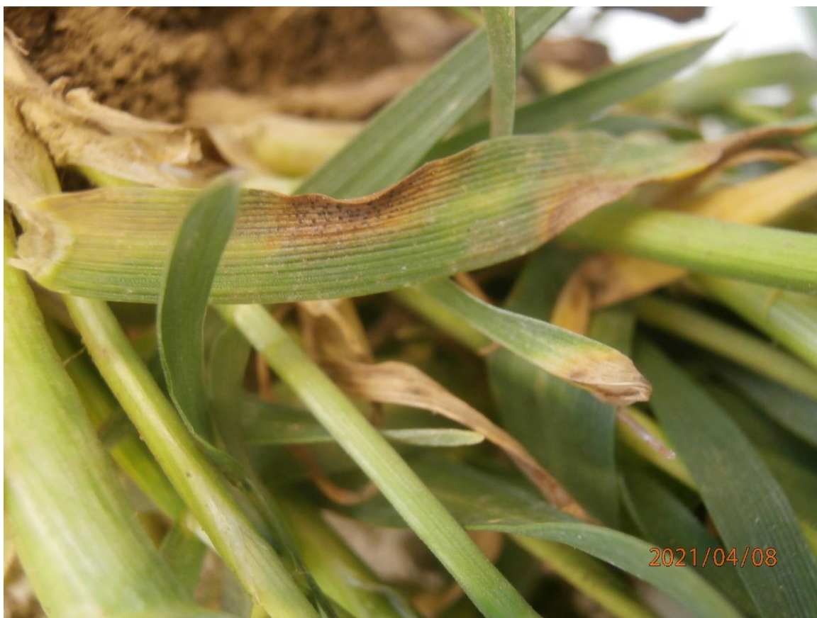
SLIKA 3. SIMPTOM SIVE PEGAVOSTI LISTA PŠENICE