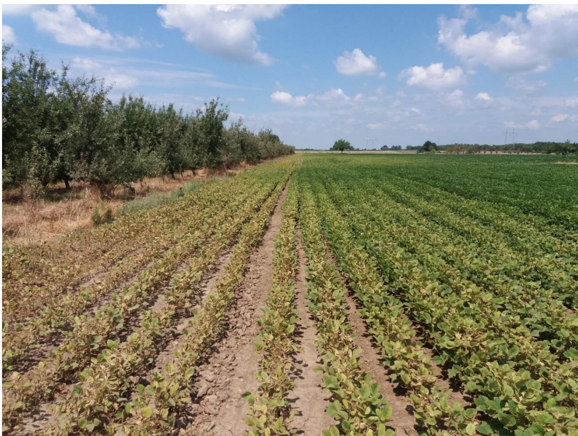
SLIKA 2. USEV SOJE NAPADNUT GRINJAMA (PRETHODNE VEGETACIJE)