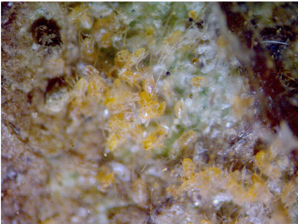
SLIKA 6. OBIČNI PAUČINAR NA NALIČJU LISTA

..... POŠTOVANI POLJOPRIVREDNI PROIZVOĐAČI I DRAGI GLEDAOCI, DETALJNIJE INFORMACIJE O POJAVI ŠTETNIH ORGANIZAMA I MERAMA KONTROLE MOŽETE POGLEDATI NA SAJTU PROGNOZNO IZVEŠTAJNE SLUŽBE ZAŠTITE BILJA VOJVODINE WWW.PISVOJVODINA.COM