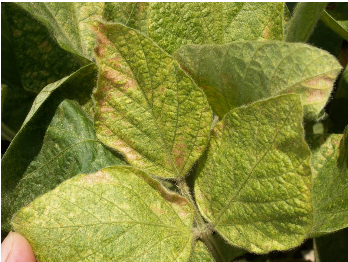
SLIKA 4. SIMPTOMI OŠTEĆENJA OD OBIČNOG PAUČINARA NA LISTOVIMA SOJE (PRETHODNE VEGETACIJE)