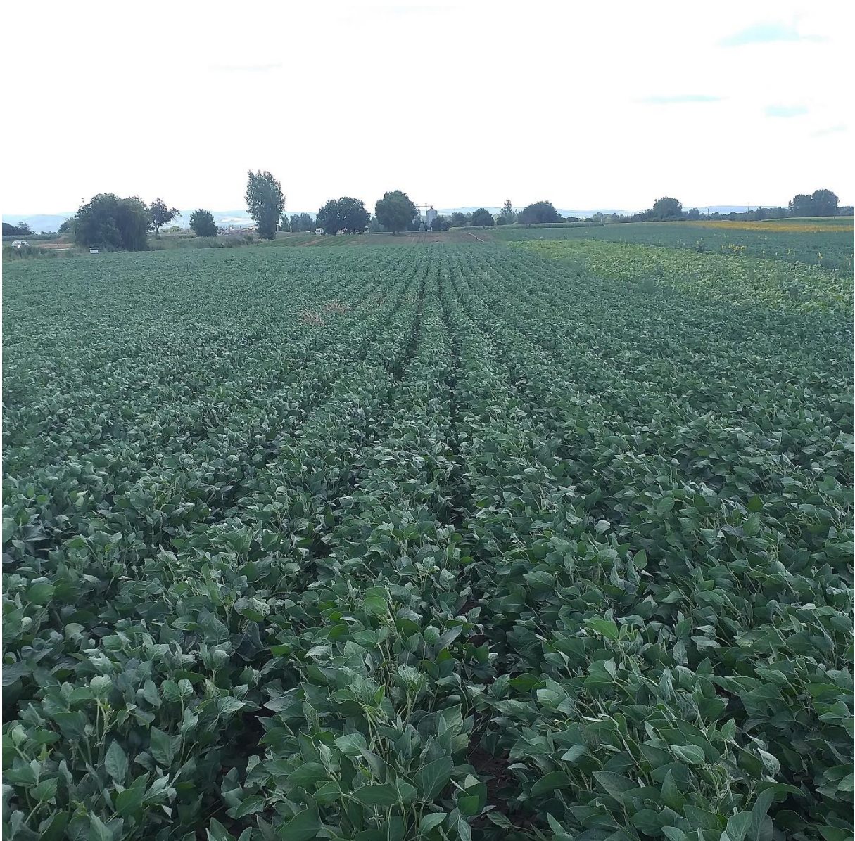
SLIKA 1. USEV SOJE