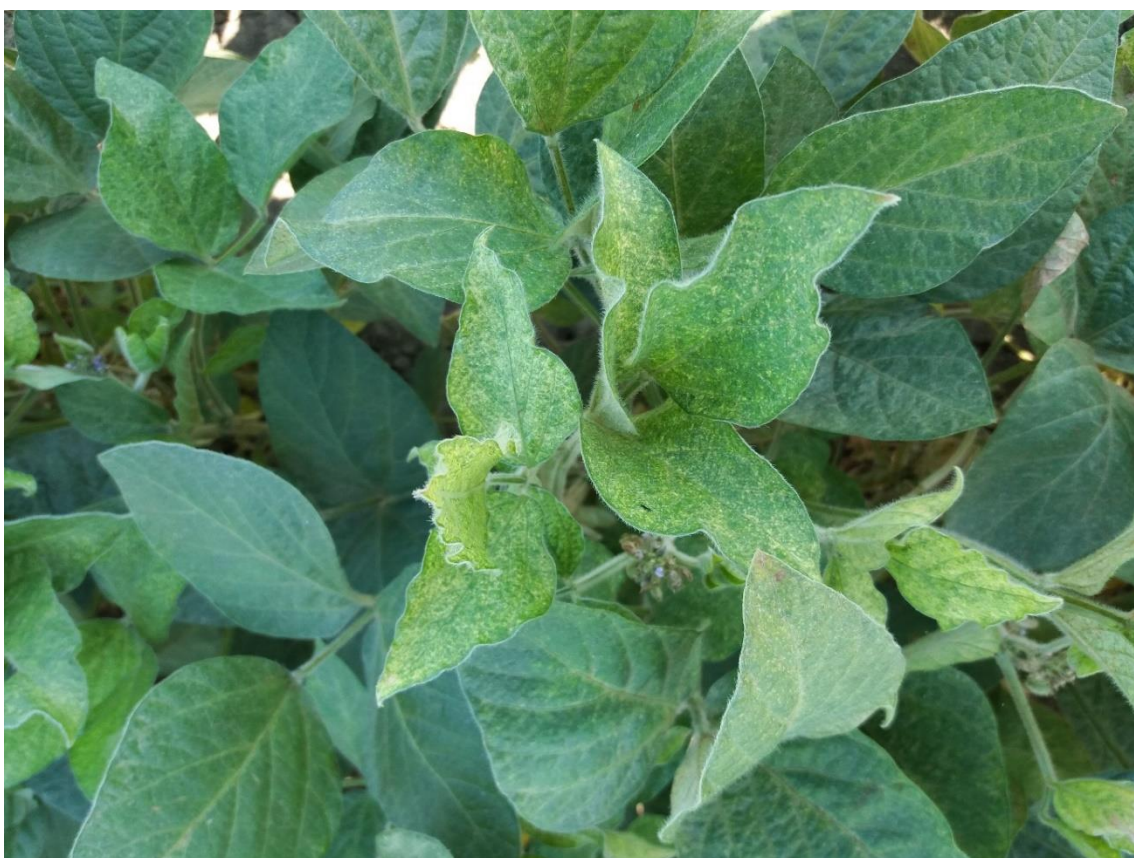
SLIKA 3. SIMPTOMI OŠTEĆENJA OD OBIČNOG PAUČINARA NA LISTOVIMA SOJE (PRETHODNE VEGETACIJE)