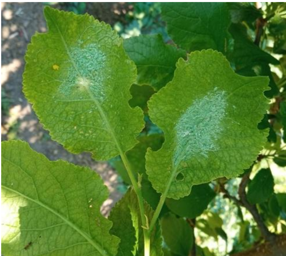
SLIKA 8. LISNE VAŠI NA LISTOVIMA ŠLJIVE