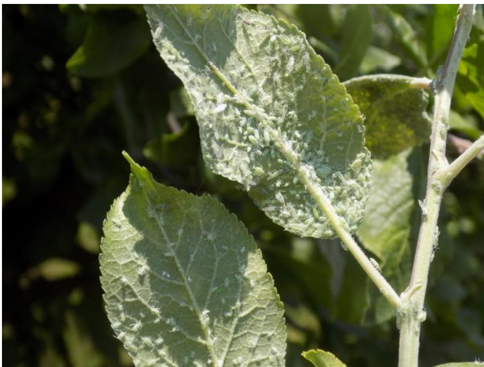
SLIKA 9. LISNE VAŠI NA LISTOVIMA ŠLJIVE