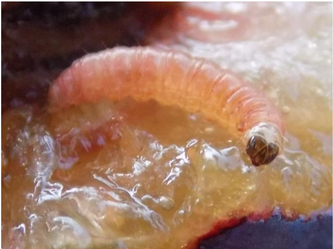
SLIKA 4. LARVA ŠJIVINOG SMOTAVCA U PLODU