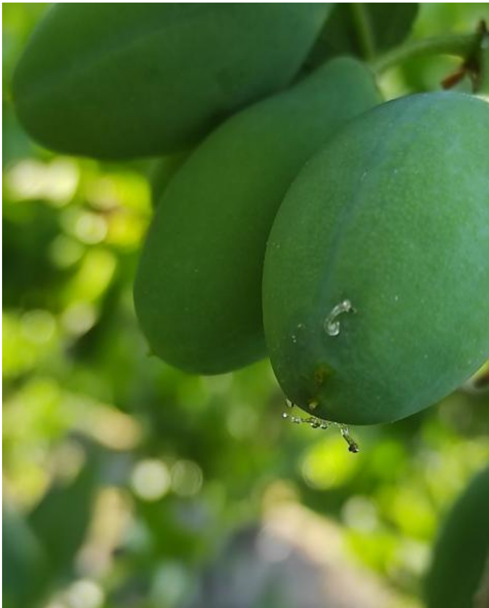
SLIKA 2. CURENJE SMOLE IZ NAPADNUTOG PLODA ŠLJIVE

ŠLJIVIN SMOTAVAC JE NAJZNAČAJNIJA ŠTETOČINA ŠLJIVE. U NAŠIM PROIZVODNIM USLOVIMA RAZVIJA TRI GENERACIJE GODIŠNJE. ŽENKA POLAŽE JAJA NAJČEŠĆE NA PLODOVE ILI LISTOVE U BLIZINI PLODOVA. NAKON PILJENJA LARVA PRAVI ULAZNI OTVOR I UVLAČI SE U UNUTRAŠNJOST PLODA. LARVE PRIČINJAVAJU ŠTETE ISHRANJUJUĆI SE MESOM PLODA, A TAKO NAPADNUTI PLODOVI SE PREPOZNAJU PO SMOLOTOČINI KOJA CURI IZ NJIH. INFESTIRANI PLODOVI PRESTAJU DA POVEĆAVAJU SVOJ VOLUMEN, ČESTO DOBIJAJU LJUBIČASTU BOJU, PREVREMENO SAZREVAJU I OTPADAJU.