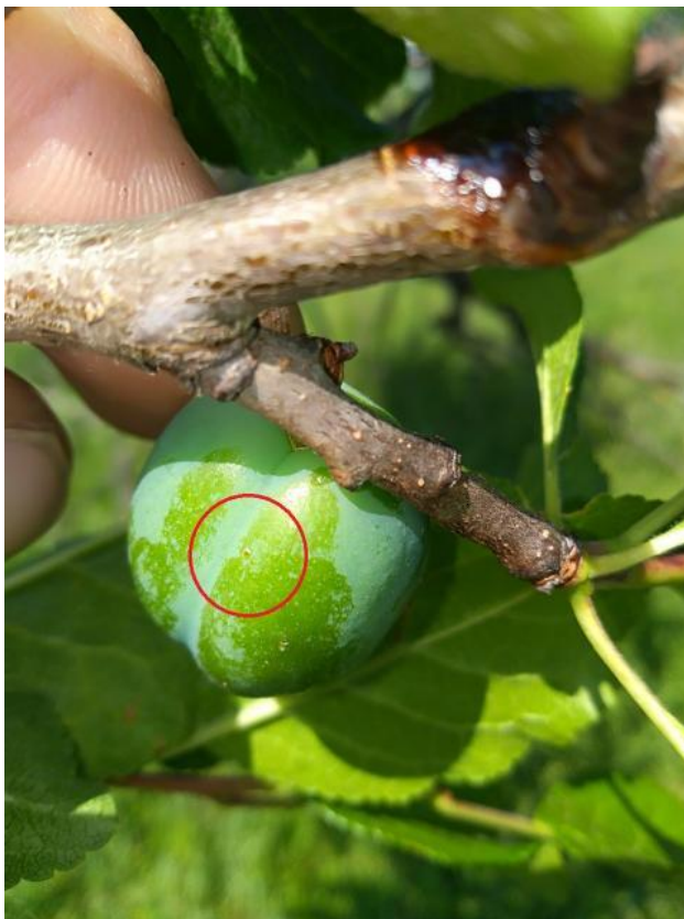
SLIKA 6. JAJE ŠLJIVINOG SMOTAVCA NA PLODU

NA PODRUČJU VOJVODINE U TOKU JE INTENZIVNO PILJENJE LARVI PRVE GENERACIJE ŠLJIVINOG SMOTAVCA. VIZUELIM PREGLEDOM ZASADA ŠLJIVA REGISTRUJE SE PRISUSTVO POLOŽENIH JAJA TE ŠTETOČINE U RAZLIČITIM EMBRIONALNIM FAZAMA RAZVOJA.