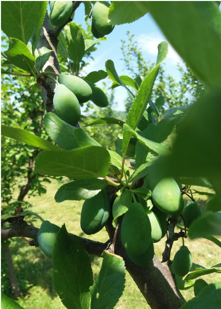
SLIKA 1: FAZA RAZVOJA ŠLJIVE

NA PODRUČJU VOJVODINE ŠLJIVE SE U ZAVISNOSTI OD SORTIMENTA I LOKALITETA NALAZE U RAZLIČITIM FAZAMA RAZVOJA PLODA: PLODOVI DOSTIGLI OD 50% DO 70% KRAJNJE VELIČINE.