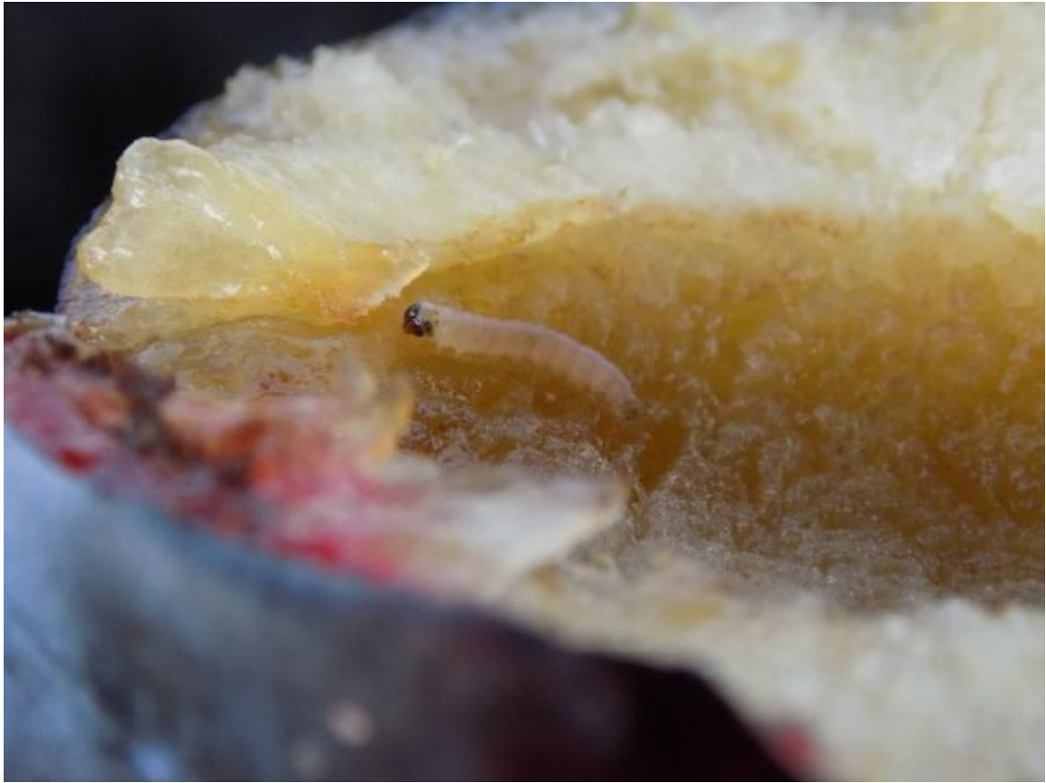
SLIKA 3. LARVA ŠJIVINOG SMOTAVCA U PLODU