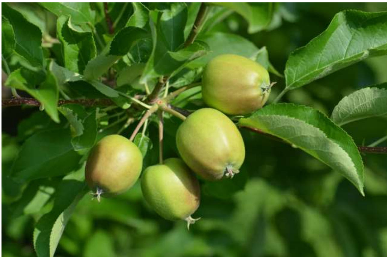
SLIKA1-FAZA RAZVOJA JABUKE, SORTA ZLATNI DELIŠES

NA PODRUČJU VOJVODINE JABUKE SE NALAZE U FAZI PORASTA PLODOVA, PLODOVI SU DOSTIGLI 40 MILIMETARA U PREČNIKU.