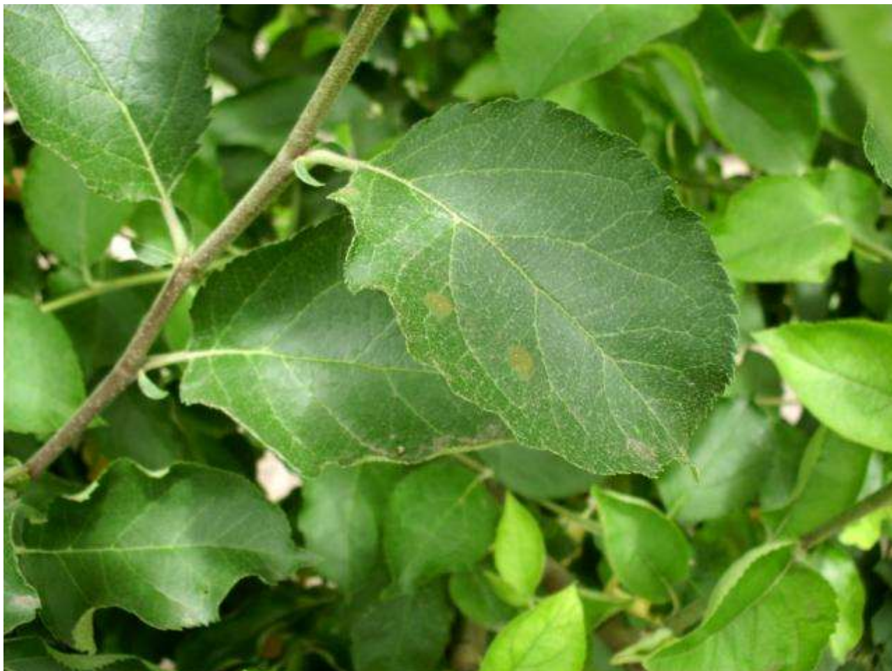
SLIKA3-SIMPTOMI ČAĐAVE PEGAVOSTI NA LISTU JABUKE

U ZASADIMA KOJI NISU ADEKVATNO ŠTIĆENI REGISTRUJU SE SIMPTOMI ČAĐAVE PEGAVOSTI NA LISTOVIMA I KRASTAVOSTI NA PLODOVIMA.