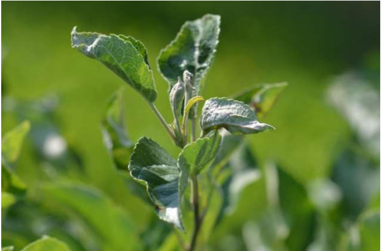
SLIKA4-SIMPTOM PEPELNICE JABUKE

U ZASADIMA JABUKA REGISTRUJE SE PRISUSTVO SIMPTOMA PEPELNICE. USLOVI U KOJIMA SE NALAZIMO SU VEOMA POVOLJNI ZA RAZVOJ OVOG PATOGENA, A TO SU RELATIVNA VLAŽNOST VAZDUHA VIŠA OD 60% I TEMPERATURE OD 15 DO 25°C.