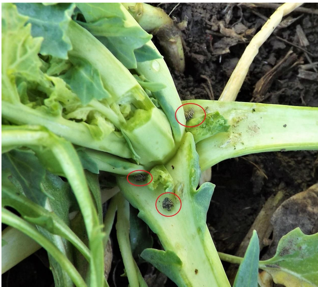
SLIKA 1. JEDINKE MALE REPIČINE PIPE NA BILJCI ULJANE REPICE KADA SE UZNEMIRE