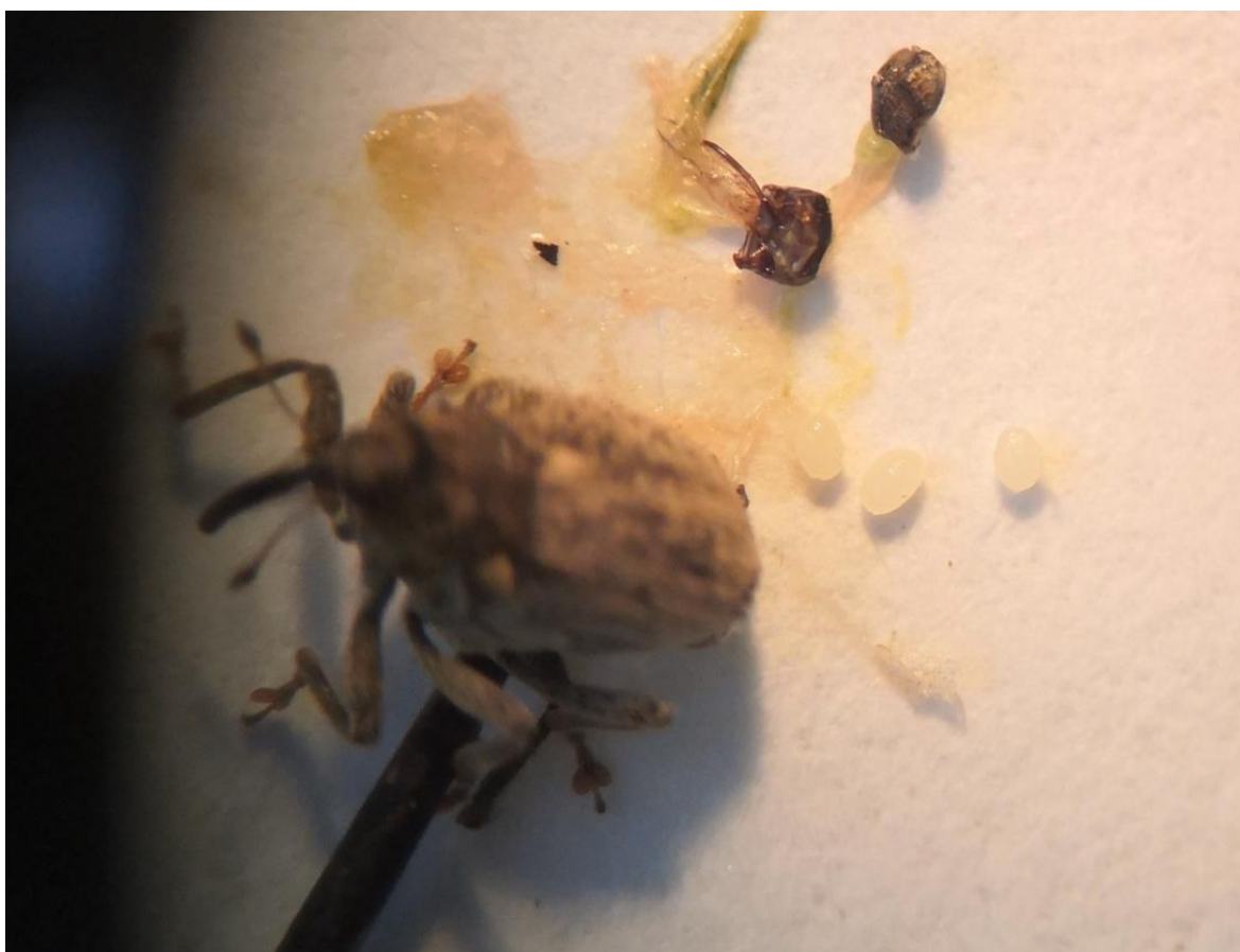
SLIKA 5. JAJA U TELU ŽENKI REPIČINIH PIPA