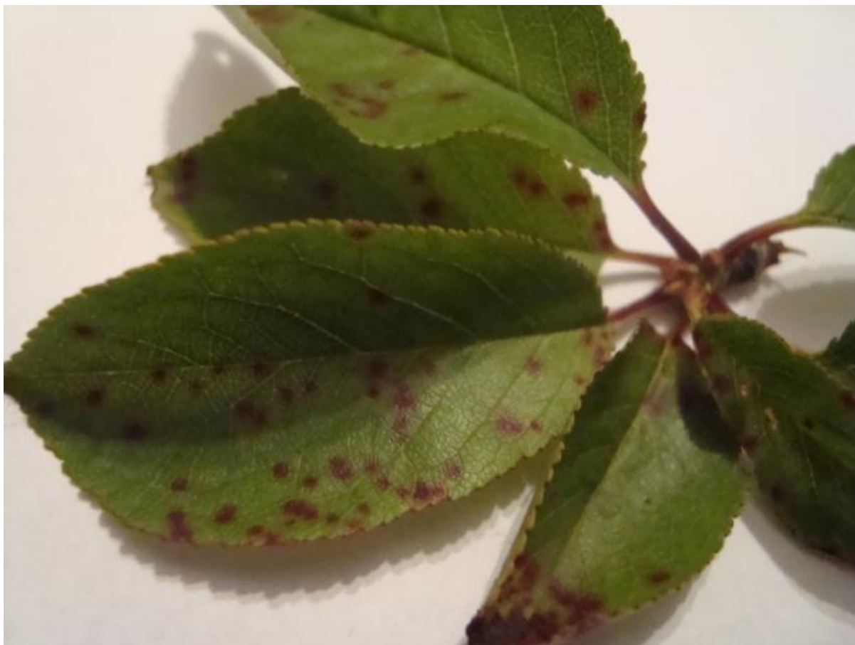
SLIKA 2. SIMPTOMI PEGAVOSTI NA LISTU VIŠNJE

OVA GLJIVA PREZIMLJAVA NA OPALOM LIŠĆU U OBLIKU APOTECIJA. U APOTECIJAMA DOLAZI DO FORMIRANJA ASKUSA SA ASKOSPORAMA. ZA OSLOBAĐANJE ASKOSPORA I STVARANJA USLOVA ZA PRIMARNE INFEKCIJE NEOPHODNO JE PRISUSTVO PADAVINA.