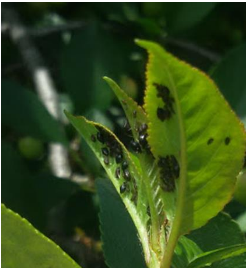
SLIKA 4. CRNA TREŠNJINA VAŠ