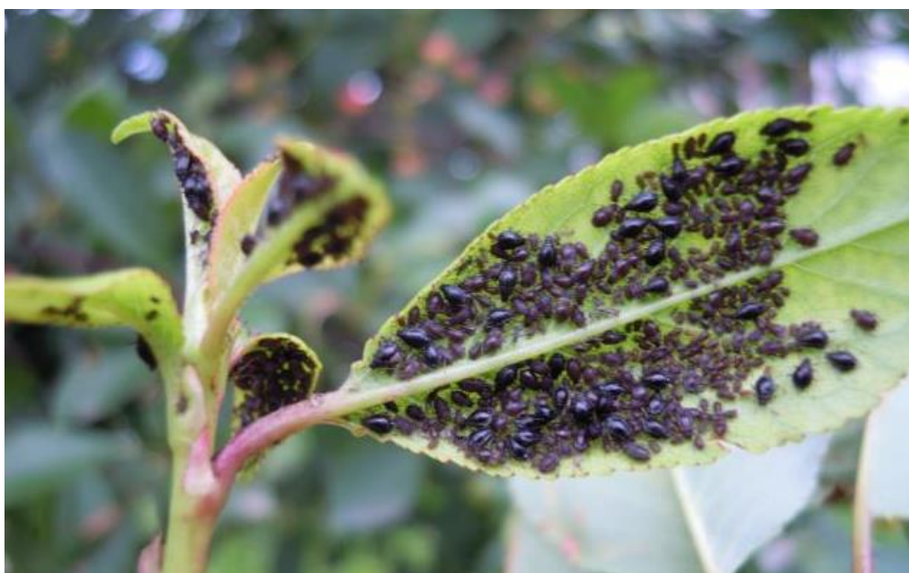
SLIKA 5. CRNA TREŠNJINA VAŠ