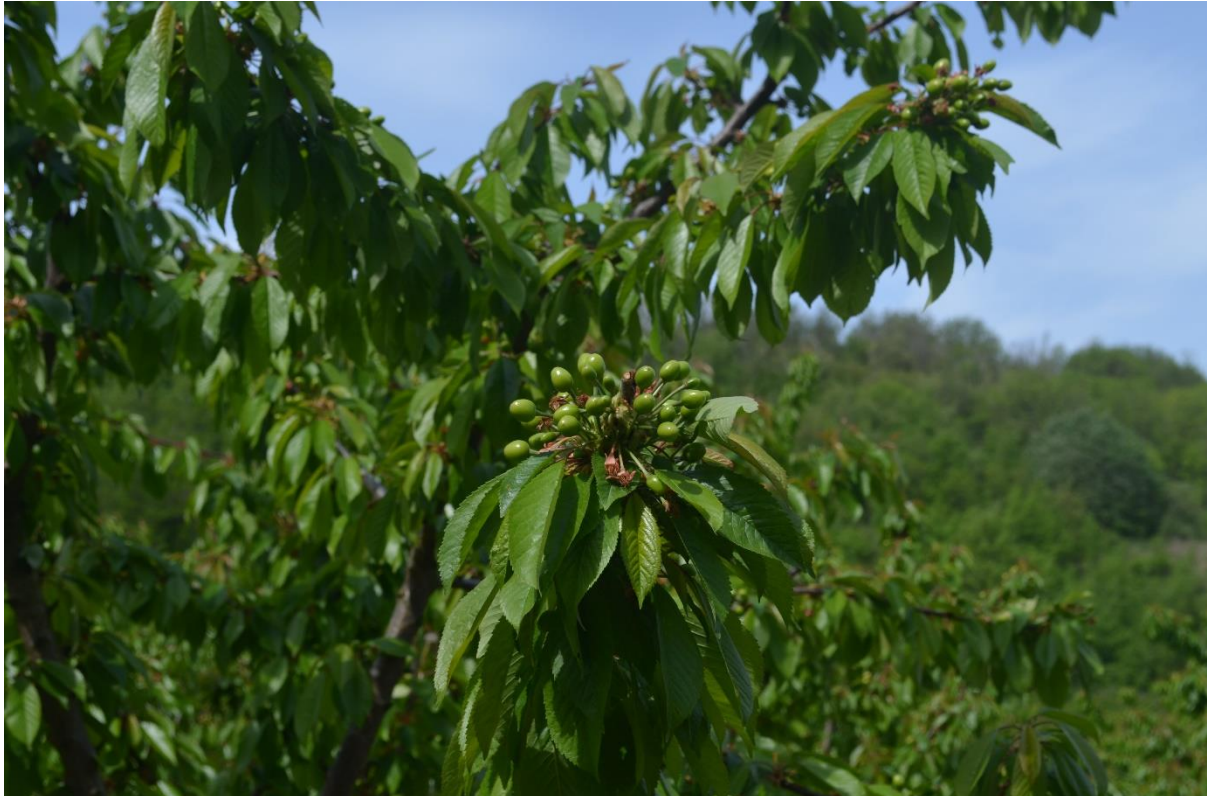
SLIKA 1. FAZA RAZVOJA TREŠNJE

NA PODRUČJU VOJVODINE ZASADI VIŠANJA I TREŠANJA SE NALAZE U FAZI OD DRUGOG OPADANJA PLODOVA DO POČETKA OBOJAVANJA PLODA.