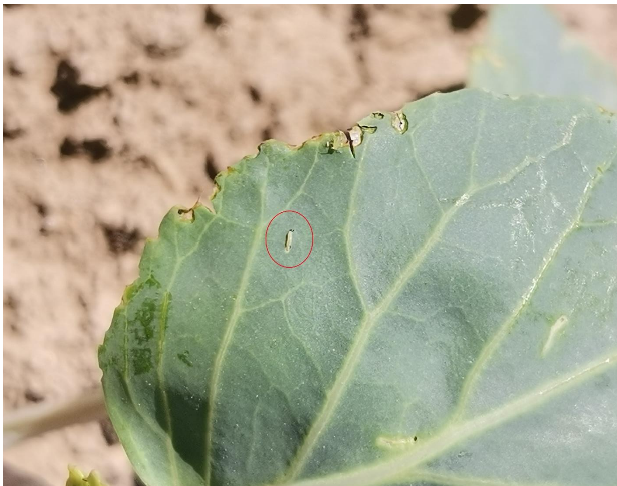
SLIKA 3. LARVA KUPUSOVOG MOLJCA