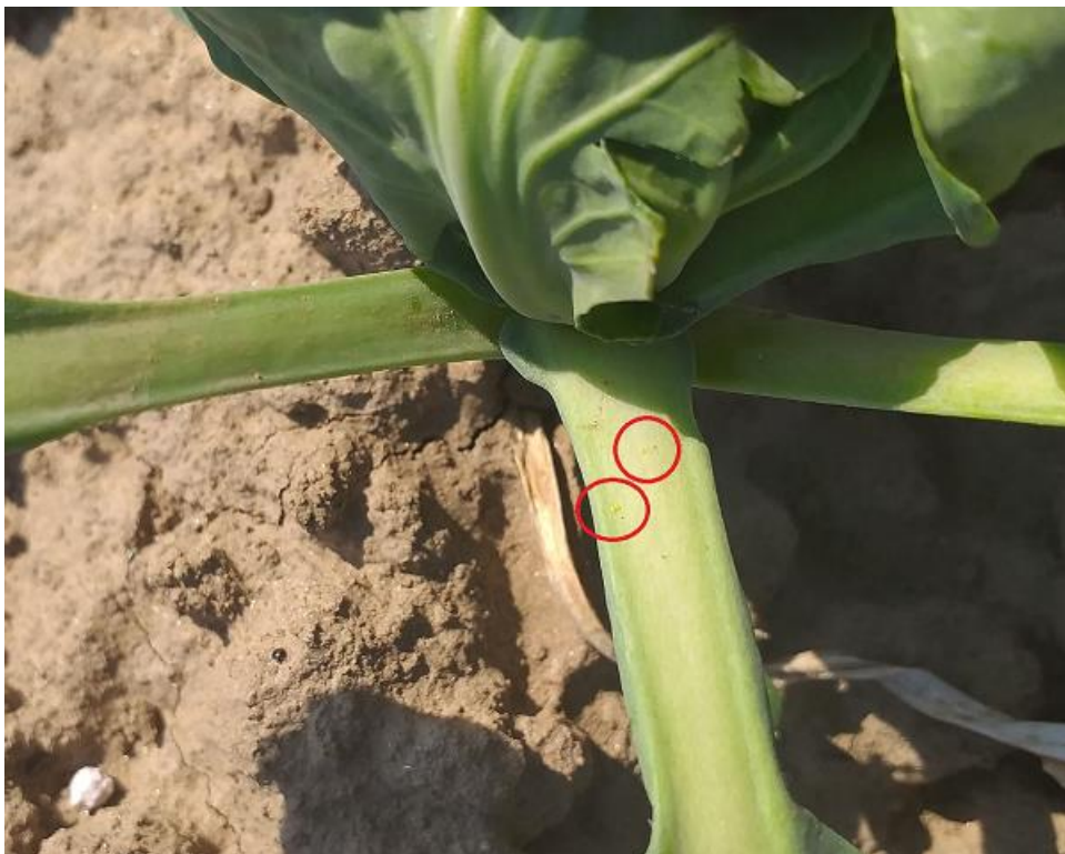
SLIKA 2. JAJA KUPUSOVOG MOLJCA