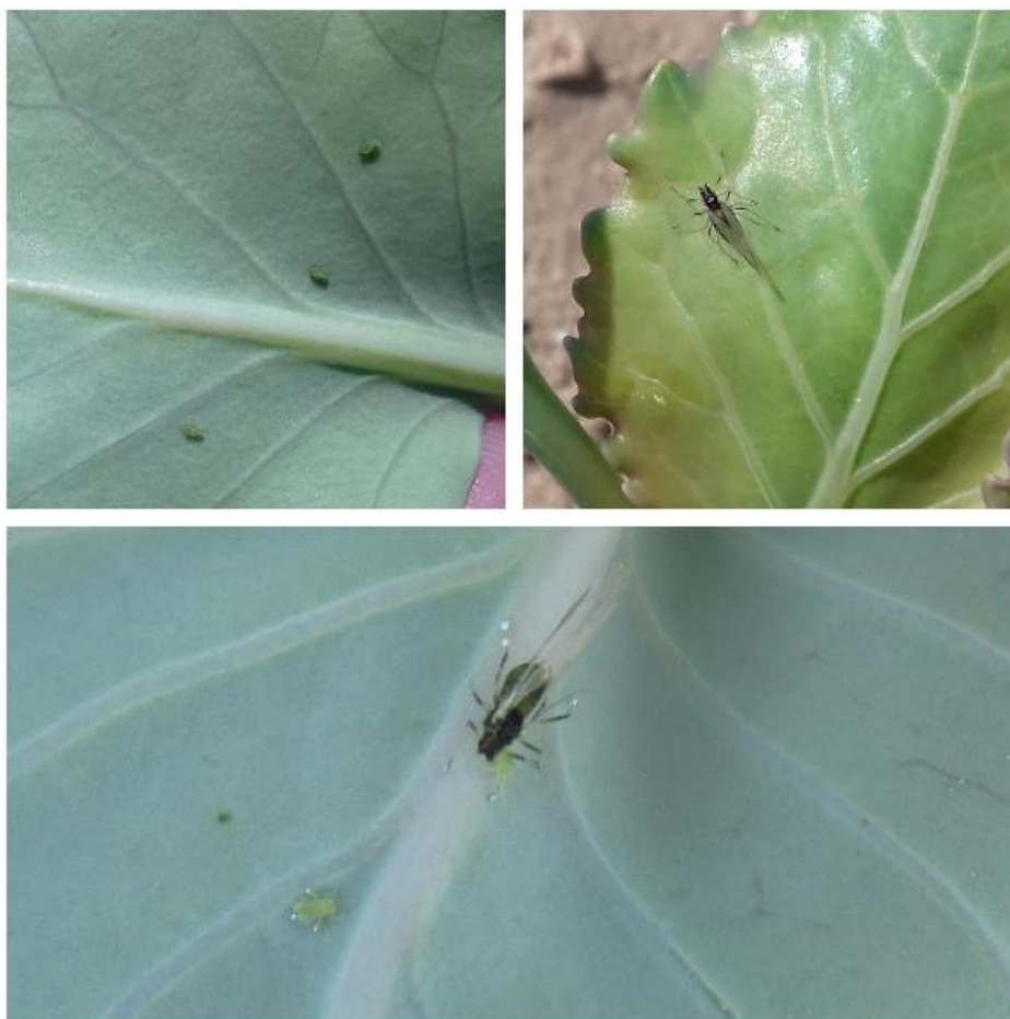
SLIKA 5. VAŠI NA KUPUSU