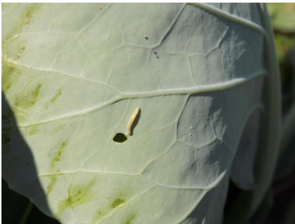
SLIKA 4. LARVA KUPUSOVOG MOLJCA