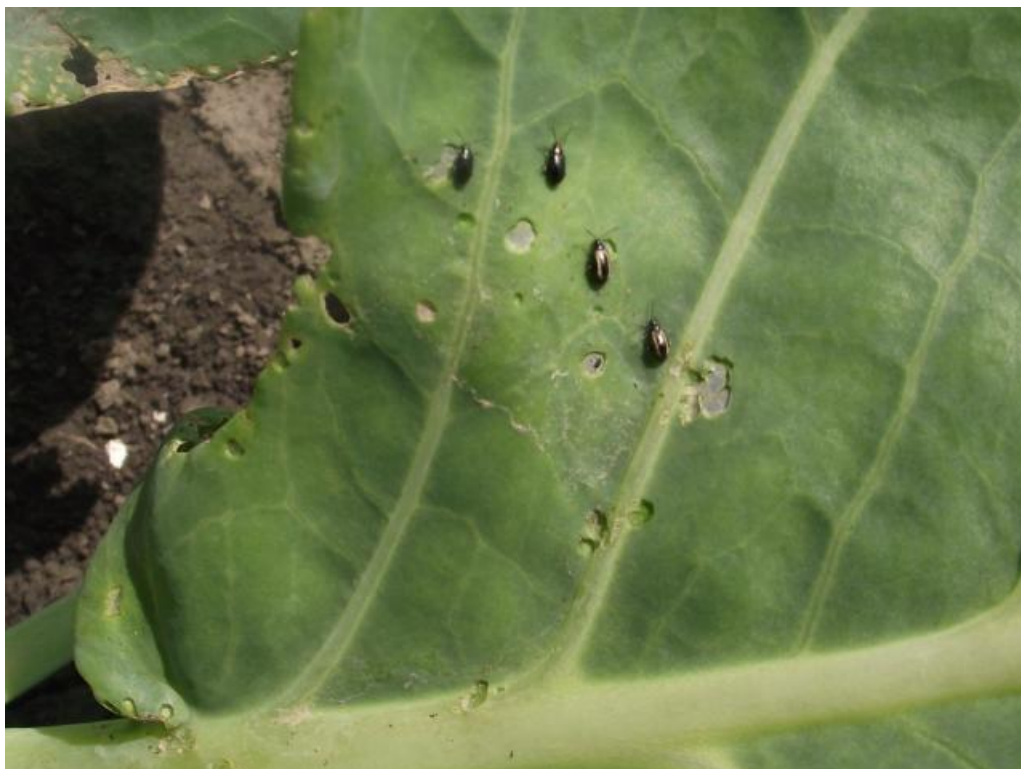
SLIKA 6. ODRASLE JEDINKE BUVAČA I ŠTETE OD NJIHOVE ISHRANE NA LISTU