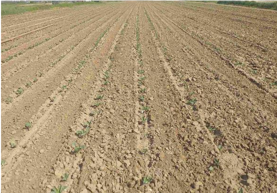
SLIKA 1. USEV KUPUSA