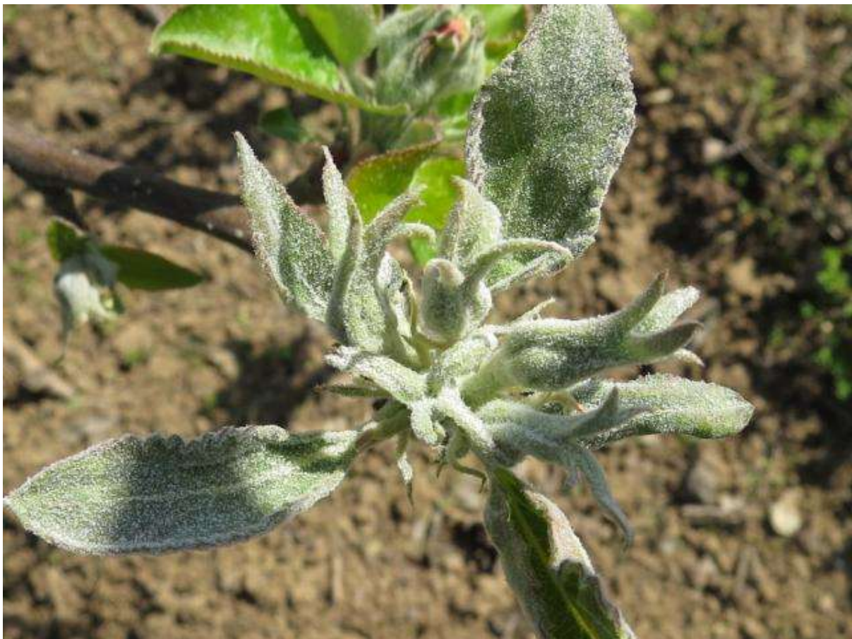
SLIKA 4. SIMPTOMI PEPELNICE JABUKE – BELI MLADAR

U ZASADIMA JABUKA REGISTRUJE SE PRISUSTVO SIMPTOMA PEPELNICE U VIDU BELIH MLADARA. USLOVI U KOJIMA SE NALAZIMO SU VEOMA POVOLJNI ZA DALJI RAZVOJ OVOG PATOGENA, A TO SU RELATIVNA VLAŽNOST VAZDUHA VIŠA OD 60% I TEMPERATURE OD 15 DO 25°C.