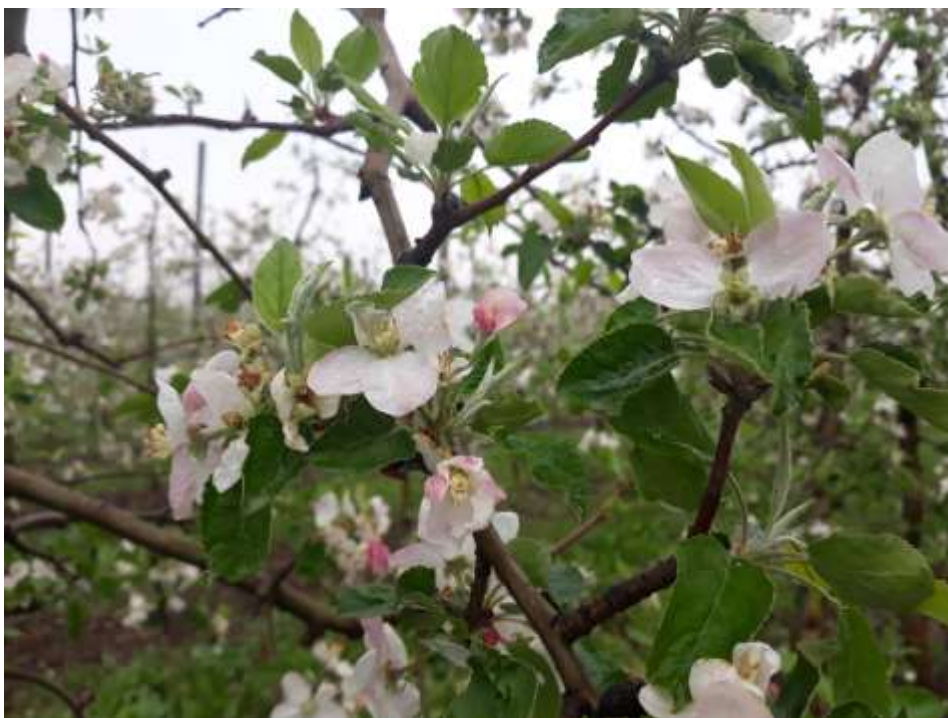
SLIKA 2. FAZA JABUKE