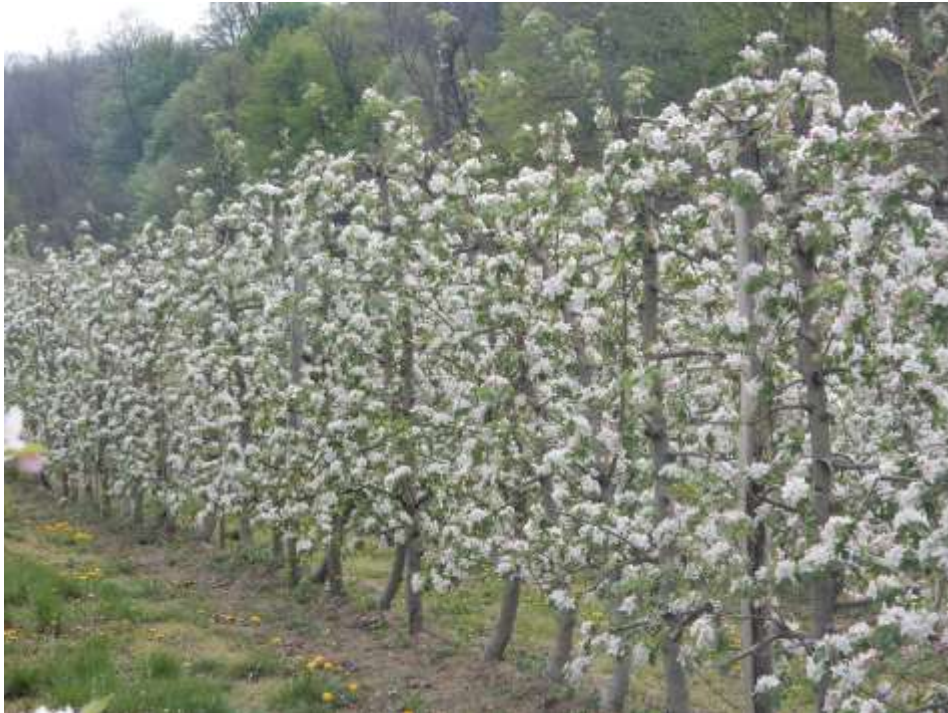
SLIKA 1. FAZA JABUKE

NA PODRUČJU VOJVODINE ZASADI JABUKA SE NALAZE U RAZLIČITIM FAZAMA CVETANJA.