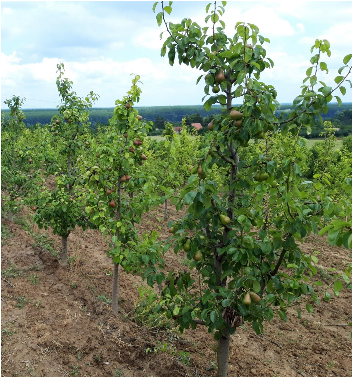
SLIKA 1. FAZA RAZVOJA KRUŠKE

NA PODRUČJU VOJVODINE SREDNJE I KASNE SORTE KRUŠAKA SE NALAZE U RAZLIČITIM FAZAMA RAZVOJA PLODOVA, PLODOVI SU DOSTIGLI VELIČINU OD 40 DO 80% KRANJE VELIČINE, DOK SE RANE SORTE NALAZE U RAZLIČITIM FAZAMA SAZREVANJA PLODOVA.