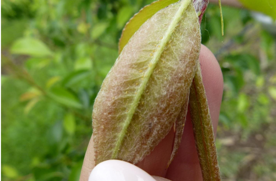
SLIKA 3. JAJA OBIČNE KRUŠKINE BUVE NA NALIČJU LISTA KRUŠKE