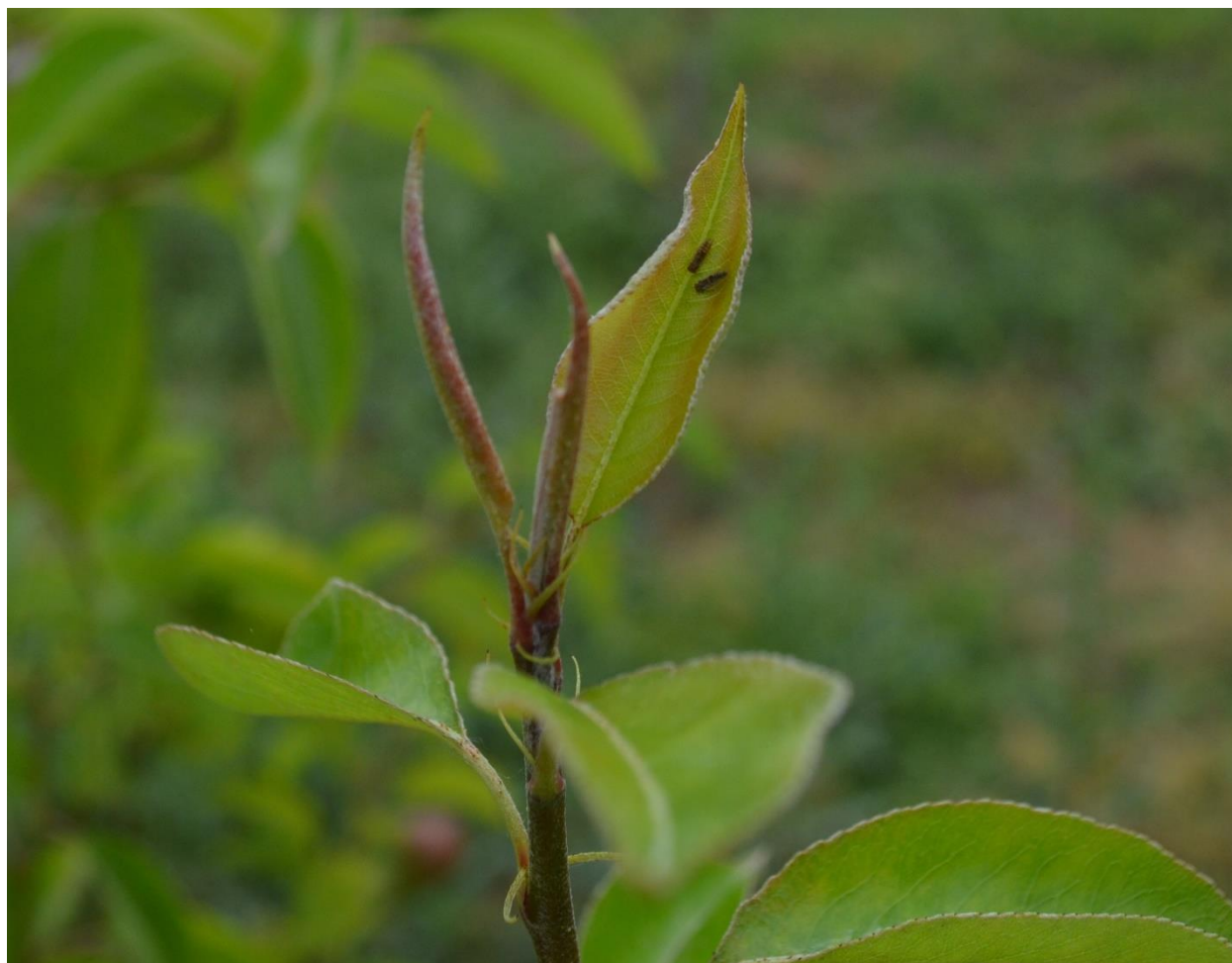
SLIKA 2. IMAGO OBIČNE KRUŠKINE BUVE

U ZASADIMA KRUŠAKA U TOKU JE INTENZIVNO PILJENJE LARVI DRUGE LETNJE GENERACIJE.