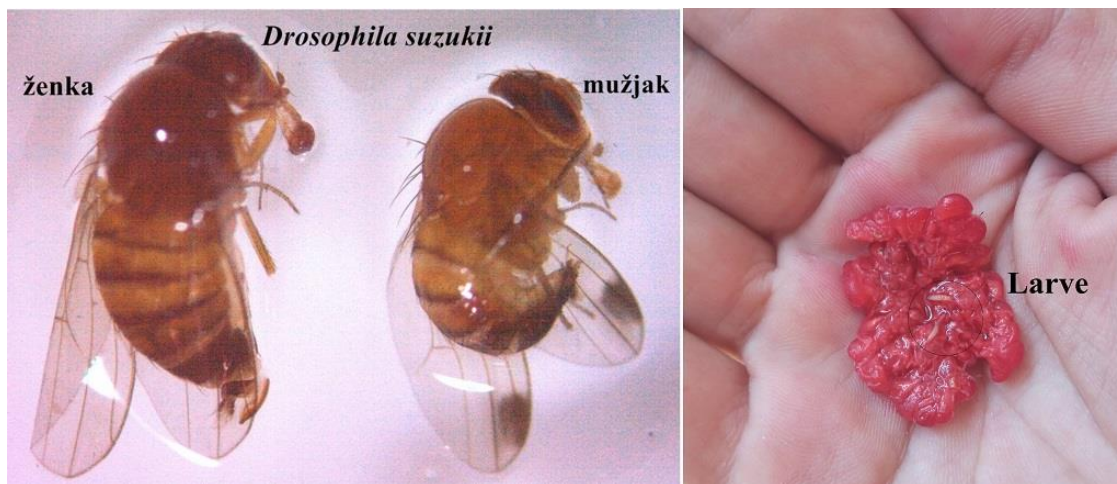
SLIKA 1. ODRASLE JEDINKE I LARVE U PLODOVIMA MALINE

AZIJSKA VOĆNA MUŠICA JE ŠTETOČINA JAGODIČASTOG VOĆA, KOŠTIČAVOG VOĆA I VINOVE LOZE. BILJNE VRSTE NA KOJIMA SE HRANI OVA VOĆNA MUŠICA U OPASNOSTI SU I NAJOSETLJIVIJE SU U VREME ZRENJA. ŠTETE KOJE MOŽE DA IZAZOVE SU I DO 100%. ŽENKE POLAŽU JAJA U ZDRAVE PLODOVE U FAZI ZRENJA. USLED ISHRANE LARVI PLODOVI POTPUNO PROPADAJU.