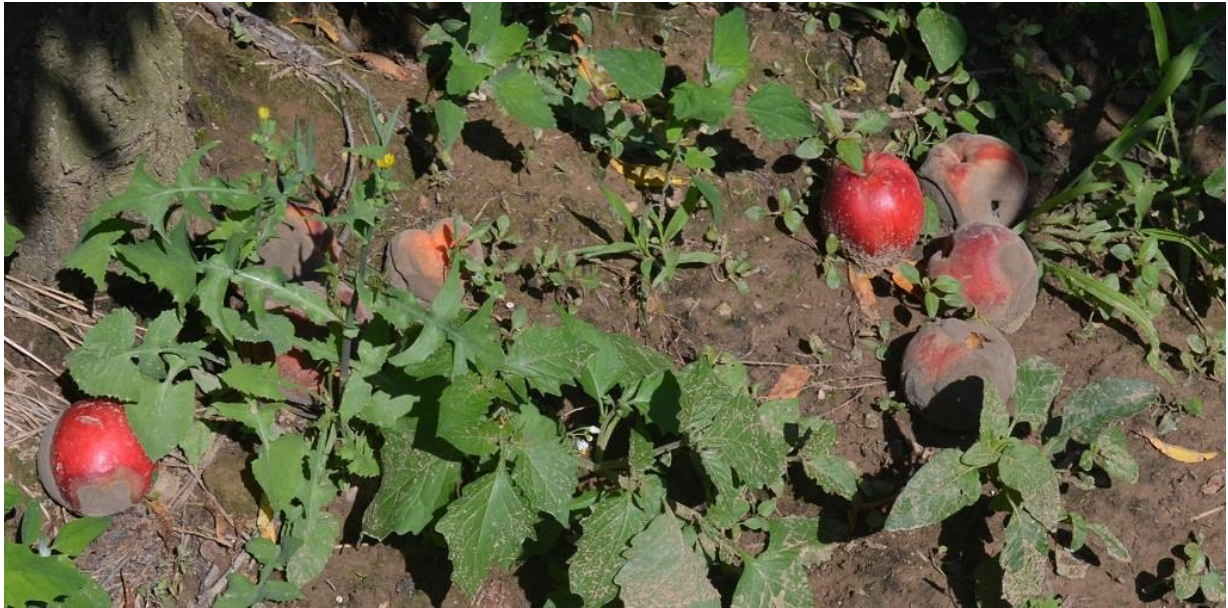
SLIKA 5. PREZRELI PLODOVI BRESKVE KOJI SU OTPALI NA ZEMLJU