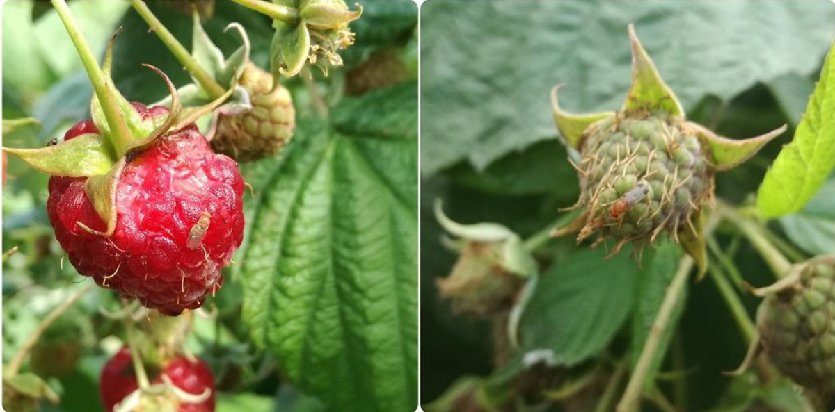
SLIKA 5. IMAGO NA PLODOVIMA MALINE

NA PODRUČJU VOJVODINE U ZASADIMA MALINE, KUPINE, BRESKVE I VINOVE LOZE, NA LOVNIM KLOPKAMA, REGISTRUJE SE PRISUSTVO ODRASLIH JEDINKI AZIJSKE VOĆNE MUŠICE. IAKO SU TRENUTNE BROJNOSTI ULOVLJENIH ODRASLIH JEDINKI NA KLOPKAMA MALE, ZBOG VEOMA VISOKOG REPRODUKTIVNOG POTENCIJALA I BRZOG CIKLUSA RAZVIČA OVE ŠTETOČINE, POSTOJI RIZIK OD NASTANKA ŠTETA U ZASADIMA REMOTANTNIH SORTI MALINE, ZATIM KUPINE, U ZASADIMA SA KASNIM SORTAMA BRESAKA I U VINOGRADIMA.