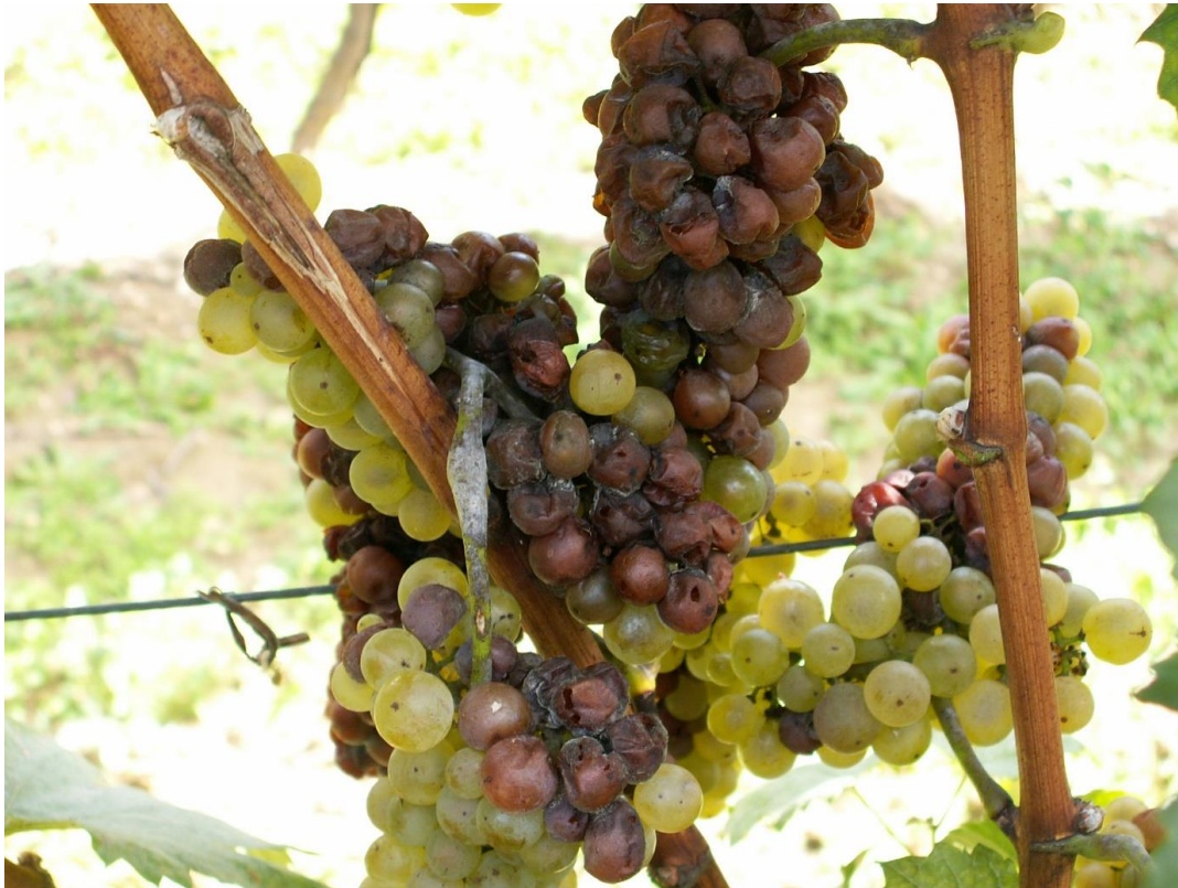
SLIKA 3. ŠTETE NA GROŽĐU

NA MESTIMA GDE ŽENKA PRAVI ZAREZE PRILIKOM POLAGANJA JAJA OTVARA SE PUT ZA INFEKCIJE RAZLIČITIM VRSTAMA PATOGENA PROUZROKOVAČA TRULEŽI.