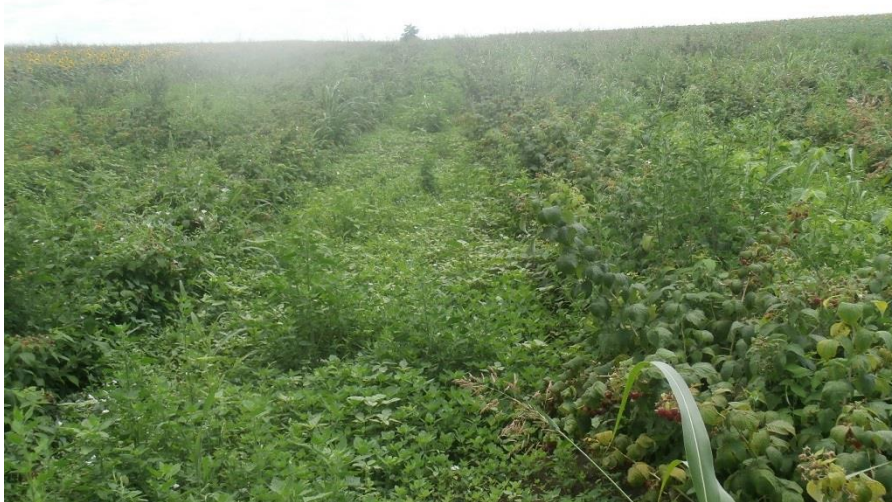
SLIKA 6. NAPUŠTEN ZASAD MALINE

PORED SANITARNIH MERA, PREPORUČUJE SE I POSTAVLJANJE VELIKOG BROJA KLOPKI ZA MASOVNO IZLOVLJAVANJE U CILJU SMANJENJA BROJA ODRASLIH JEDINKI. KAO MIRISNI ATRAKTANT U KLOPKE SE MOŽE SIPATI MEŠAVINA CRNOG VINA I JABUKOVOG SIRĆETA SA PAR KAPI DETERDŽENTA.