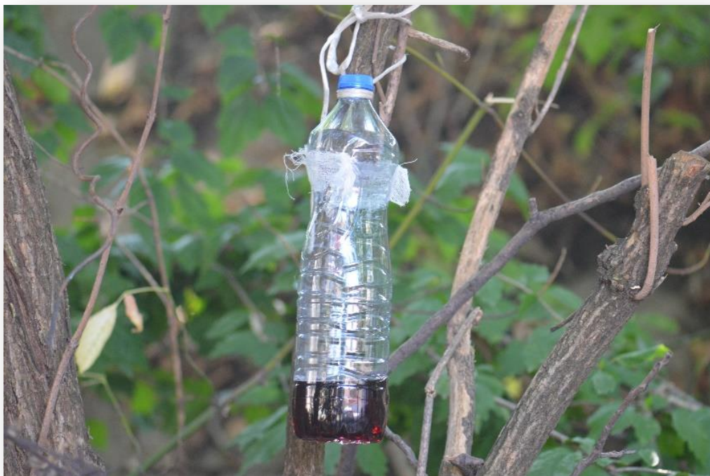
SLIKA 7. KLOPKA ZA AZIJSKU VOĆNU MUŠICU