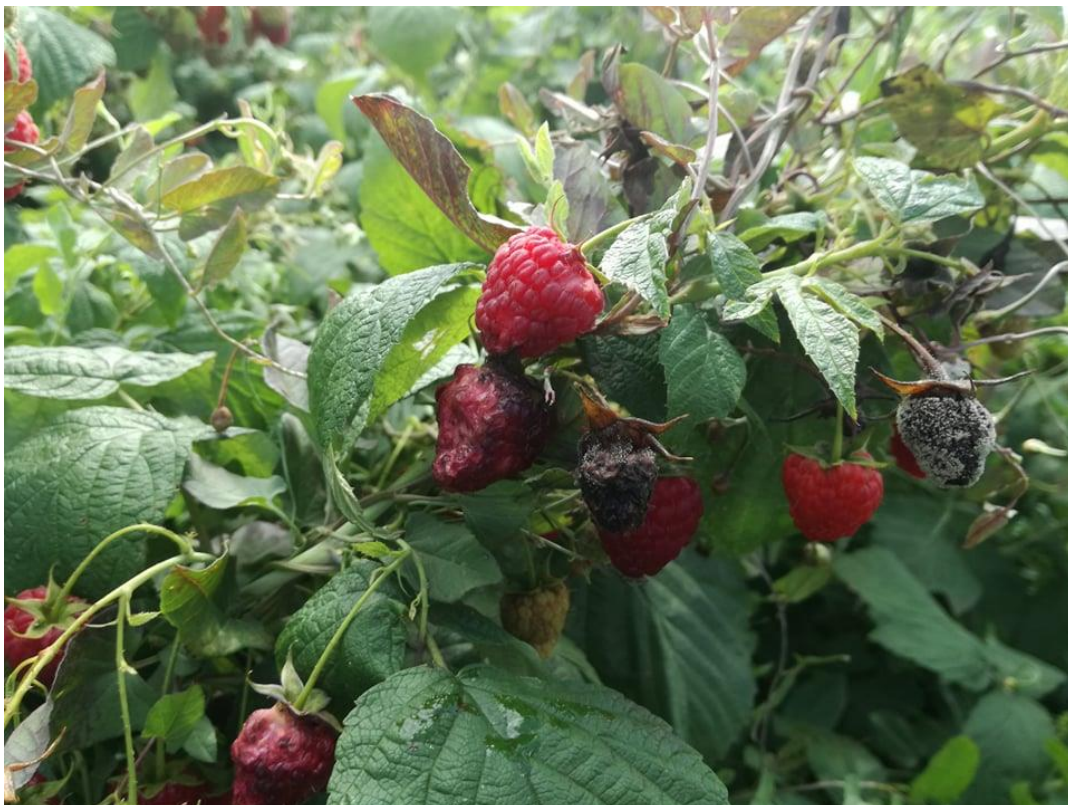
SLIKA 4. ŠTETE NA MALINAMA