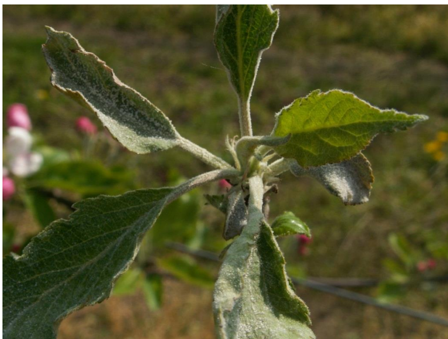
SLIKA 3. SIMPTOMI PEPELNICE JABUKE – BELI MLADAR