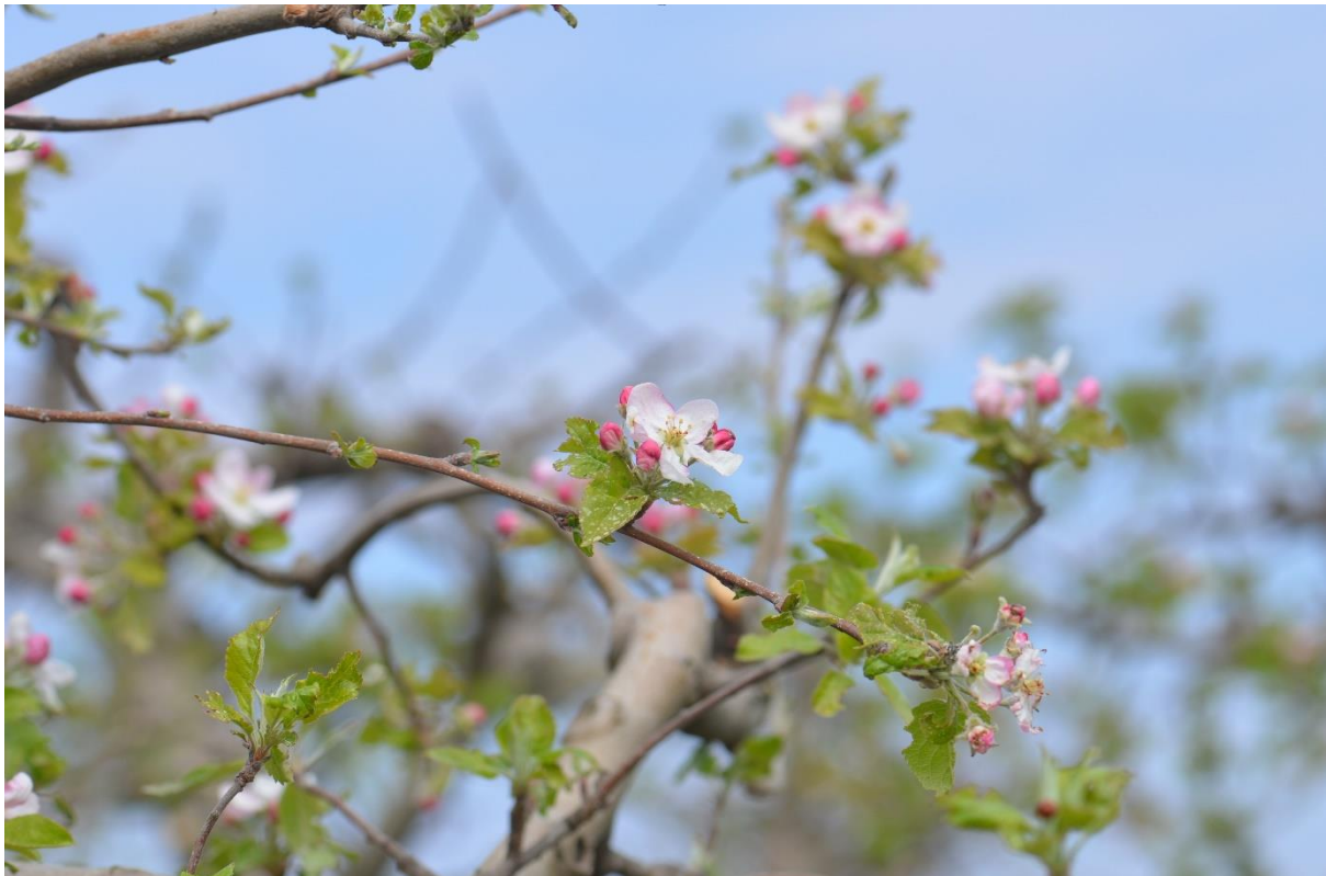
SLIKA 1. FAZA JABUKE

NA PODRUČJU VOJVODINE JABUKE SE NALAZE U RAZLIČITIM FENOFAZAMA, OD FAZE FORMIRANIH CRVENIH PUPOLJAKA DO FAZE PUNOG CVETANJA.