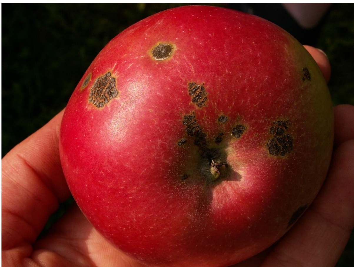
SLIKA 6. ČAĐAVA KRSTAVOST PLODA JABUKE

..... POŠTOVANI POLJOPRIVREDNI PROIZVOĐAČI I POŠTOVANI GLEDAOCI, DETALJNIJE INFORMACIJE O POJAVI ŠTETNIH ORGANIZAMA I MERAMA KONTROLE MOŽETE POGLEDATI NA SAJTU PROGNOZNO IZVEŠTAJNE SLUŽBE ZAŠTITE BILJA VOJVODINE WWW.PISVOJVODINA.COM