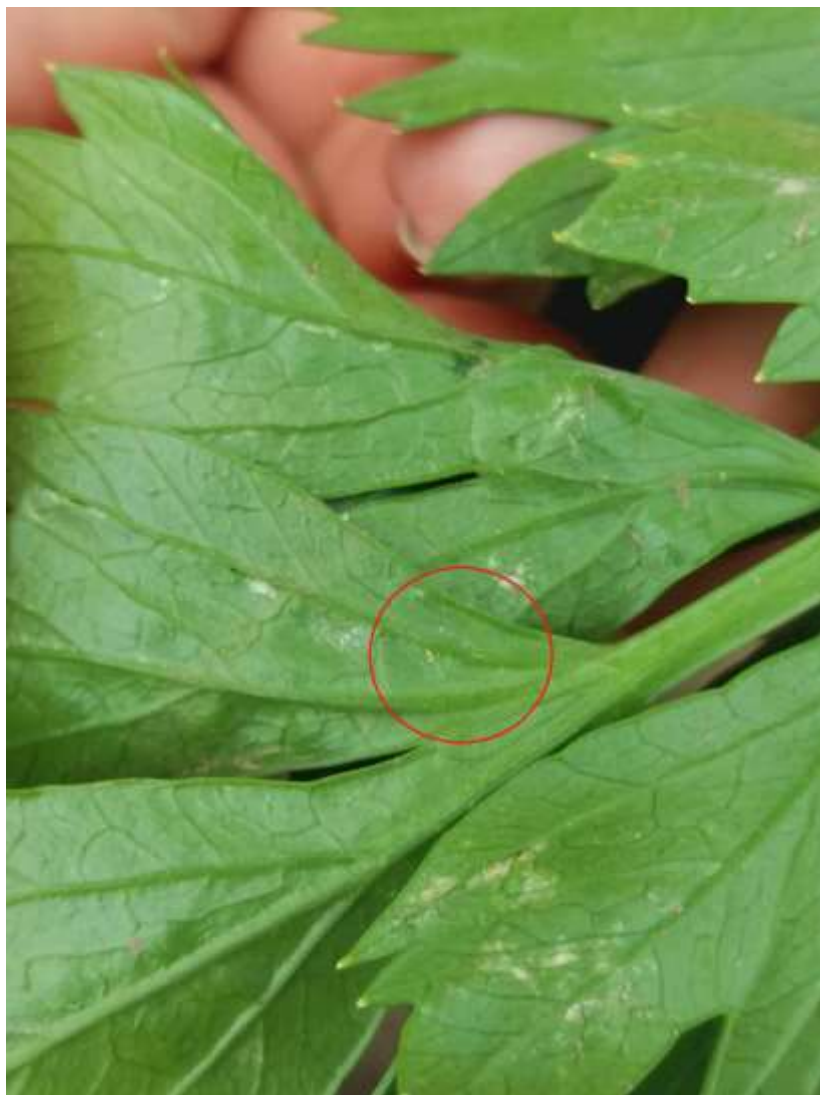
SLIKA 1. OBIČNI PAUČINAR NA LISTU CELERA

OVE ŠTETOČINE ŽIVE NA NALIČJU LISTA GDE SE HRANE SISAJUĆI SOKOVE BILJAKA. PRVI SIMPTOMI NAPADA SE UOČAVAJU NA LICU LISTA U OBLIKU SITNIH PEGA SREBRNASTOBELE BOJE. KAKO SE BROJNOST GRINJA I NAPAD UVEĆAVA, PEGE SE MEĐUSOBNO SPAJAJU I ČITAVA POVRŠINA LISTA ŽUTI I SUŠI SE. KOD NAPADNUTIH BILJAKA POVEĆAVA SE TRANSPIRACIJA, SMANJUJE INTENZITET FOTOSINTEZE ŠTO ZA POSLEDICU IMA SKARAĆENJE VEGETACIJE, ZAOSTAJANJE U PORASTU I FORMIRANJE MANJIH I SITNIJIH PLODOVA.