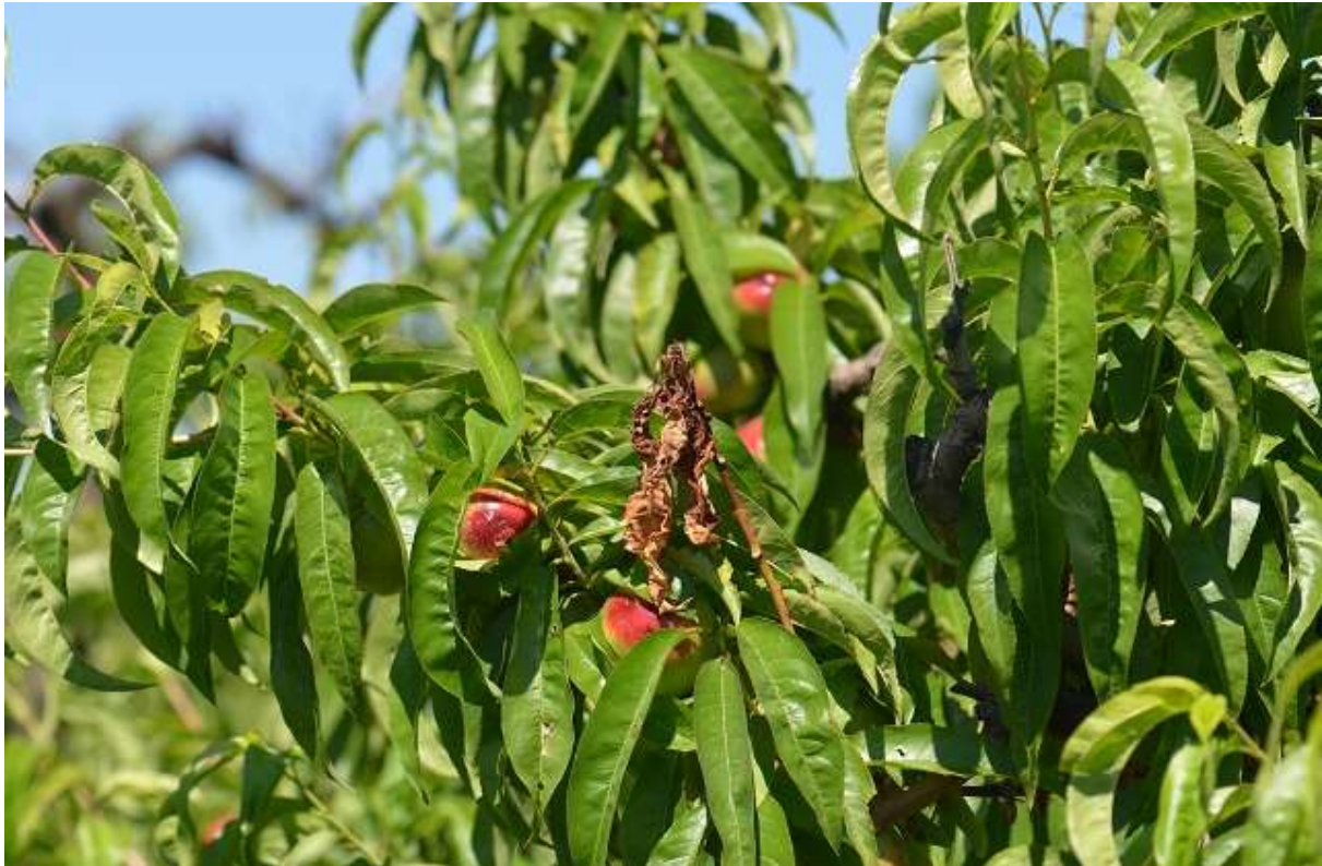
SLIKA 2: SIMPTOM OŠTEĆENOG MLADARA OD BRESKVINOG SMOTAVCA

ZNAČAJNIJE ŠTETE LARVE PRAVE UBUŠIVANJEM U PLODOVE. NA MESTU ULASKA PRISUTAN JE IZMET LARVI KAO I CURENJE SMOLOTOČINE. TAKVI PLODOVI GUBE TRŽIŠNU VREDNOST I OTPADAJU PRE VREMENA.