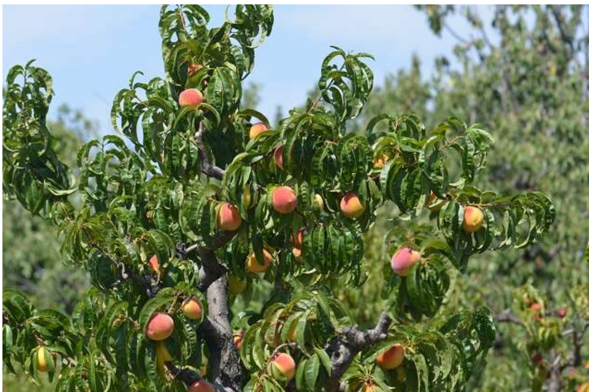
SLIKA 1: FAZA RAZVOJA BRESKVE

NA PODRUČJU VOJVODINE ZAVRŠENA JE BERBA SREDNJESTASNIH SORATA BRESKVI I NEKTARINA, DOK SE KASNOSTASNE SORTE NALAZE U FAZI OBOJAVANJE PLODA SKORO ZAVRŠENO.