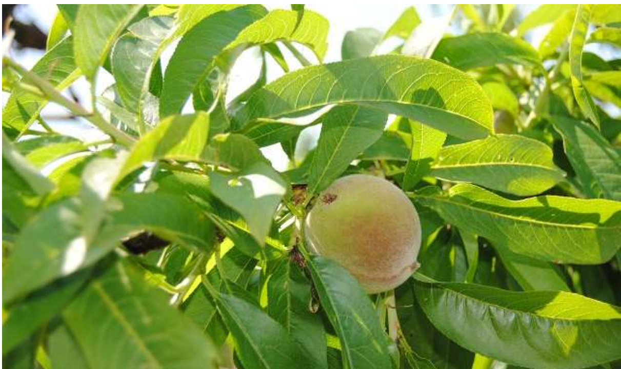
SLIKA 3: UBUŠENJE NA PLODU BRESKVE OD BRESKVINOG SMOTAVCA

ZNAČAJNIJE ŠTETE LARVE PRAVE UBUŠIVANJEM U PLODOVE. NA MESTU ULASKA PRISUTAN JE IZMET LARVI KAO I CURENJE SMOLOTOČINE. TAKVI PLODOVI GUBE TRŽIŠNU VREDNOST I OTPADAJU PRE VREMENA.