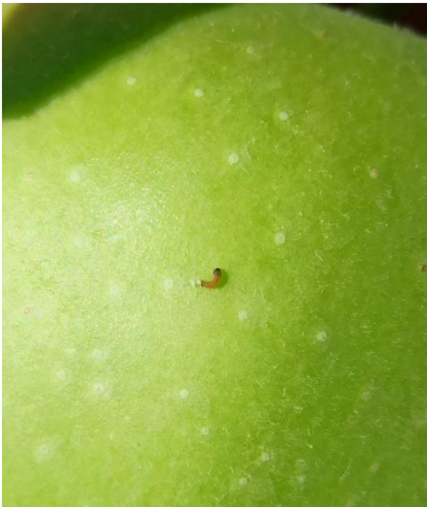
SLIKA 3. TEK ISPILJENJA LARVA JABUKINOG SMOTAVCA NA PLODU