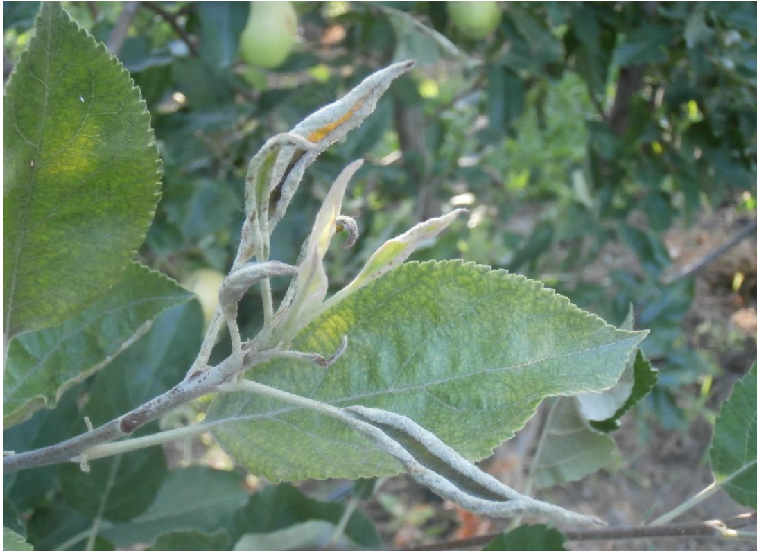
SLIKA 6. SIMPTOM PEPELNICE JABUKE