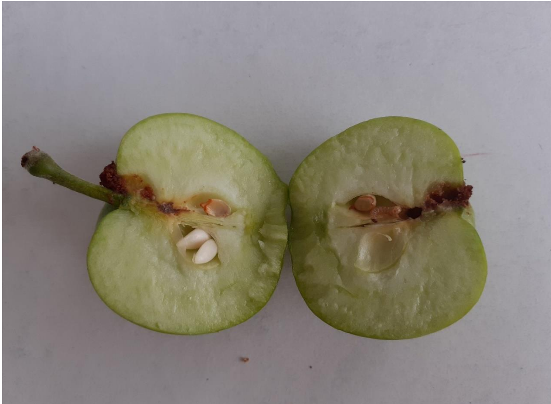
SLIKA 5. PLOD SA UBUŠENOM LARVOM JABUKINOG SMOTAVCA