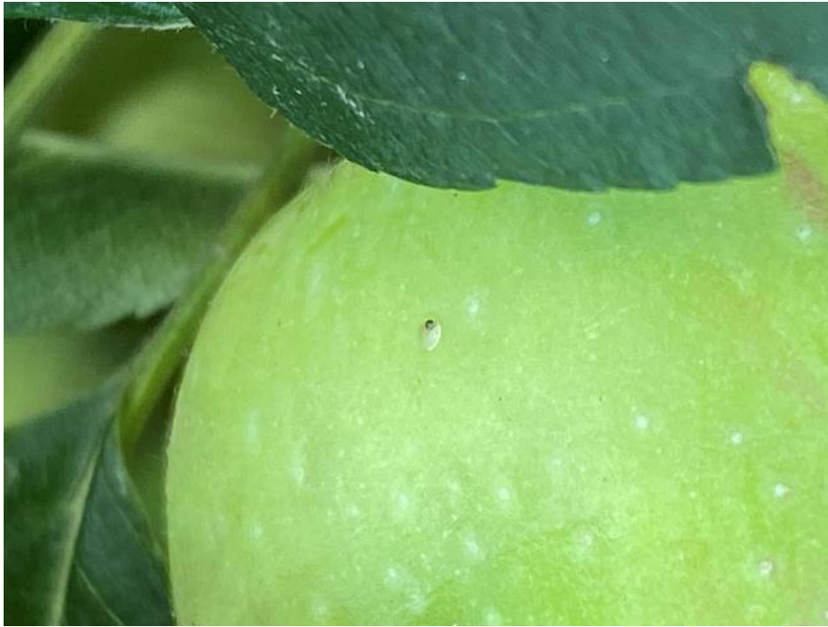
SLIKA 2. JAJE JABUKINOG SMOTAVCA PRED PILJENJE