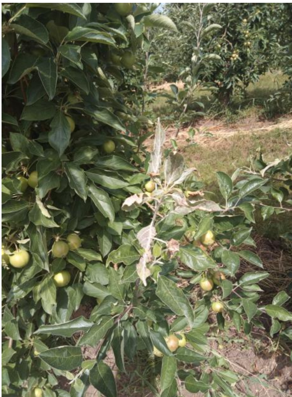
SLIKA 7. SIMPTOM PEPELNICE JABUKE

..... POŠTOVANI POLJOPRIVREDNI PROIZVOĐAČI I POŠTOVANI GLEDAOCI, DETALJNIJE INFORMACIJE O POJAVI ŠTETNIH ORGANIZAMA I MERAMA KONTROLE MOŽETE POGLEDATI NA SAJTU PROGNOZNO IZVEŠTAJNE SLUŽBE ZAŠTITE BILJA VOJVODINE WWW.PISVOJVODINA.COM