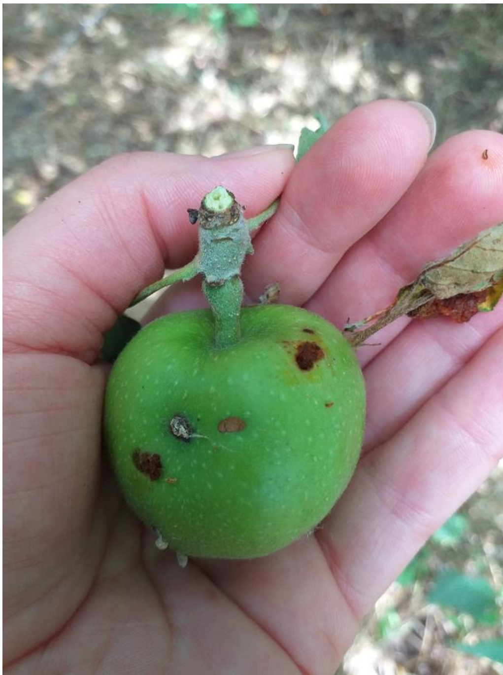
SLIKA 4. NAPADNUT PLOD OD JABUKINOG SMOTAVCA