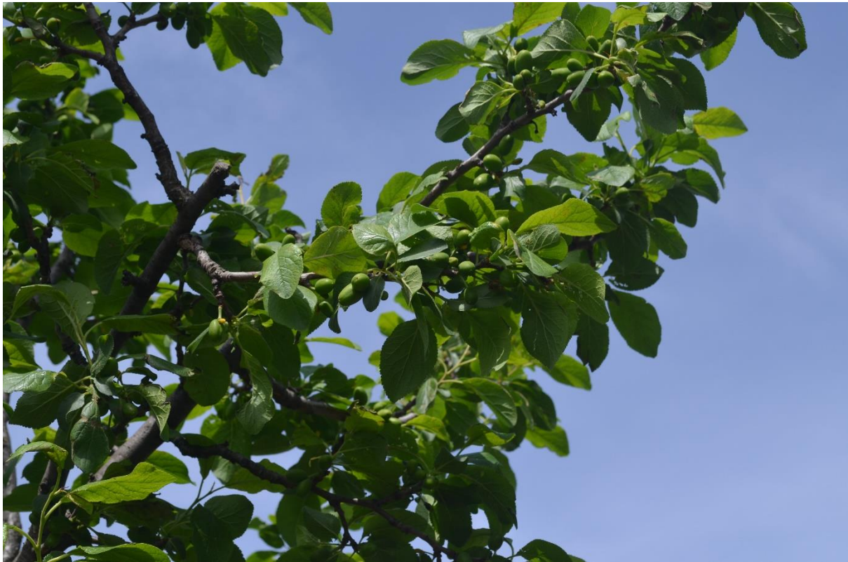
SLIKA1-FAZA RAZVOJA ŠLJIVA

NA PODRUČJU VOJVODINE ŠLJIVE SE NALAZE U FENOFAZI OD DRUGOG OPADANJA PLODOVA DO PLODOVI OKO POLOVINE KRAJNJE VELIČINE.