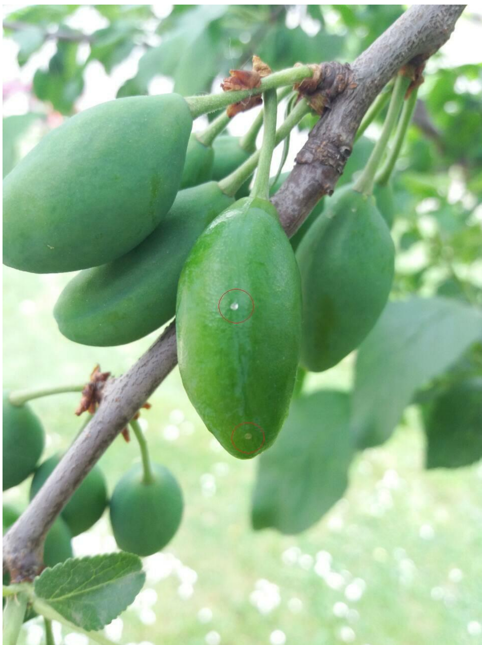
SLIKA 2. POLOŽENA JAJA ŠLJIVINOG SMOTAVCA NA PLODU