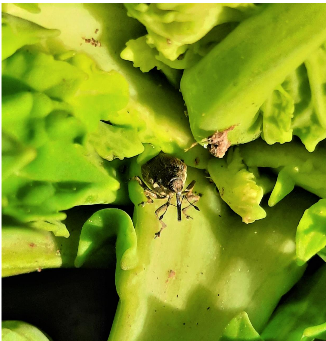
SLIKA 2. VELIKA REPIČINA PIPA