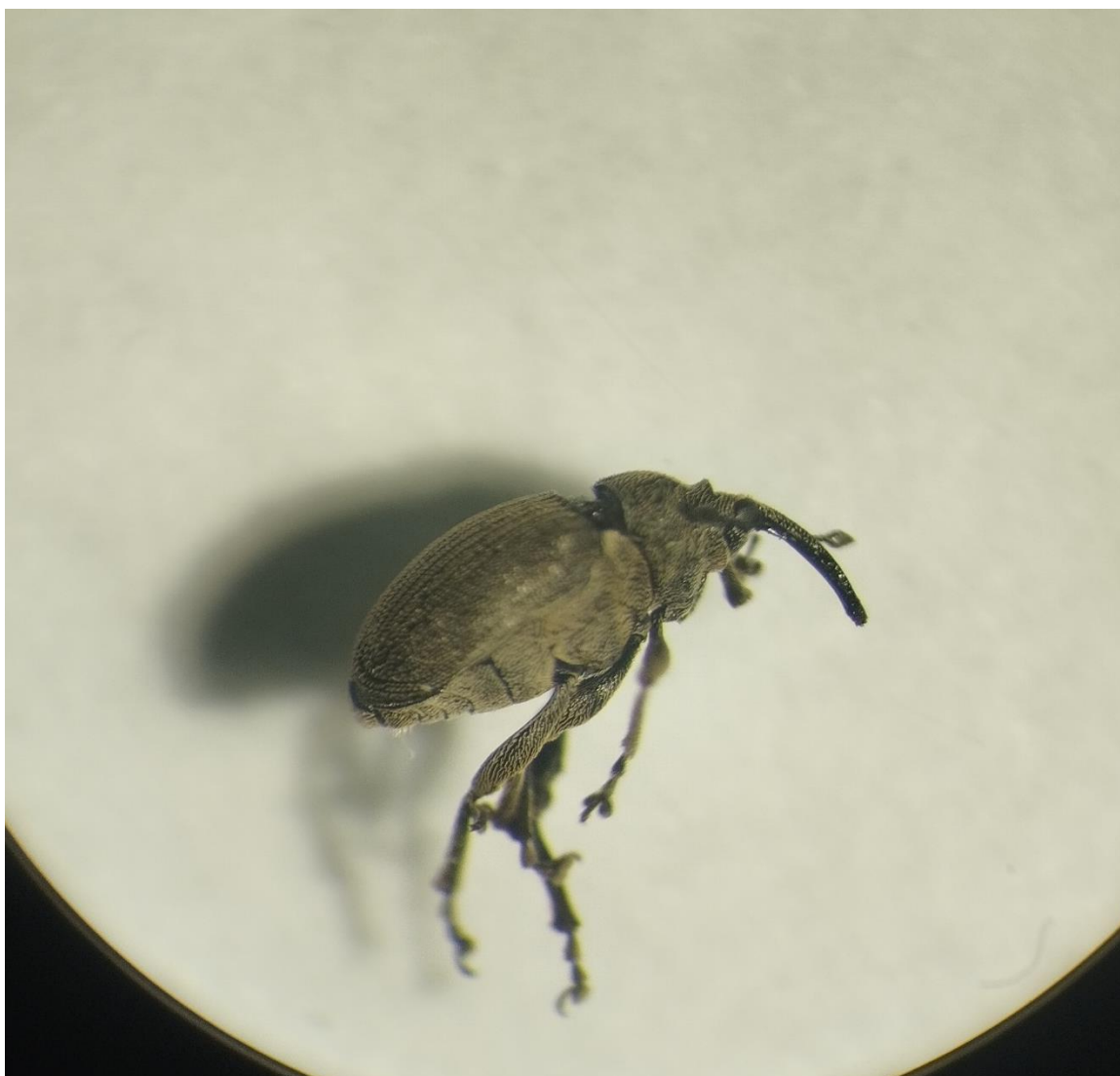
SLIKA 1. VELIKA REPIČINA PIPA