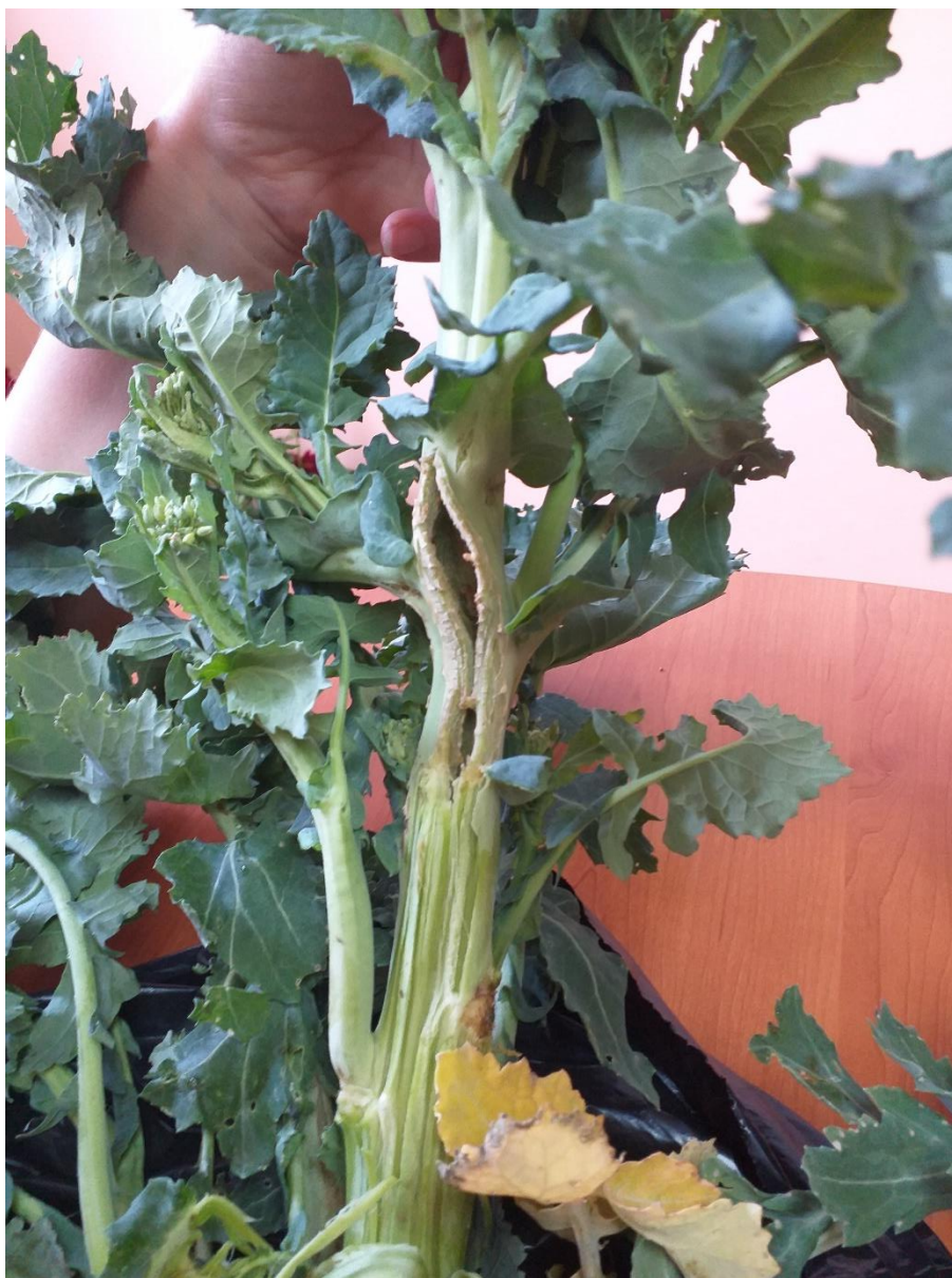
SLIKA 7. PUCANJE STABLA ULJANE REPICE KAO POSLEDICA NAPADA REPIČINE PIPE