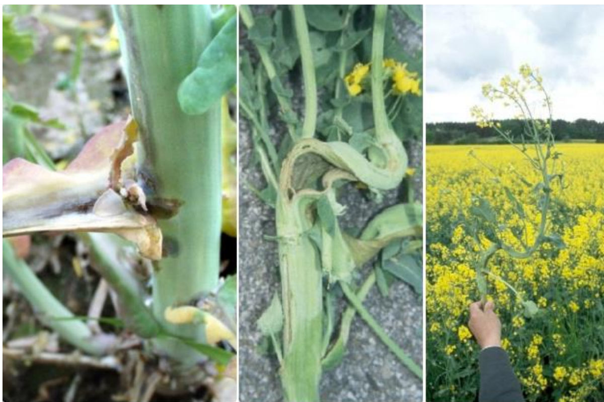
SLIKA 6. ŠTETE OD REPIČINIPIH PIPA