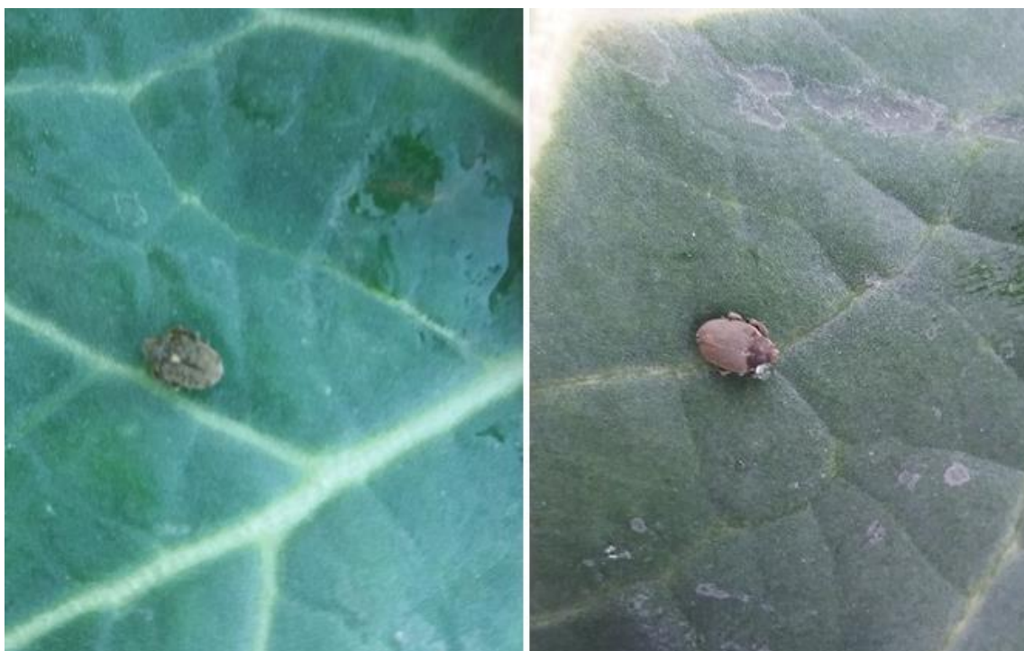
SLIKA 5. MALA I VELIKA REPIČINA PIPA