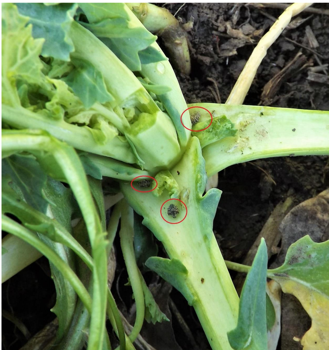
SLIKA 2. ODRASLE JEDINKE MALE REPIČINE PIPE