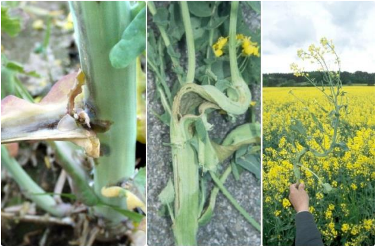
SLIKA 6. ŠTETE OD REPIČINIH PIPA

ŠTETE OD REPIČINIH PIPA U USEVIMA ULJANE REPICE NASTAJU PRILIKOM PROCESA POLAGANJA JAJA, A KASNIJE I USLED ISHRANE LARVI UNUTAR STABLA I LISNIH DRŠKI. NA MESTIMA POLAGANJA JAJA DOLAZI DO PUCANJA TKIVA, A KASNIJE I DO UVIJANJA STABLA ŠTO UTIČE NA SMANJENJE RASTA BILJAKA. NAPADNUTE BILJKE RANIJE SAZREVAJU I PODLOŽNIJE SU POLEGANJU ŠTO SVE OTEŽAVA ŽETVU.