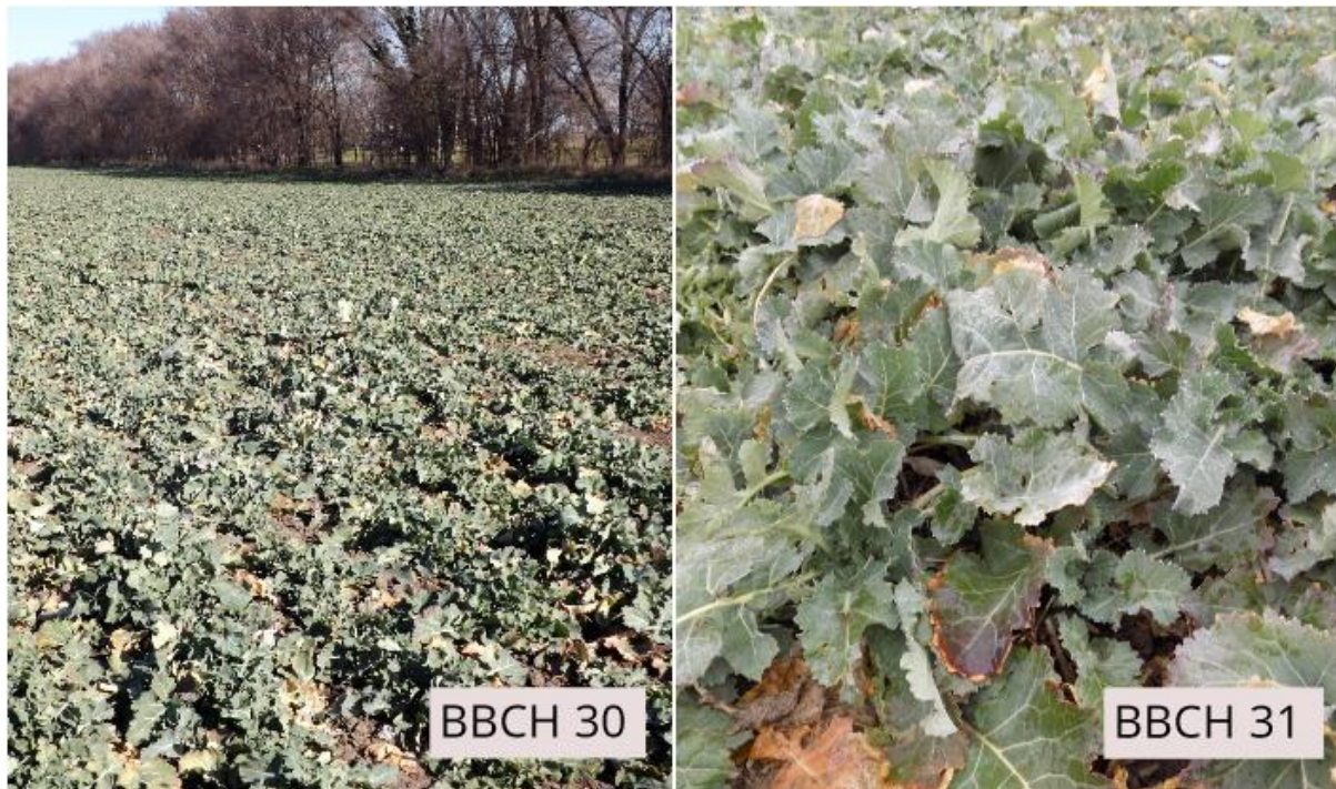
SLIKA 1. FAZE RAZVOJA ULJANE REPICE

NA PODRUČJU VOJVODINE USEVI ULJANE REPICE SE NALAZE U FAZI POČETAK PORASTA STABLA.