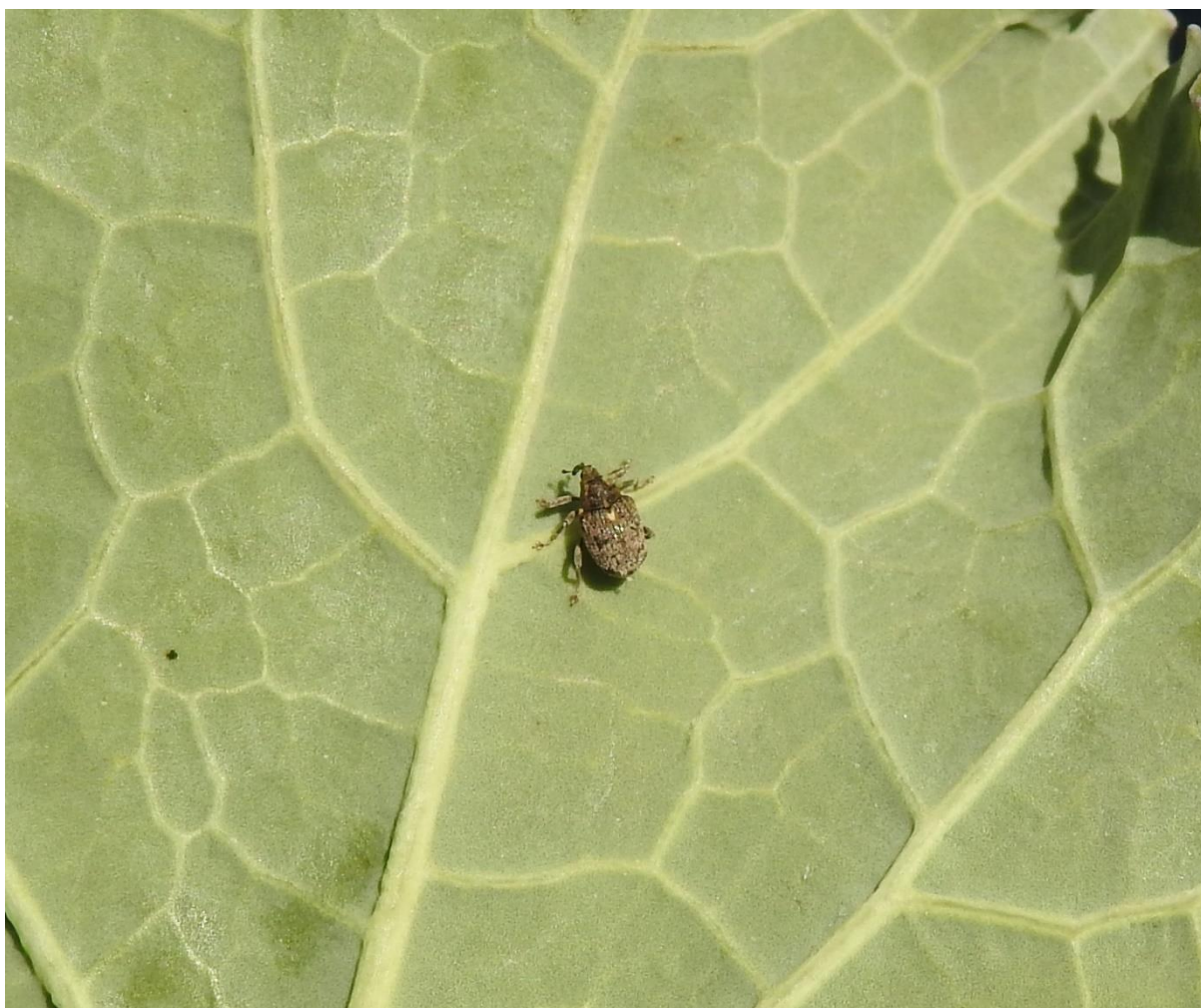
SLIKA 3. MALA REPIČINA PIPA