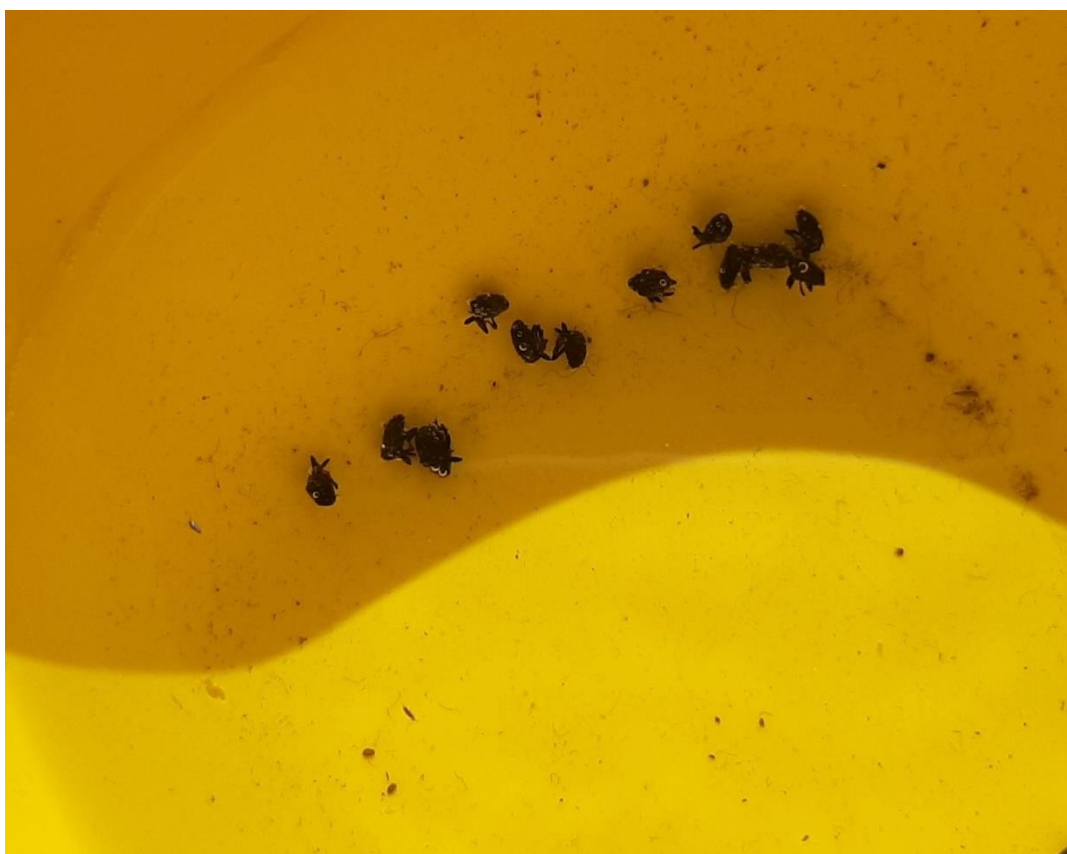
SLIKA 5. ULOVI REPIČINIPIH PIPA U LOVNOJ KLOPCI