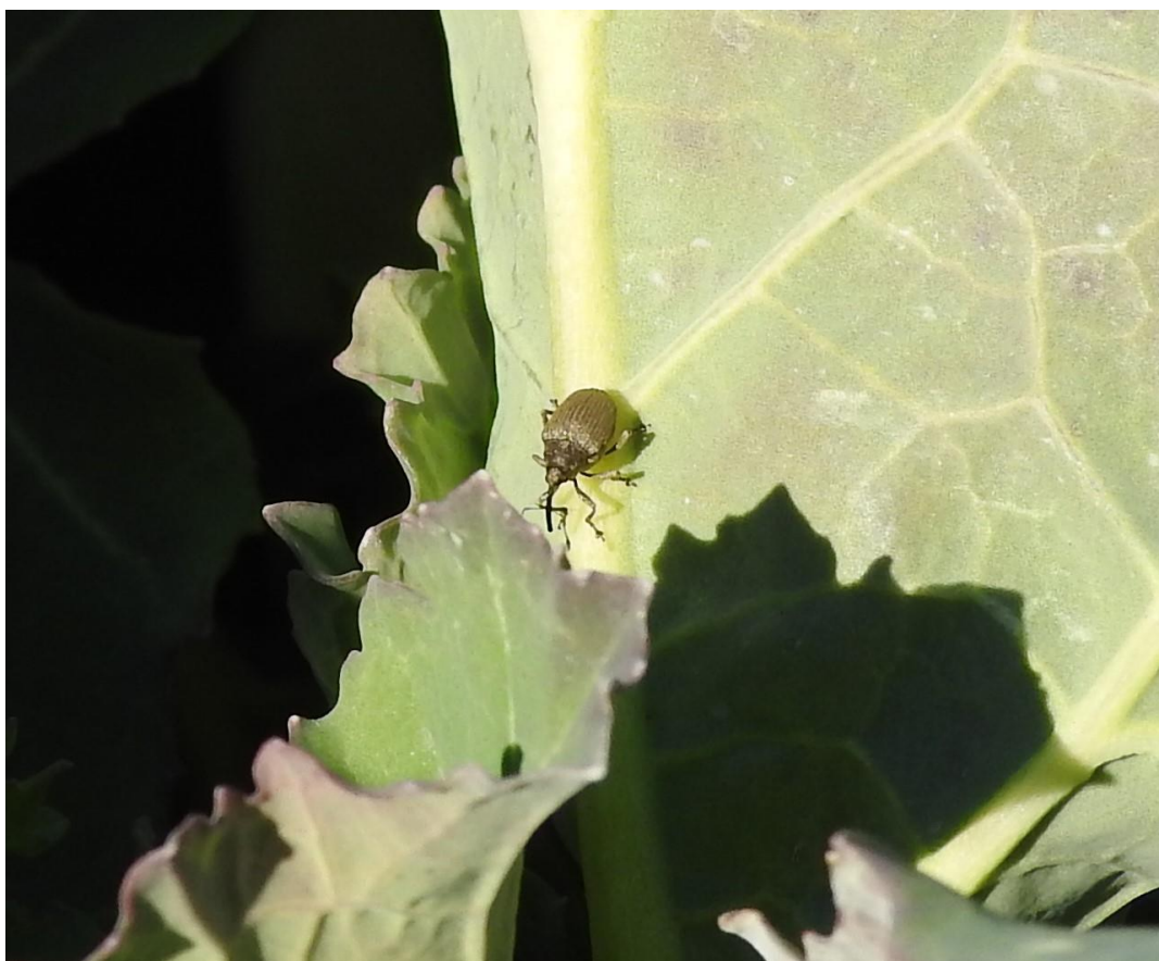
SLIKA 4. VELIKA REPIČINA PIPA