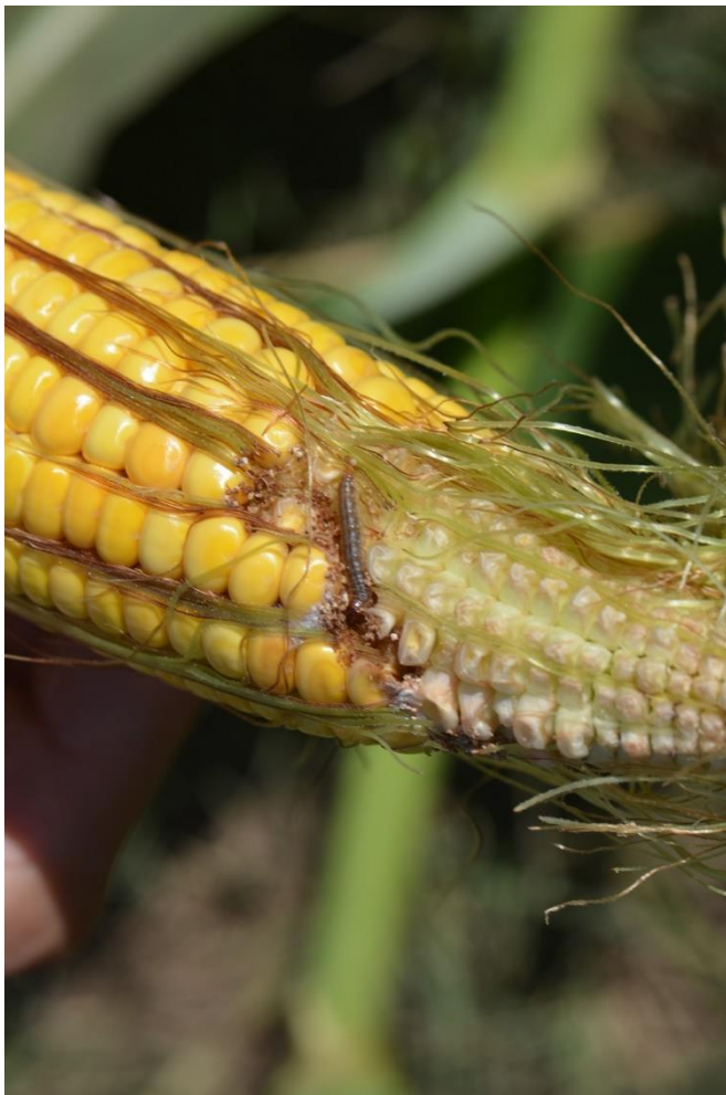
SLIKA 1. LARVA K.PLAMENCA NA KLIPU KUKURUZA

PORED DIREKTNIH ŠTETA KOJE PRAVE LARVE HRANEĆI SE UNUTAR STABLA I NA KLIPOVIMA KUKURUZA UZROKUJUĆI SMANJENJE PRINOSA, ZNAČAJNE SU I INDIREKTNE ŠTETE JER NA MESTIMA ISHRANE LARVI DOLAZI DO INFEKCIJE RAZNIM VRSTAMA GLJIVA KOJE IMAJU SPOSOBNOST SINTEZE MIKOTOKSINA. NA PAPRICI LARVE SE UBUŠUJU U PLODOVE KOJI SU PODLOŽNI TRULJENJU I GUBE TRŽIŠNU VREDNOST.