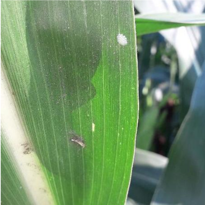
SLIKA 3. JAJNO LEGLO KUKURUZNOG PLAMENCA NA LISTU KUKURUZA