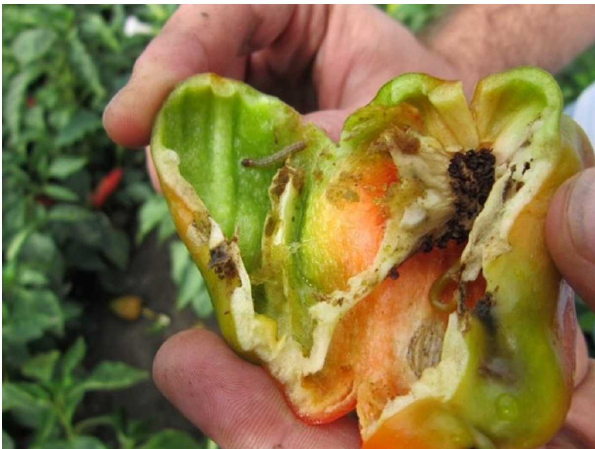
SLIKA 2. LARVA K.PLAMENCA U PLODU PAPRIKE

VIZUELNIM PREGLEDIMA USEVA KUKURUZA I PAPRIKE REGISTRUJU SE NOVOPOLOŽENA JAJNA LEGLA KUKURUZNOG PLAMENCA. AKTIVNOST DRUGE GENERACIJE JE JOŠ UVEK VISOKA. NA PODRUČJU VOJVODINE, NA SVETLOSNIM LOVNIM LAMPAMA, BELEŽE SE IZUZETNO VELIKE BROJNOSTI ODRASLIH JEDINKI KOJI SE KREĆU I DO 1000 LEPTIRA DNEVNO.