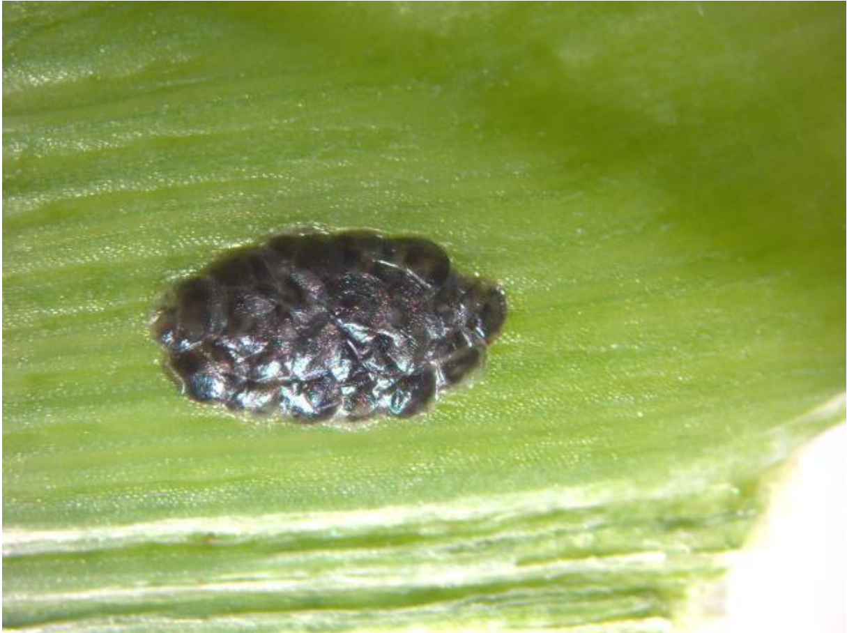
SLIKA 7. PARAZITIRANO - CRNO JAJNO LEGLO KUKURUZNOG PLAMENCA