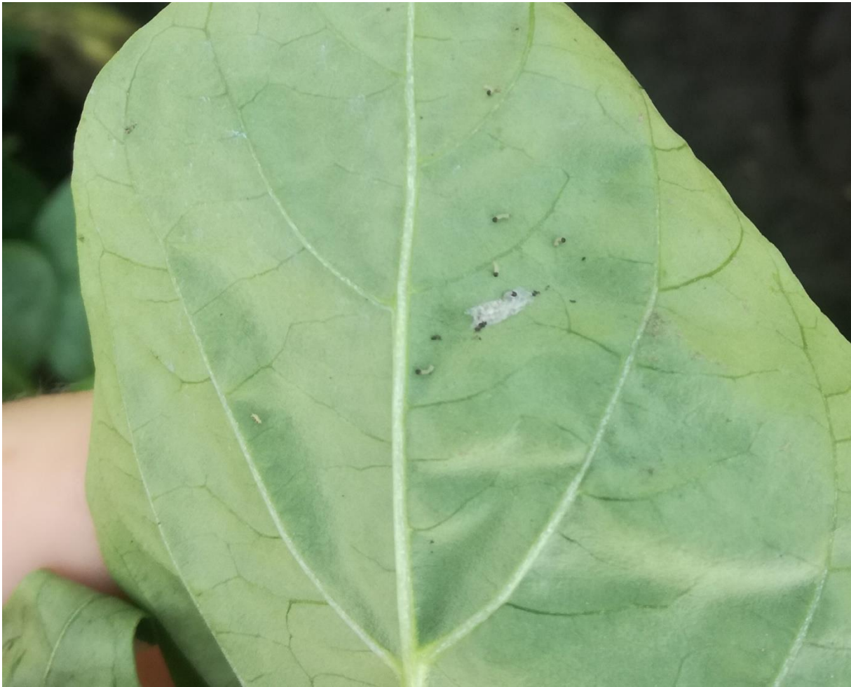
SLIKA 5. ISPILJENE LARVE KUKURUZNOG PLAMENCA NA LISTU PAPRIKE