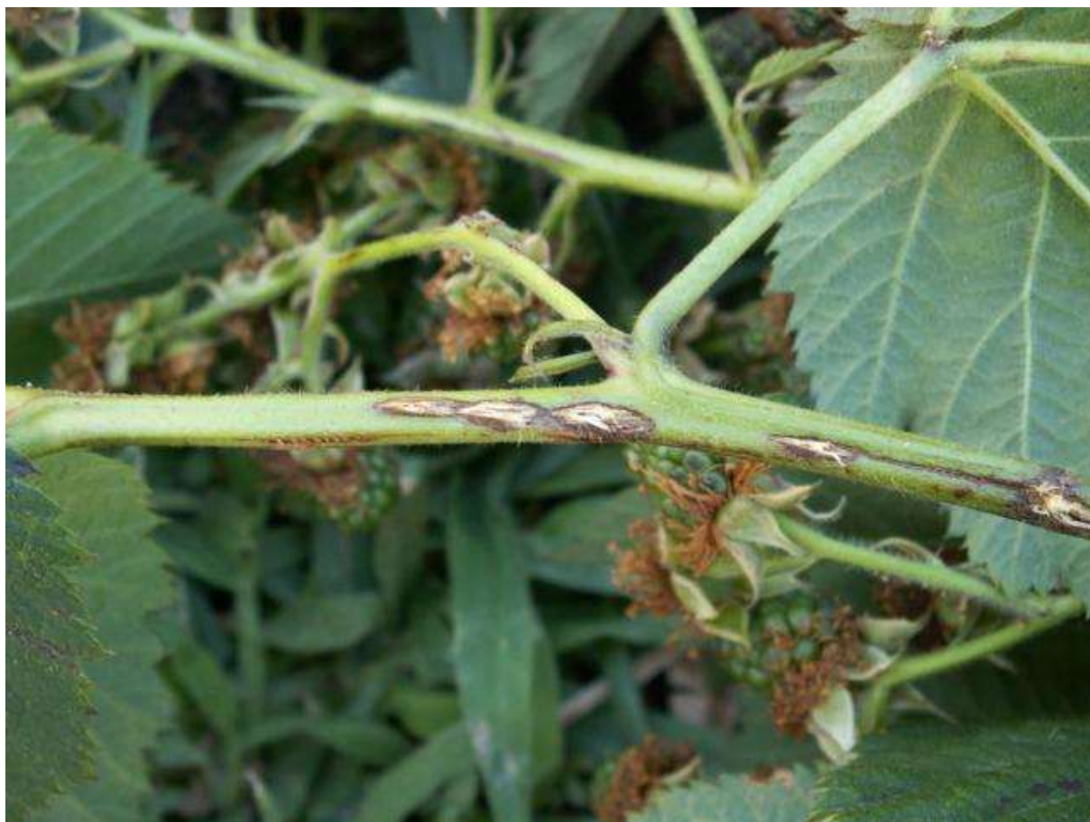
SLIKA 1. OŠTEĆENJA NA GRANI

PREGLEDIMA ZASADA MALINA I KUPINA MOGU SE REGISTRovati OŠTEĆENJA NA GRANČICAMA. OŠTEĆENJA SE U VIDU POKIDANE POVRŠINE ODNOSNO KORE GRANČICA, U VIDU ZAREZA. NA JEDNOJ GRANČICI MOŽE SE REGISTRovati I VIŠE ZAREZA. NA ZAREZIMA KOJI SU VIDLJIVI NA GRANČICAMA DOLAZI DO NJIHOVOG LOMLJENJA I SUŠENJA GRANE.