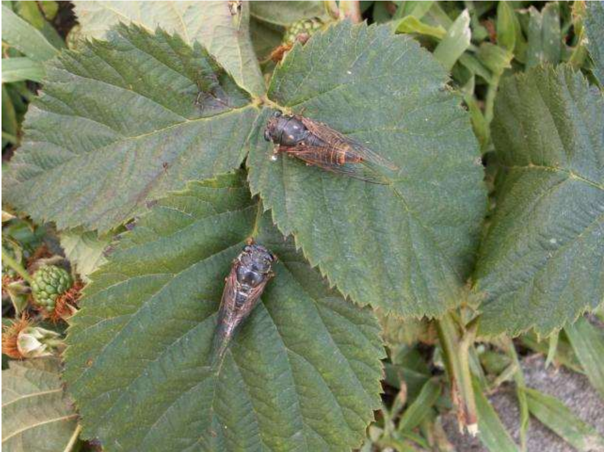
SLIKA 3. ODRASLE JEDINKE CIKADA

U OKVIRU OVE GRUPE DETEKTOVANO JE VIŠE RAZLIČITIH CIKADA, ALI SVE PRIPADAJU GRUPI CICADETTA MONTANA ( CICADETTA MONTANA COMPLEX ).