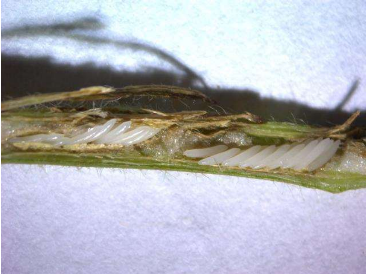
SLIKA 4. SVEŽE POLOŽENA JAJA CIKADE