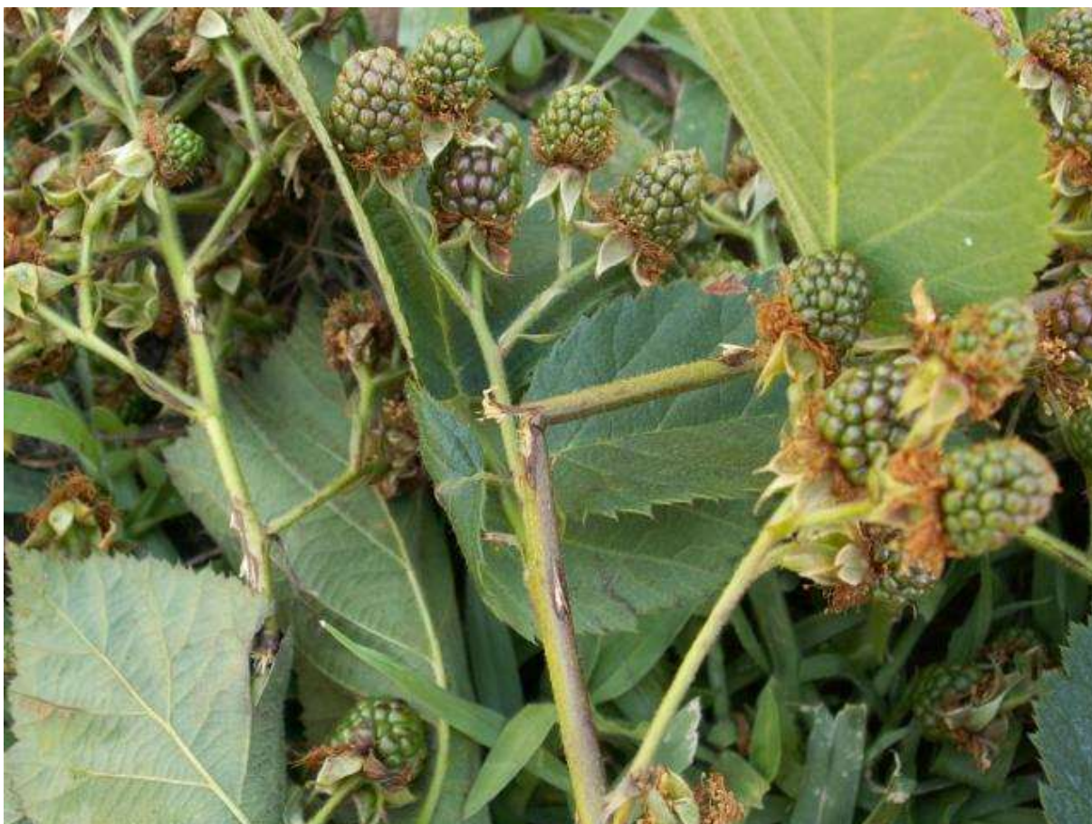
SLIKA 2. OŠTEĆENJA NA GRANI I PUCANJE GRANE

MONITORINGOM ZASADA DETEKTOVANO JE PRISUSTVO CIKADE ( CICADETTA MONTANA )