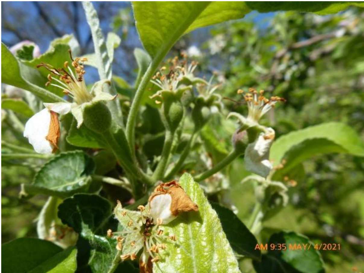
SLIKA 1: FAZA RAZVOJA JABUKA

NA PODRUČJU VOJVODINE ZASADI JABUKA SE NALAZE U FAZI OD PRECVETAVANJA DO FAZE POČETKA RAZVOJA PLODOVA.