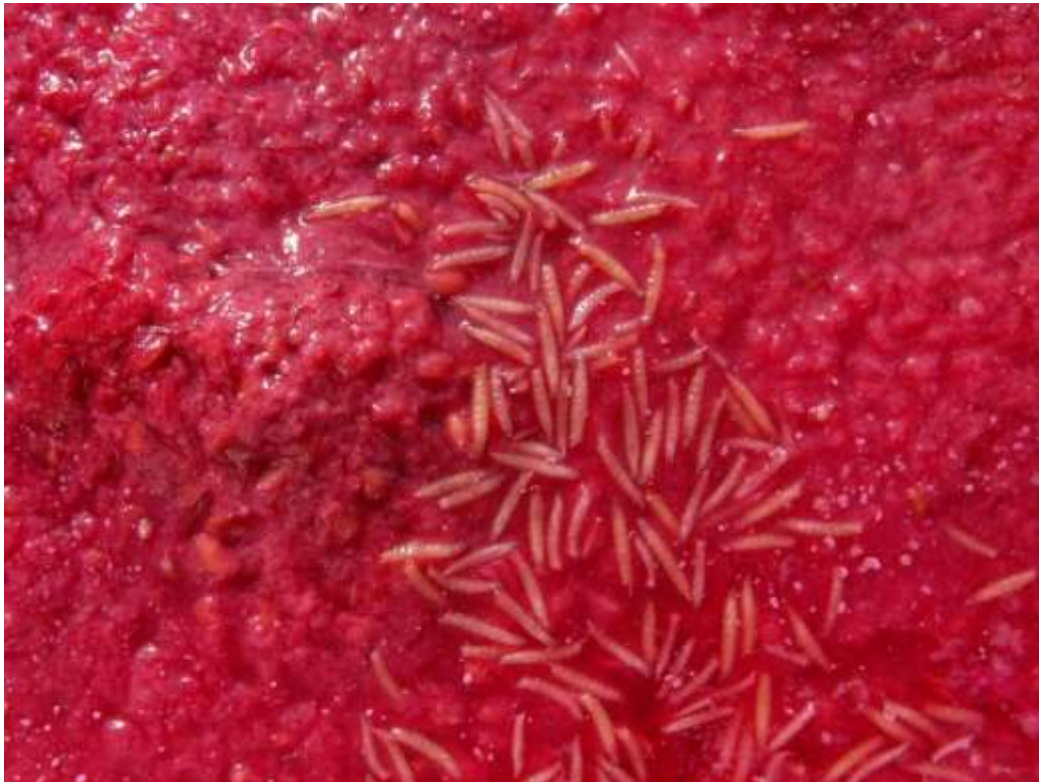
SLIKA 1. KAŠASTI PLODOVI MALINE SA LARVAMA

AZIJSKA VOĆNA MUŠICA JE ŠTETOČINA JAGODIČASTOG VOĆA, KOŠTIČAVOG VOĆA I VINOVE LOZE. BILNE VRSTE NA KOJIMA SE HRANI VOĆNA MUŠICA U OPASNOSTI SU I NAJOSETLJIVIJE SU U VREME ZRENJA. ŠTETE KOJE MOŽE DA IZAZOVE SU I DO 100%. ŽENKE POLAŽU JAJA U ZDRAVE PLODOVE U FAZI ZRENJA. USLED ISHRANE LARVI, PLODOVI POTPUNO PROPADAJU.