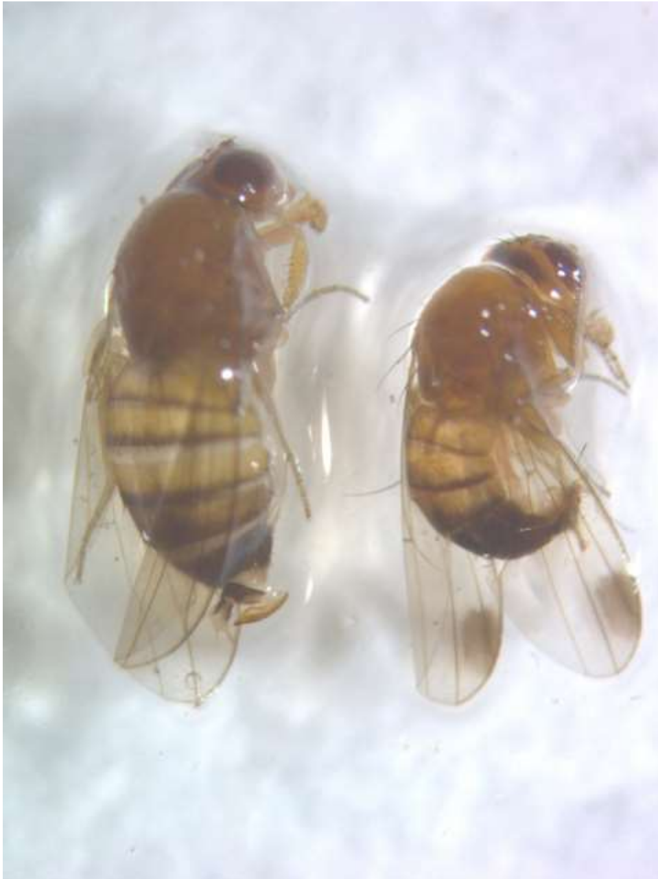
SLIKA 4. ŽENKA I MUŽJAK AZIJSKE VOĆNE MUŠICE

OVAKO RANA POJAVA OVE ŠTETOČINE UKAZUJE NA IZUZETNO VISOK RIZIK PO PROIZVODNJU VOĆA NA NAŠEM PODRUČJU.