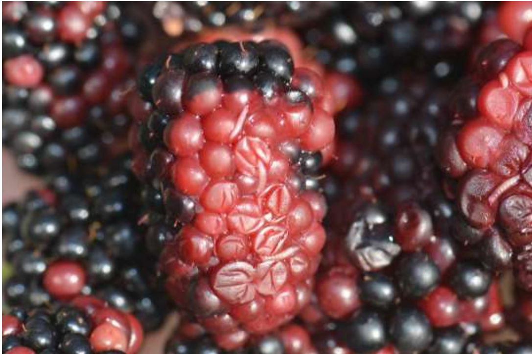
SLIKA 2. LARVE NA PLODOVIMA KUPINE

NA MESTIMA GDE ŽENKA PRAVI ZAREZE PRILIKOM POLAGANJA JAJA OTVARA SE PUT ZA INFEKCIJE RAZLIČITIM VRSTAMA PATOGENA I OVAJ VID ŠTETA NAROČITO JE BIO IZRAŽEN NA GROŽĐU TOKOM PROŠLE GODINE.