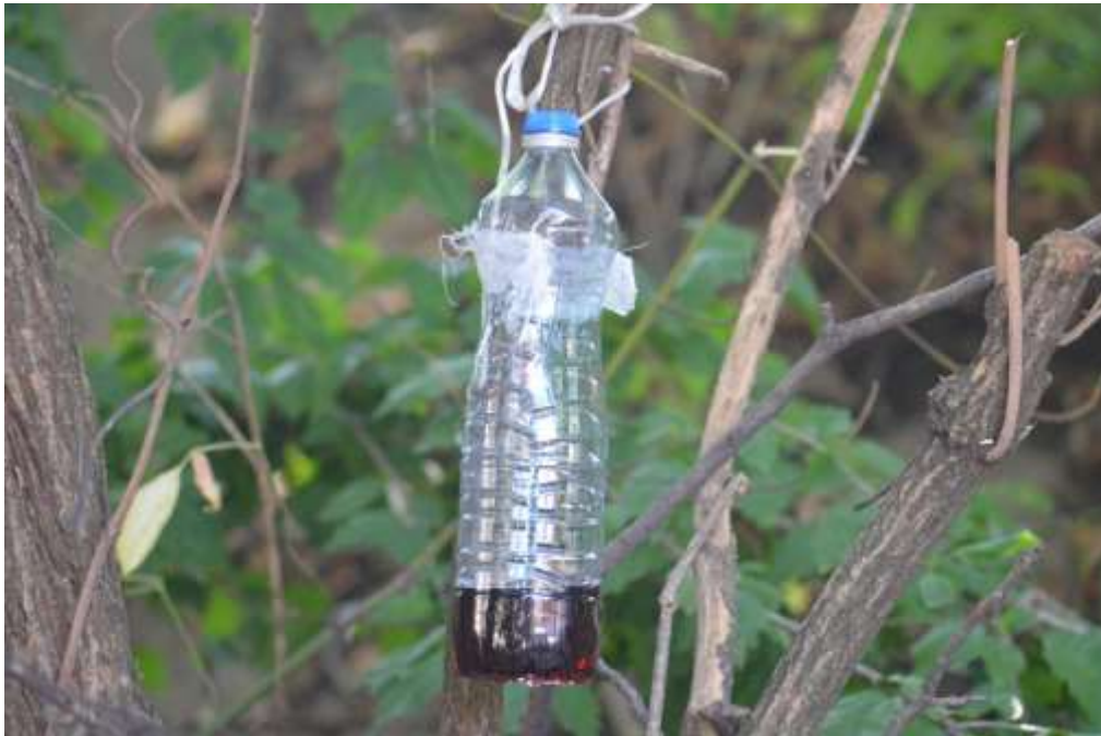
SLIKA 5. KLOPKA ZA AZIJSKU VOĆNU MUŠICU