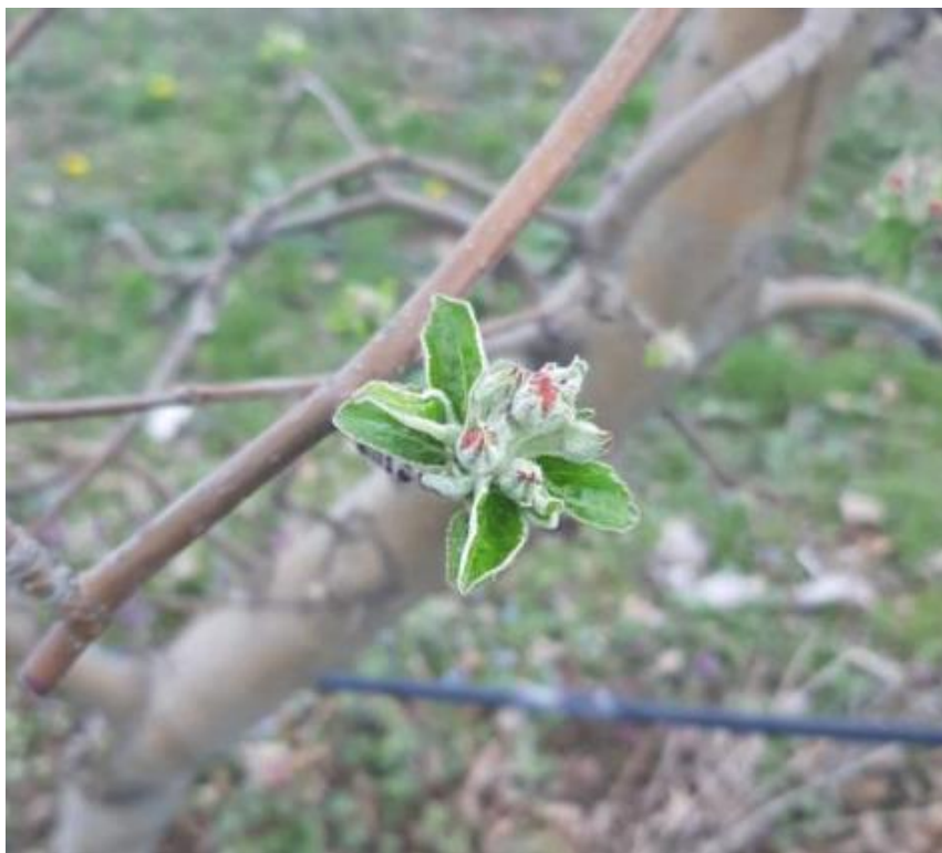
SLIKA 1. FAZA RAZVOJA JABUKE