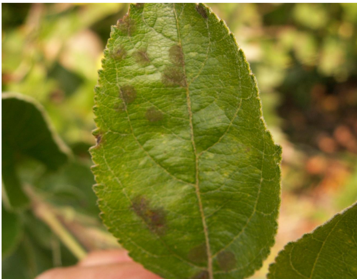
SLIKA 3. SIMPTOM ČAĐAVE PEGAVOSTI NA LISTU JABUKE