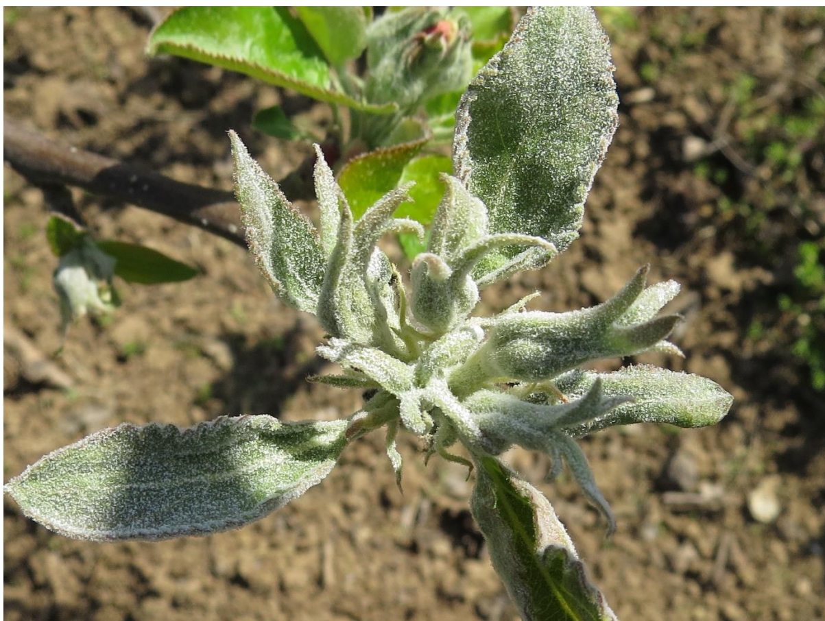
SLIKA 5. PEPLNICA JABUKE

..... POŠTOVANI POLJOPRIVREDNI PROIZVOĐAČI I POŠTOVANI GLEDAOCI, DETALJNIJE INFORMACIJE O POJAVI ŠTETNIH ORGANIZAMA I MERAMA KONTROLE MOŽETE POGLEDATI NA SAJTU PROGNOZNO IZVEŠTAJNE SLUŽBE ZAŠTITE BILJA VOJVODINE WWW.PISVOJVODINA.COM