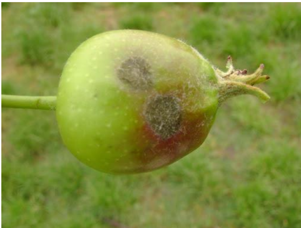
SLIKA 4. SIMPTOM ČAĐAVE KRSTAVOSTI NA PLODU