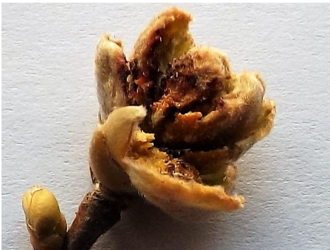
SLIKA 5. ZARAŽENI PUPOLJAK LESKE