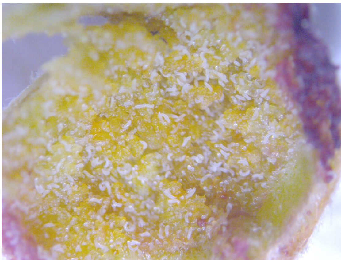
SLIKA 6. LARVE LESKINE GRINJE UNUTAR PUPOLJAKA