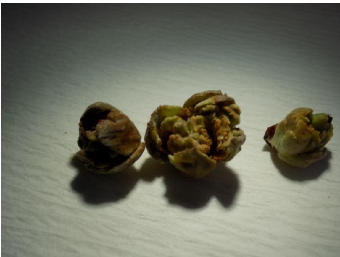
SLIKA 4. ZARAŽENI PUPOLJCI LESKE