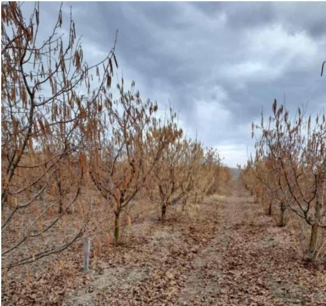
SLIKA 1. ZASAD LESKE

NA PODRUČJU VOJVODINE ZASADI LESKE SE, U ZAVISNOSTI OD SORTIMENTA I LOKALITETA, NALAZE U FAZI OD KRAJA CVETANJA DO PUCANJA LISNIH PUPOLJAKA.