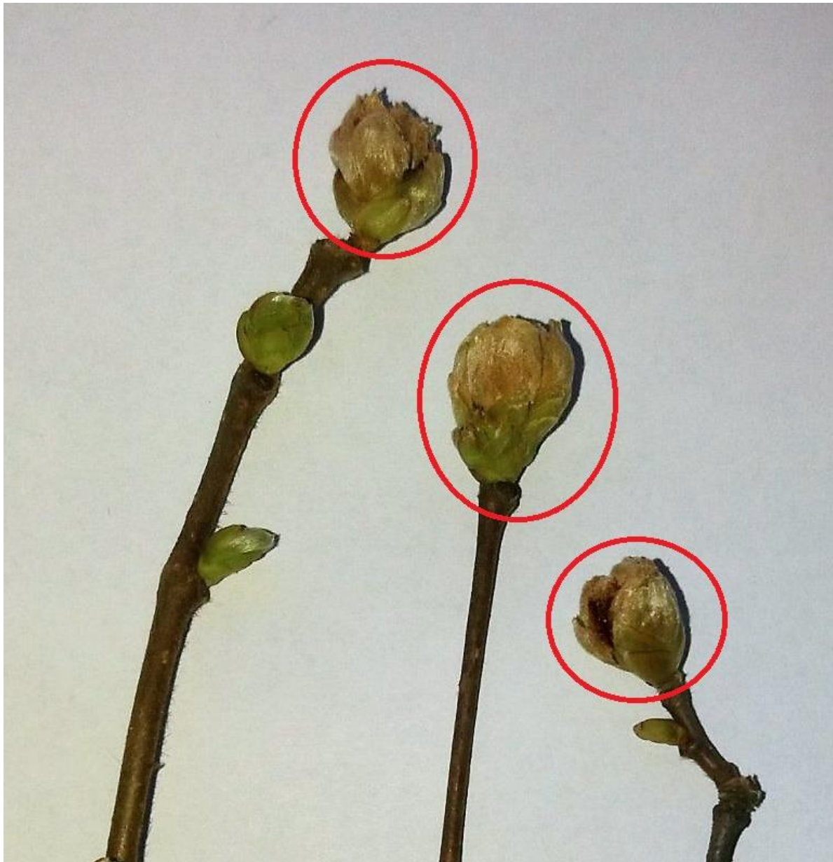
SLIKA 2. ZARAŽENI PUPOLJCI LESKE

TRENUTNO SE UNUTAR PUPOLJAKA REGISTRUJE PRISUSTVO LARVI KOJE SU ZAPETASTOG OBLIKA I IZRAZITO SITNIH DIMENZIJA, MANJE SU OD JEDNOG MILIMETRA.