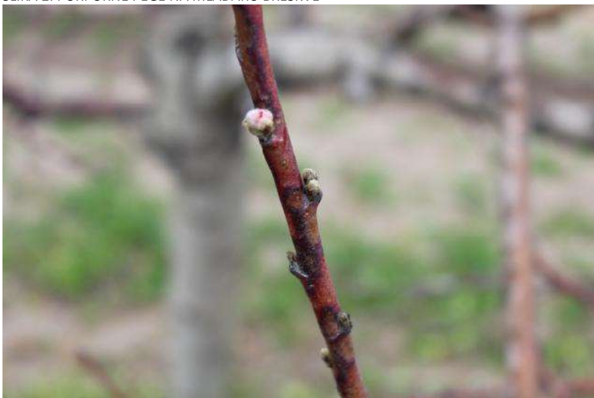
SLIKA 3. RAK RANE NA MLADARU BRESKVE