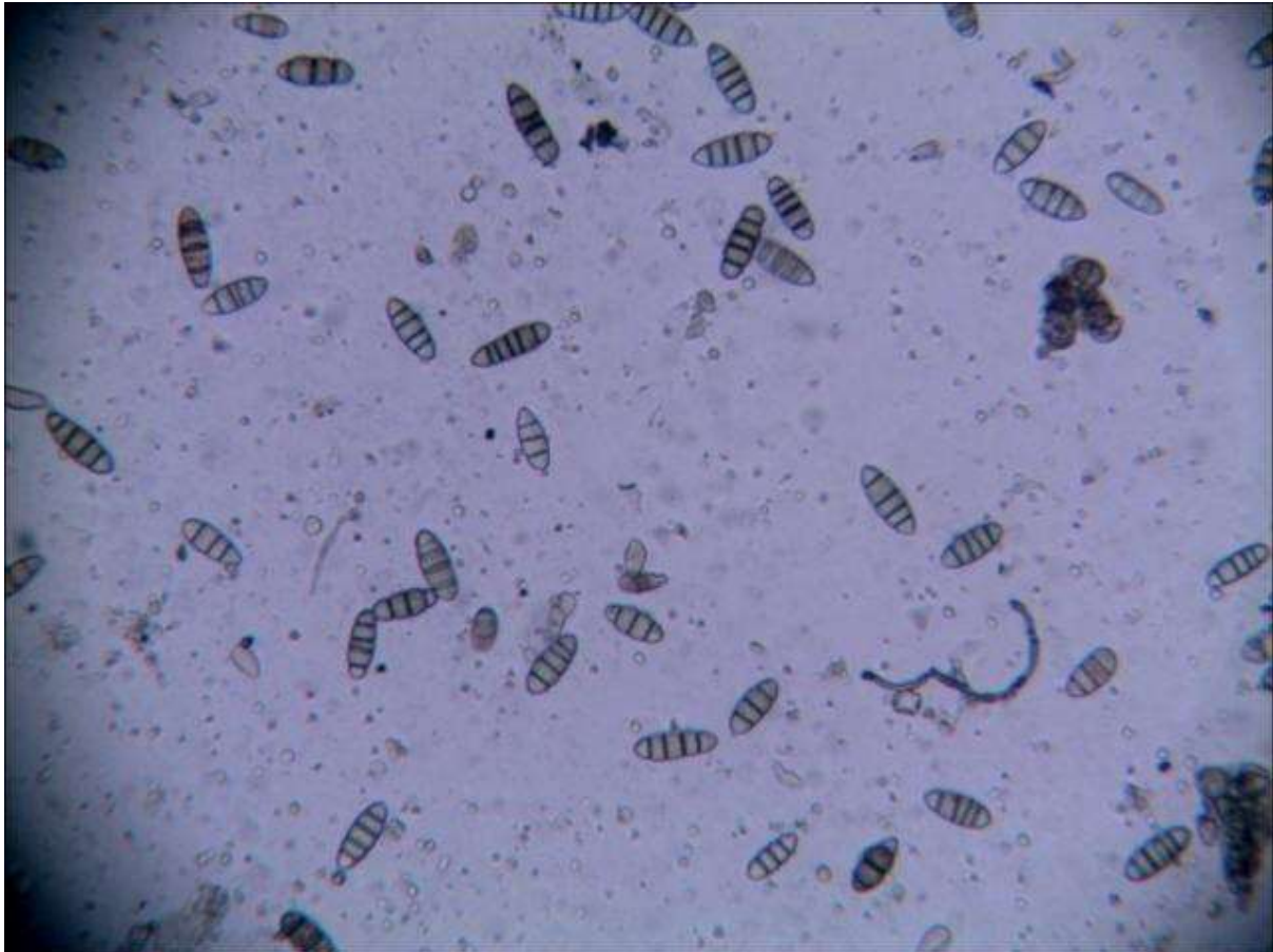
SLIKA 4. KONIDIJE Stigmina carpophila

GLJIVA PREZIMLJAVA U RAK RANAMA I U VLAŽNIM USLOVIMA FORMIRA OBILJE KONIDIJA KOJE SE RASEJAVAJU KIŠNIM KAPIMA. INFEKCIJA SE DEŠAVA U ŠIROKOM TEMPERATURNOM INTERVALU UZ PRISUSTVO VLAGE. OPTIMALNE TEMPARTURE SU OD 18-21°C, TAKO DA SU TRENUTNI USLOVI VEOMA POVOLJNI ZA RAZVOJ OVOG PATOGENA.