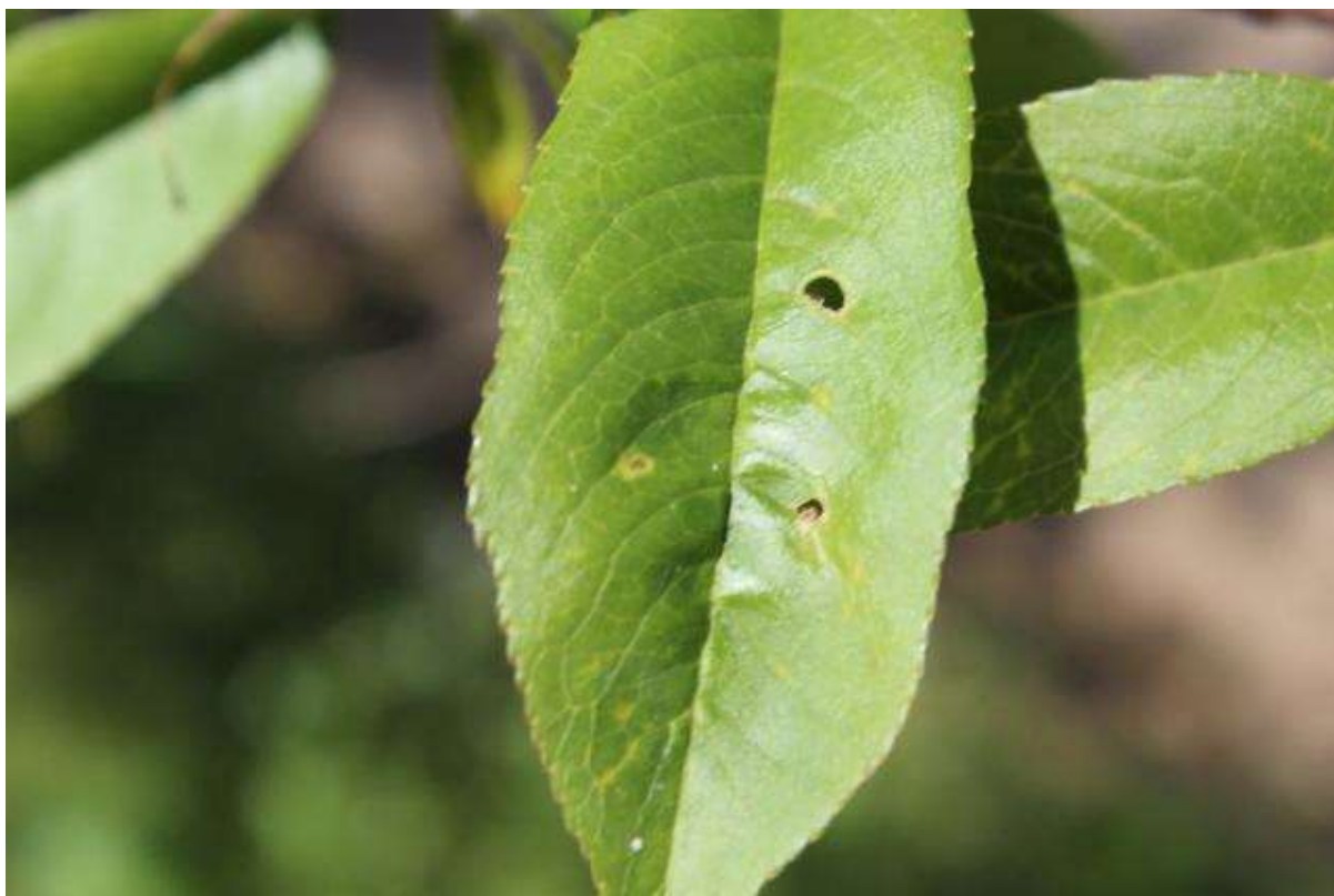
SLIKA 1. SIMPTOM ŠUPLJIKAVOSTI NA LISTU BRESKVE (fotografija iz prethodne sezone)

NA PLODOVIMA SE JAVLJAJU NERAVNE, PLUTASTE PEGE KOJE LIČE NA KRASTE ILI BRADAVICE ŠTO UMANJUJE NJIHOV KVALITET.