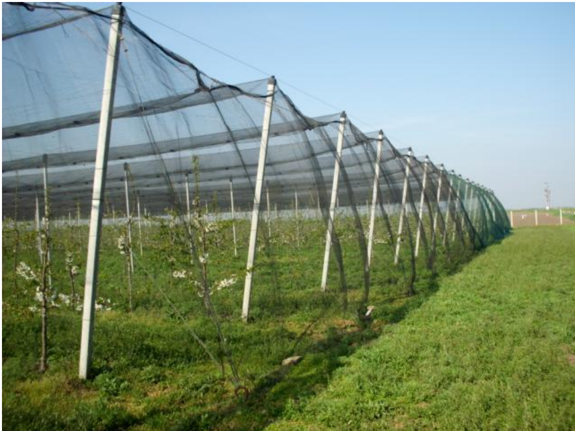
SLIKA 10. ZATVORENA MREŽA NA VOĆNJAKU