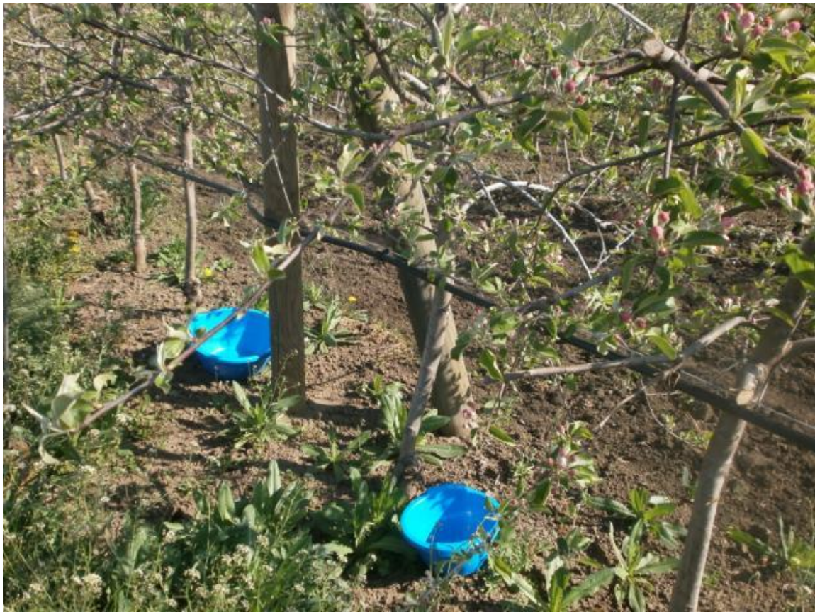
SLIKA 7. PLAVE POSUDE ZA IZLOVLJAVANJE RUTAVE BUBE