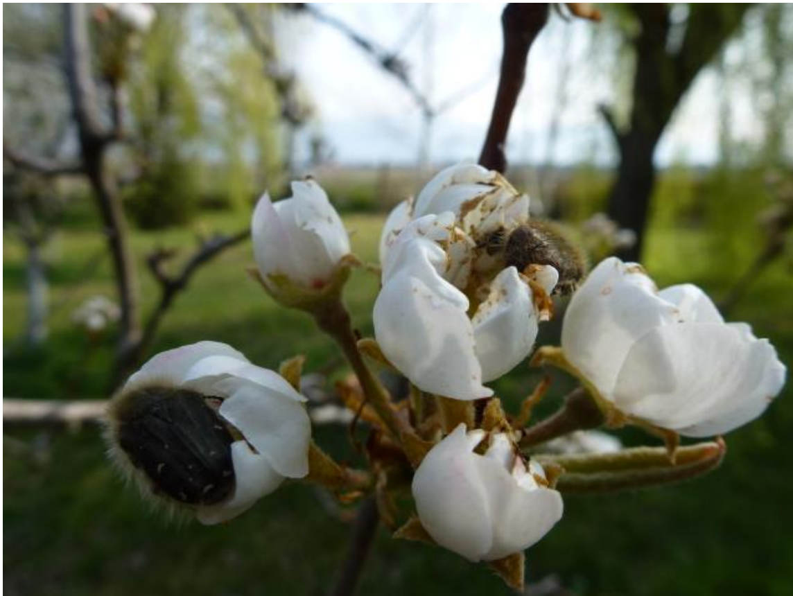
SLIKA 5. RUTAVA BUBA NA CVETU KRUŠKE