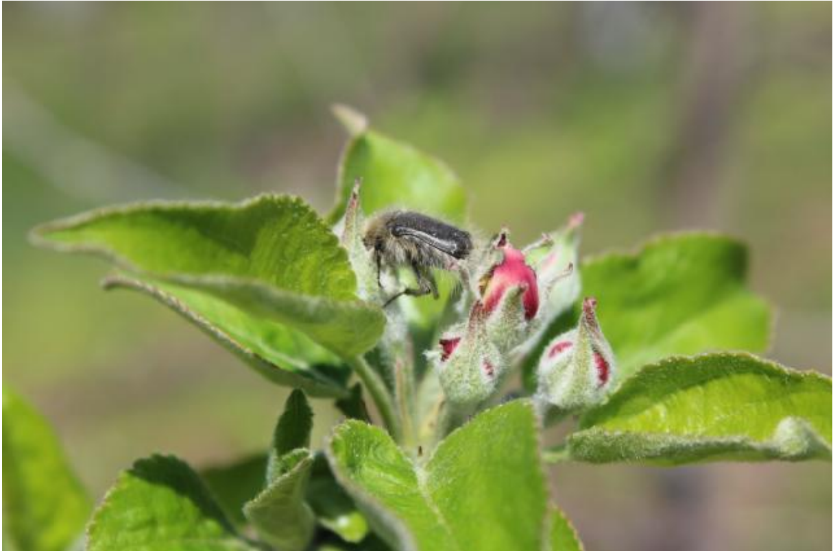
SLIKA 2. RUTAVA BUBA NA PUPOLJKU JABUKE