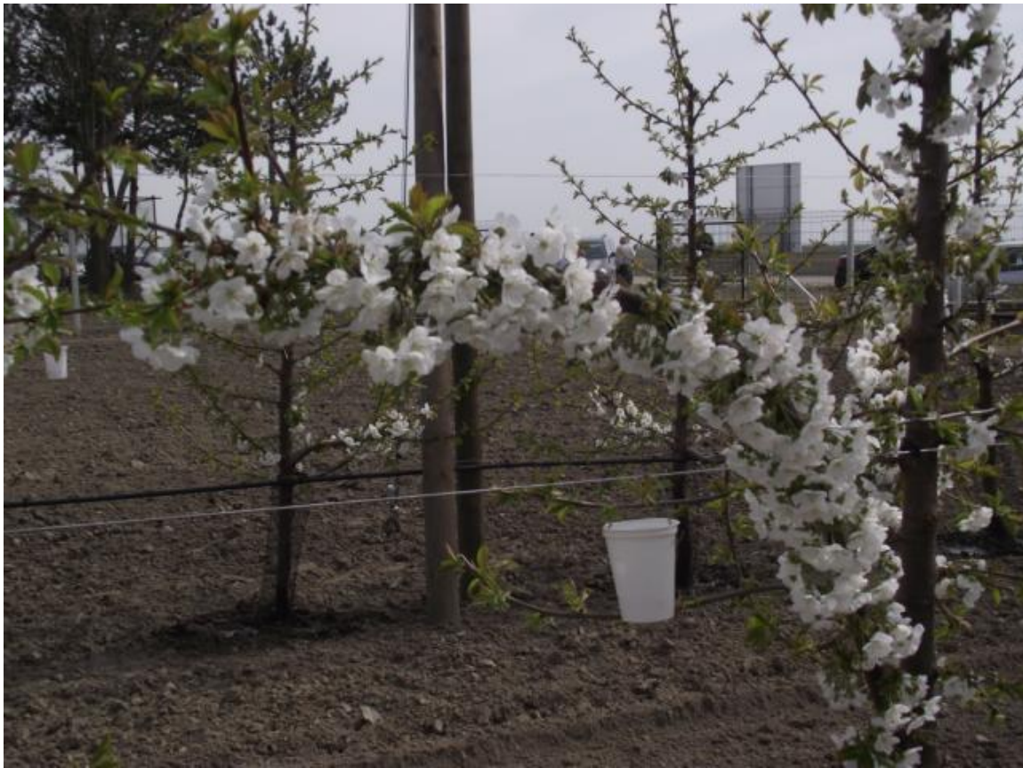
SLIKA 9. BELA POSUDA ZA IZLOVLJAVANJE RUTAVE BUBE