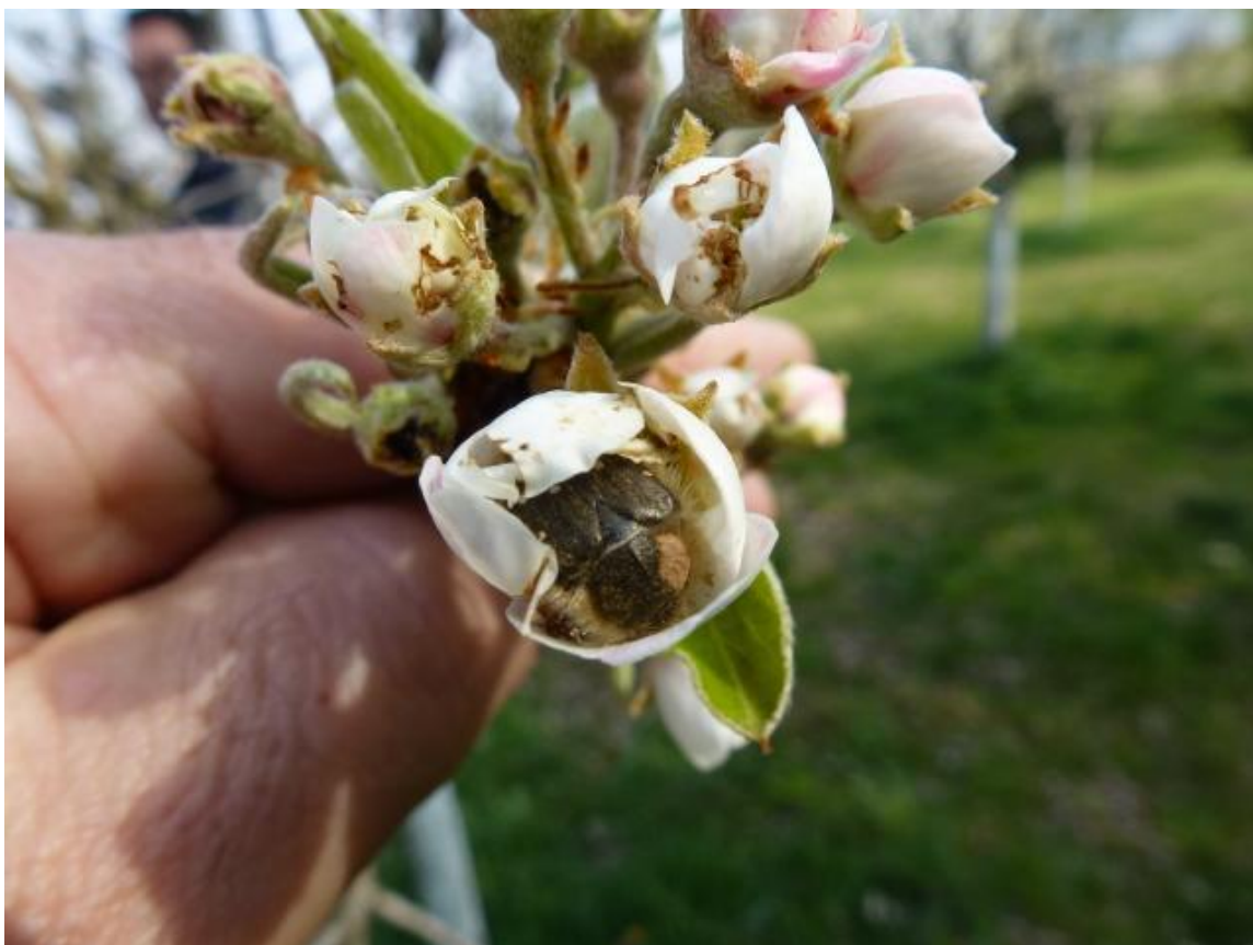
SLIKA 4. RUTAVA BUBA NA CVETU KRUŠKE