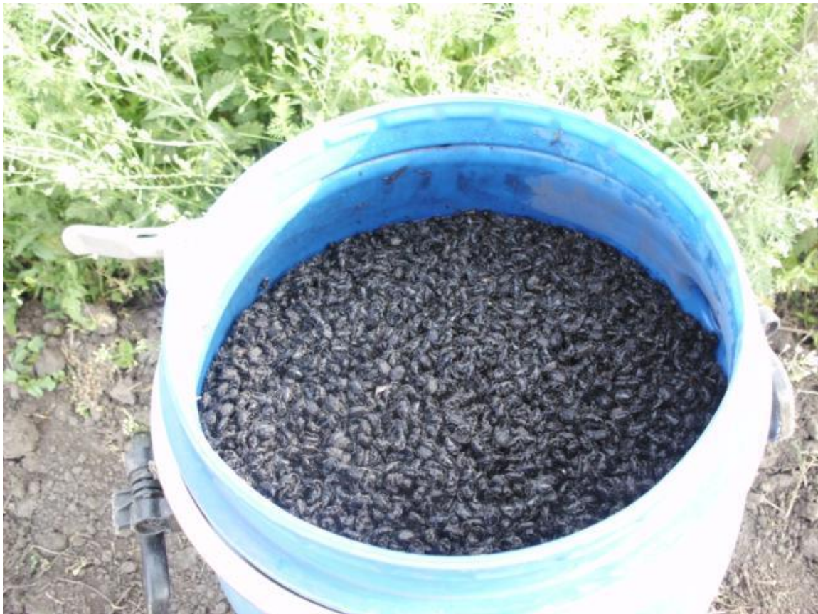
SLIKA 8. PLAVO BURE SA ULOVLJENOM RUTAVOM BUBOM