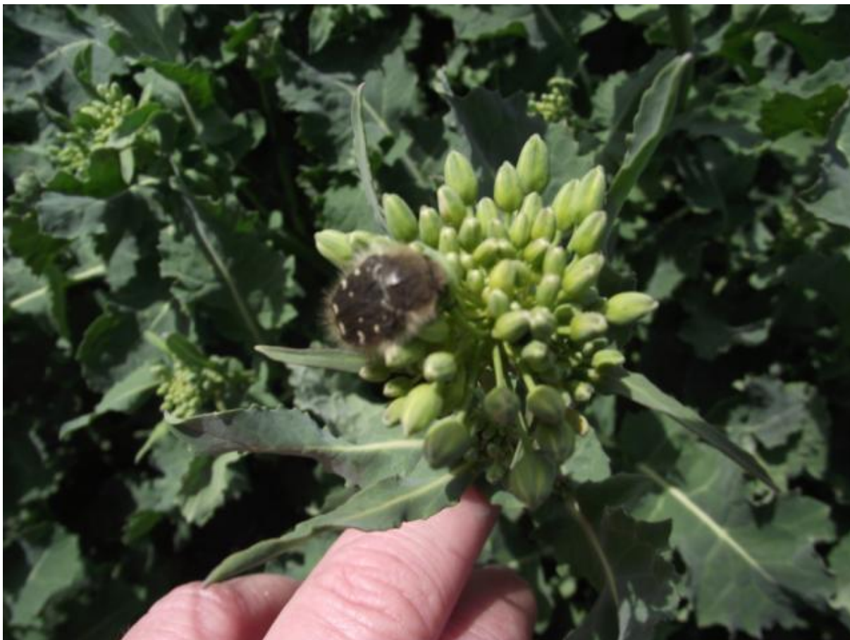
SLIKA 6. RUTAVA BUBA NA CVASTI ULJANE REPICE