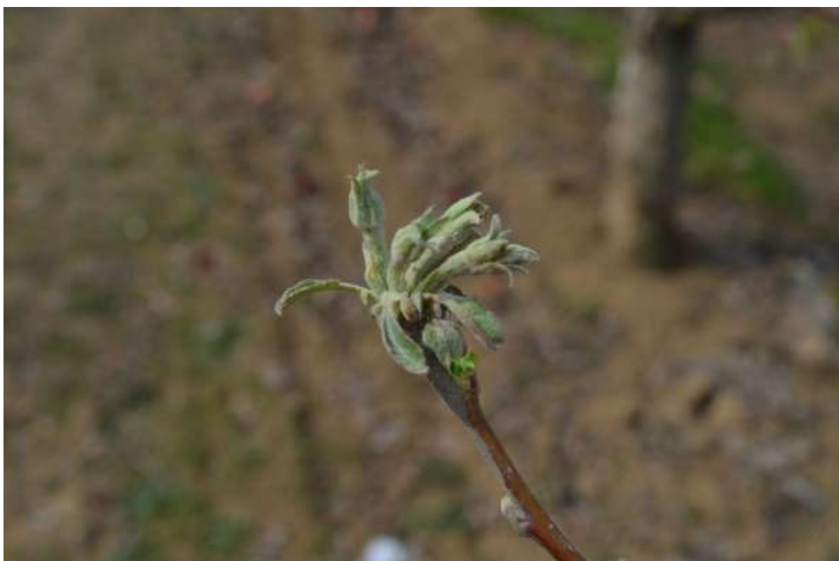
SLIKA 5. SIMPTOM PEPELNICE JABUKE

PEPELNICA JABUKE SE REDOVNO JAVLJA U NAŠIM USLOVIMA NAROČITO KOD OSETLJIVIH SORTI KAO ŠTO SU AJDARED, JONAGOLD, RED JONAPRINCE I DR. ŠTETE OD PEPELNICE MOGU BITI VEOMA VELIKE, DOLAZI DO NEKROZE I SUŠENJA LIŠĆA I CVASTI, SUŠENJA LASTARA, ŠTO SVE DOVODI DO SMANJENJA RODNOSTI U NAREDNOJ GODINI. PLODOVI MOGU BITI DIREKTNO OŠTEĆENI, A PRE SVEGA JE UMANJEN NJIHOV KVALITET. OVAJ PATOGEN PREZIMLJAVA U OBLIKU MICELIJE U PUPOLJCIMA. KONIDIJE SE FORMIRAJU NA LASTARIMA FORMIRANIM IZ PRIMARNO ZARAŽENIH PUPOLJAKA.