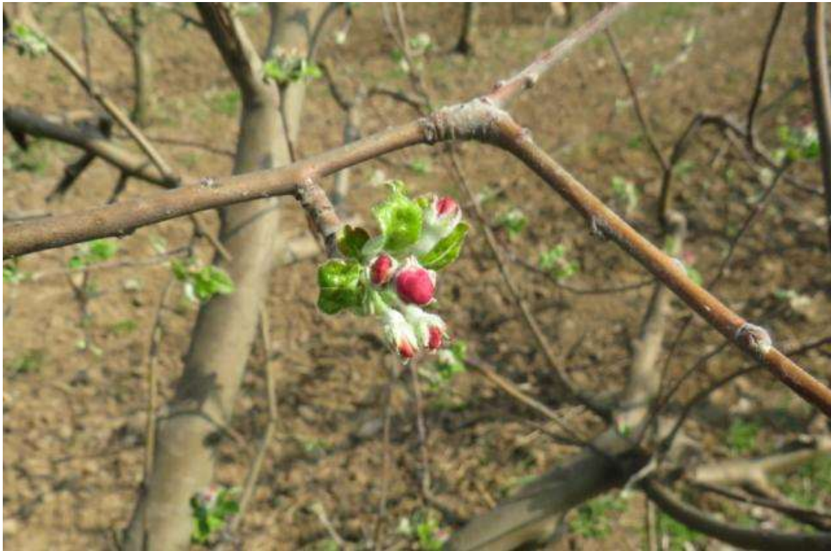
SLIKA 1. FAZA RAZVOJA JABUKE

NA PODRUČJU VOJVODINE U ZAVISNOSTI OD LOKALITETA I SORTIMENTA JABUKE SE NALAZE U FAZI OD RAZVOJA CVETNIH PUPOLJAKA DO PRVI CVETOWI OTVORENI.