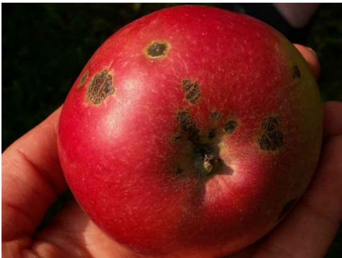
SLIKA 2. SIMPTOM ČAĐAVE PEGAVOSTI LISTA I KRSTAVOSTI PLODOVA JABUKE NA PLODU