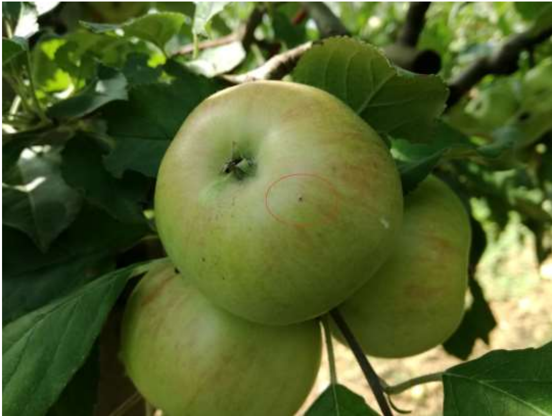
SLIKA 2. JAJE JABUKINOG SMOTAVCA PRED PILJENJE