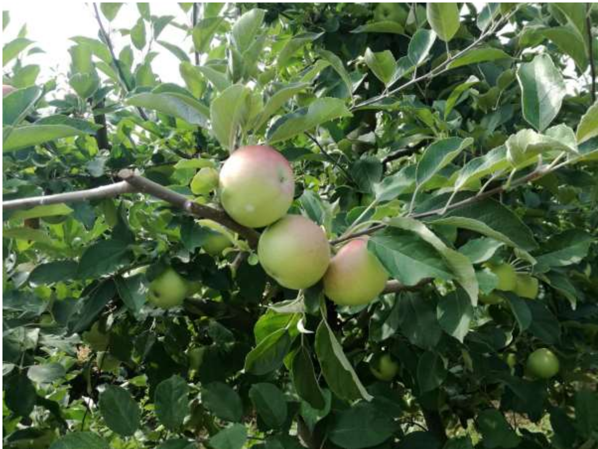
SLIKA 1. FAZA RAZVOJA JABUKA

NA PODRUČJU VOJVODINE, U ZAVISNOSTI OD SORTIMENTA, JABUKE SE NALAZE U RAZLIČITIM FAZAMA SAZREVANJA PLODOVA.